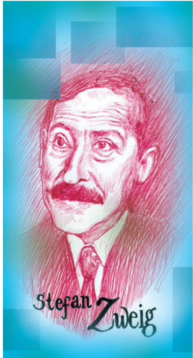
Ilustración: Carlos Mejía

La más cercana de estas alteraciones históricas se suscitó en la segunda década del Siglo XX cuando, al final de la Primera Guerra Mundial, lamentablemente surgieron