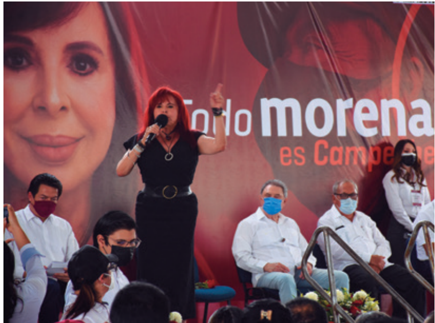
“Layda, desde que entró a la alcaldía, vino con toda la intención de brincarse a Campeche. Nos agarró como trampolín desde un principio y como un cochinito para hacer ese proyecto”.

Anteriormente, los habitantes del área urbana inmediata habían rechazado