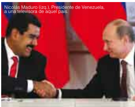
Nicolás Maduro (izq.), Presidente de Venezuela, a una televisora de aquel país.

“Si alguien se merece el Premio Nobel de la Paz en este momento histórico es el presidente Vladimir Putin, quien ha permitido detener una guerra que amenazaba con destruir buena parte de la vida de pueblos que merecen la paz, como el pueblo sirio”.