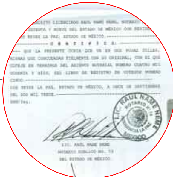
Relación de oficios de asignación del GEM al municipio de Ixtapaluca, donde se prueba el bloqueo económico hacia el municipio, pues sólo ha recibido 8.5 por ciento del monto asignado. Prueba certificada por el notario público No. 79

pobreza y la desigualdad, impulsando proyectos y programas que coadyuven a elevar los niveles de bienestar a través del Gobierno estatal; pero esto no ocurre así: para el caso de Ixtapaluca, se han firmado (por la Secretaría de Finanzas –SF– estatal) oficios con cargo al GIS por 195 millones 181 mil pesos para la realización de obras.