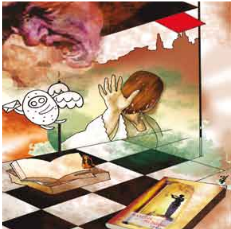
Ilustración: Carlos Mejía

un relato de las desventuras de un naufrago puertorriqueño asentado eventualmente en la capital de México. Este documento puede ser considerado la primera novela testimonial escrita en el país, donde dos y tres centurias después (XIX y XX) habrían de abundar expresiones del mismo híbrido realista: La hija del judío (Justo Sierra O'Reilly), Martín Garatuza (Vicente Riva Palacio), Los bandidos de Río Frío (Manuel Payno), El pecado del siglo (José Tomás de Cuéllar), El filibustero (Eligio Ancona), Astucia (Luis G. Inclán), Tomóchic (Heriberto Frías); La sombra