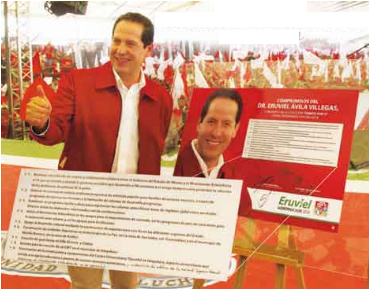
Compromisos firmados ante notario público y 80 mil integrantes del Movimiento Antorchista por el entonces aspirante a gobernador del Estado de México, Eruviel Ávila Villegas.

Pilatos, ni a que pase algún otro hecho lamentable, acudiremos a la Comisión Nacional de Derechos Humanos”, afirmó la abogada. “Con la dilación permiten que los hechos violatorios de derechos humanos sigan existiendo”.