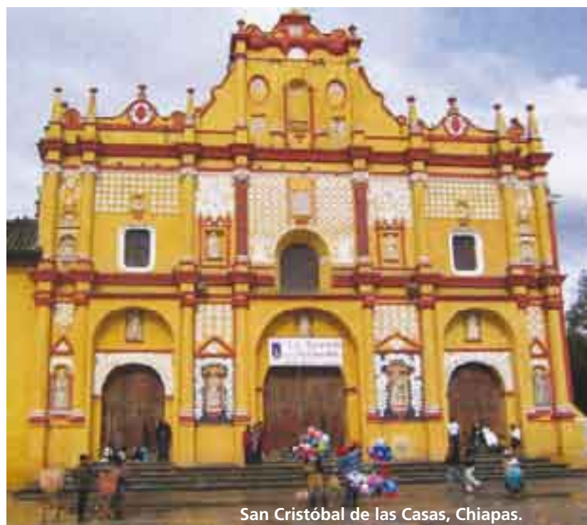
San Cristóbal de las Casas, Chiapas.

“Yo no veo a Huamantla como Pueblo Mágico. Hay otros que sí lo son, pero aquí [el atractivo] nada más es el puro centrito y unos ranchos que hay por acá [pulqueros y ganaderos, y algunos de toros bravos para lidia]. A mi modo de ver, no le veo nada de Pueblo Mágico”.