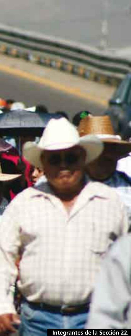
Integrantes de la Sección 22.