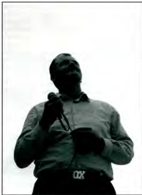
Vicente Fox

presidente, deben tener respeto por ellos mismos. Esto sería muy saludable para todos.