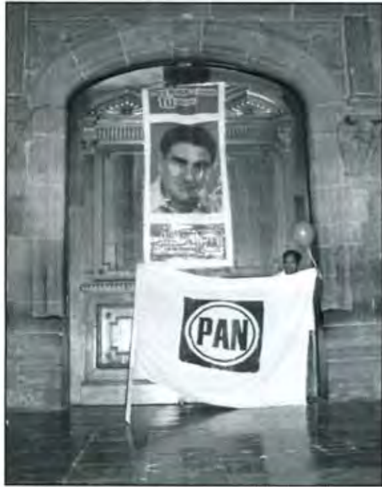
Festejos en la capital del Estado

candidato propio, quien se la tuvo que ver, solo, contra panistas, priistas, perredistas y los de Convergencia Democrática. Habrá que ver si esta variada mezcla de intereses logra cuajar un proyecto para Acatlán, o si el cobro de facturas políticas no desgastará al próximo ayuntamiento panista, como ya se ha observado en otros lugares donde las fusiones coyunturales en corto tiempo dan paso a conflictos reñidos.