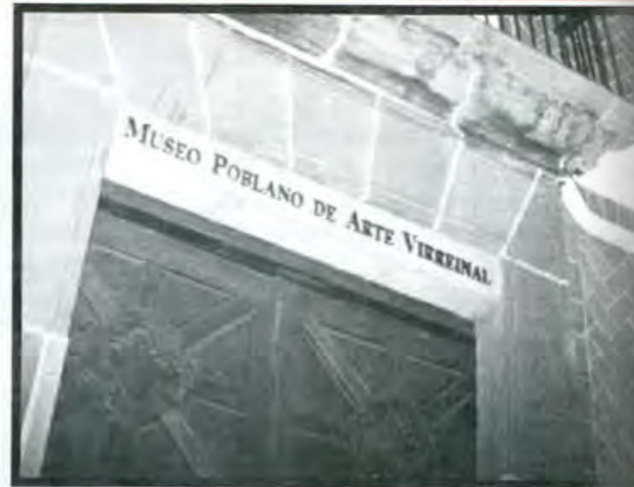
Museo de Arte Virreinal

Originalmente el edificio fue construido como hospital, y fue testigo de algunas de las mas desastrosas pestes, que asolaron la Puebla de los Ángeles. Cuentan las leyendas que, aún, en épocas modernas se escuchaban los quejidos de las almas que en otros tiempos se desprendieron de los respectivos cuerpos de los enfermos que finalmente encuentran la muerte. No habría que extrañarse si todavía pudiéramos encontrar, rascando un poquito algún hueso de uno que otro difunto que todavía se halle enterrado.