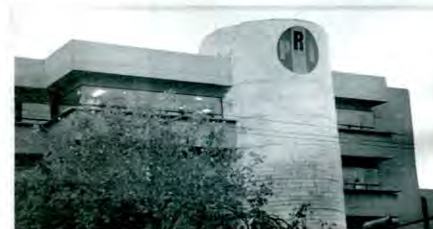
El PRI hoy pierde terreno en el manejo del poder

-Con Fox ha venido el desencanto él nos habla de una cifra en materia de trabajo, el congreso de otra, los sectores tampoco están conformes, hoy se tiene que ser consecuente, como dice Cancino, entre lo que se dice y lo que se hace, el discurso debe de readecuarse.