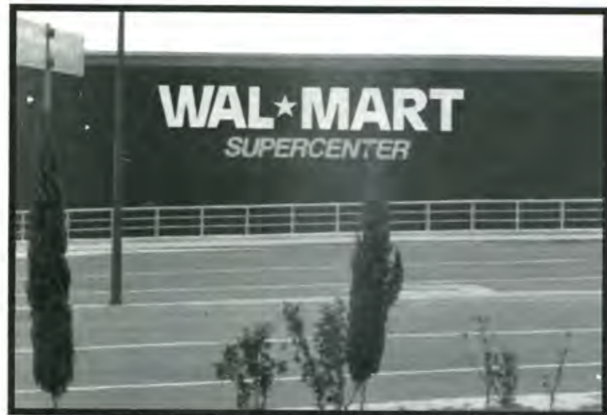
La crisis llevó a inversionistas a encontrar el momento para los negocios en Puebla

municipios del estado como Tehuacán en donde abrió sus puertas la primera tienda de autoservicio Wal Mart y en Atlixco donde se apresuran las obras para abrir la segunda, mientras se decide la localización de terrenos para la tercera en la ciudad de Teziutlán.