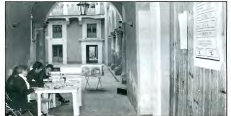
Llama la atención el elevado abstencionismo en todo el estado

En segundo lugar destaca la alternancia en el poder en las principales ciudades del Estado: Puebla, Tehuacán y Texmelucan, donde PRI y PAN no han logrado convencer plenamente a los gobernados, por lo que en estas elecciones cambiaron de ánimos; la excepción es el caso de Atlixco, que permanece en poder del PAN. De mantenerse esta tendencia, nada seguro tienen estos partidos dentro de tres años.