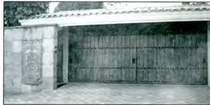
El camino a Casa Puebla es muy largo y con severos obstáculos

Ante ello, una realidad se empieza a mostrar. Seguir al pie de la letra el recetario que el FMI dictamina, implica una disciplina fiscal para conseguir las metas, tanto fiscales como monetarias. Por lo tanto, empezamos a percibir hacia qué lado la balanza se empieza a inclinar: hacia la Reforma Fiscal. Ésta tiende a simplificar el sistema porque permite una disminución importante de la Deuda Pública, además de ser un método básico