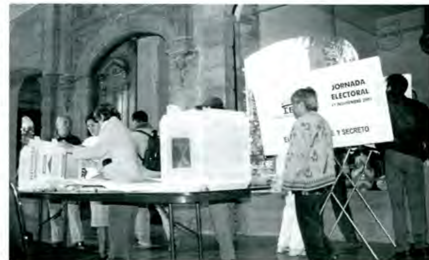
La pasada jornada electoral ha dejado cosas interesantes para el análisis

En el ámbito nacional ha quedado claro que, la transición política hacia la democracia, ha quedado postergada para un mejor momento. Es decir, Vicente Fox, simplemente tratará de cumplir con las recetas que el FMI dictamina, para de esta manera, poder entregar una economía sana, como lo hizo en su momento Ernesto Zedillo, y aparecer con una evaluación aceptable ante los criterios de este instituto monetario. Lo anterior quedará más claro cuando nos enteremos qué tipo de presupuesto se aprobó para el año próximo. Recordemos que por vez primera, y atendiendo a un entorno