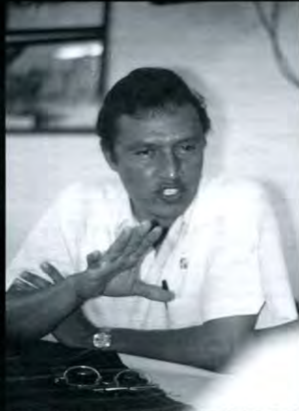
Lo ocurrido en Acatlán puede calificarse como la crónica de una derrota anunciada

En segundo lugar, conviene traer a la memoria algunos sucesos relevantes ocurridos durante todo el período previo a la elección constitucional y que ya anunciaban, con toda claridad, la maniobra en contra del