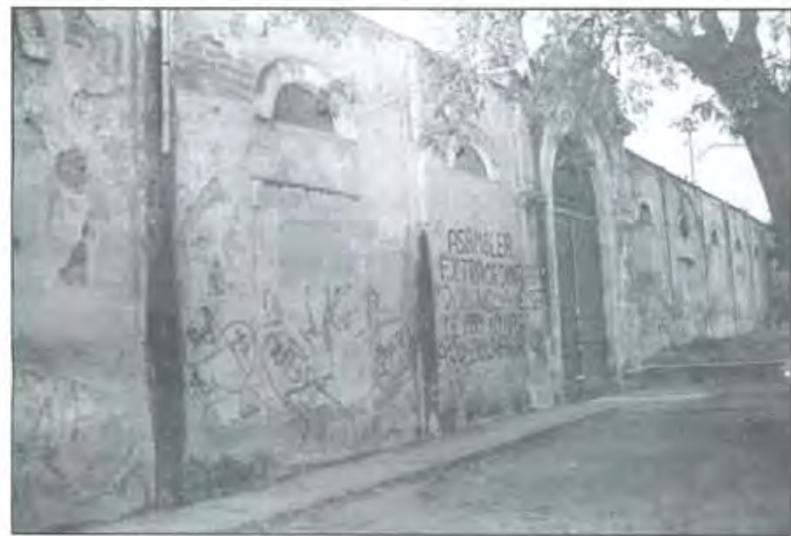
Es necesario rescatar y preservar el conjunto arquitectónico fabril

La Constancia contó con espacios amplios. Primero con Antuñano se construyó una sala y después se edificó otra; también el secretario les proporcionó casas a los trabajadores Francisco M. Conde cambió entre 1904 y 1909 la fisonomía de la fábrica; amplió considerablemente las instalaciones dotándola de grandes bodegas para almacenar el algodón y la producción. Posteriormente otros dueños fueron haciendo anexiones a algunos departamentos, el área de talleres, el departamento de tejido y el de hilado sufrieron modificaciones al introducir más maquinaria.