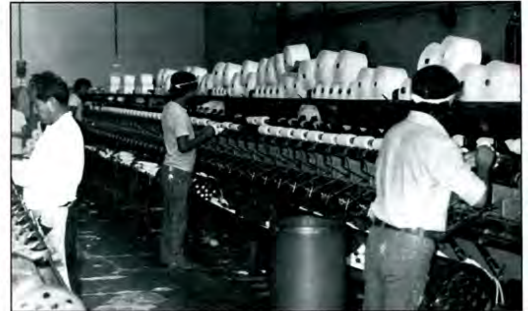
...dificultades por la baja productividad del equipo industrial y los costos de producción, foto: Miguel Torres Benítez

Con el mismo equipo industrial estuvo operando la unidad productiva hasta después de la segunda guerra mundial, época en la que los empresarios obtuvieron altas ganancias. A principios de los años cincuenta del siglo XX la industria textil se modernizó de manera global, pero en “La Constancia