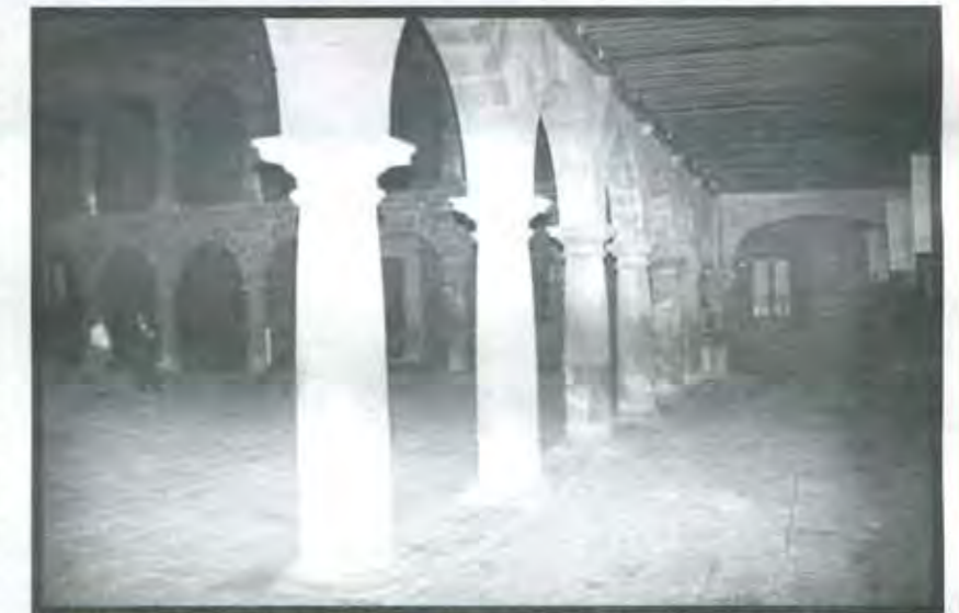
Originalmente el edificio fue construido como hospital.

¡Pícale los ojos! ¡Sácale la lengua! ¡Rómpele los huesos! ¡Mándalo a...! Era poco lo que uno se imaginaba ante las obscenidades que escuchaba provenientes de las sagradas y santas bocas de las madrecitas enardecidas de furor porque los rudos luchadores iban ganándole a "los técnicos" con sus "porquerías" y su "gachadas".