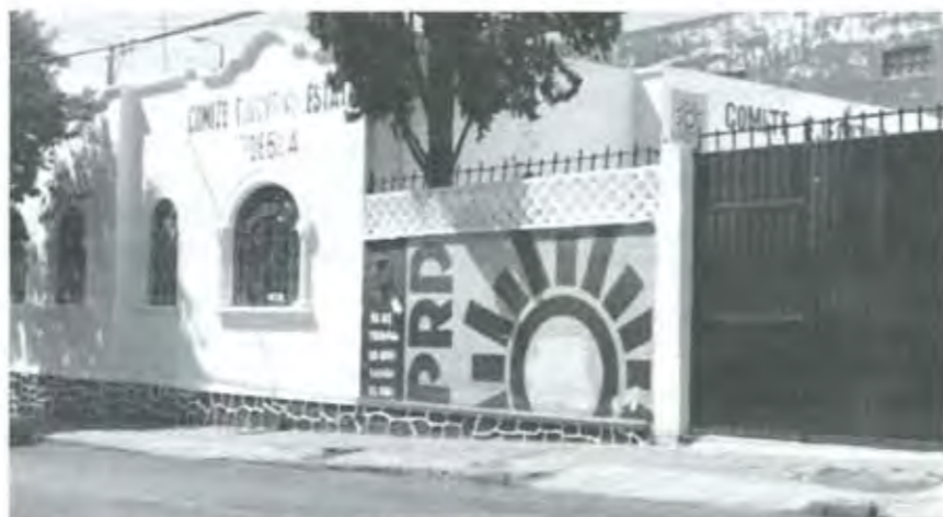
El PRD es un partido de izquierda

-En el caso de Puebla específicamente, no coincido con algunos compañeros, incluso del PRD, analistas, en el sentido de que señalan un avance de la oposición ¿cuál oposición? ¿somos todos el abanico de seis, siete partidos, la oposición, incluyendo los emergentes? no, por definición y principios, eso es lo que establece cada partido en sus estatutos y en sus documentos básicos. -No somos oposición todos, el PRD es un partido que por definición es de izquierda, por lo tanto no podemos meterlo al conjunto de la oposición, el PAN es un partido por definición de derecha, entonces lo que se dio en Puebla fue el avance de la derecha y su reposicionamiento histórico ganando la capital del estado. Esto a quien más le trae consecuencias es al PRI, igual que el proceso de Michoacán y Tlaxcala, aunque no hayamos avanzado como partido, como PRD, incluso en el triunfo obtenido en Sinaloa, lo que se demuestra es que el PRI hoy pierde terreno en ese bipartidismo y en ese manejo del poder.