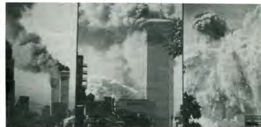
Después de los atentados viene la secuela económica

Pero como es de comprenderse, el problema no se queda en las líneas aéreas, pues como todos los sectores industriales están unidos como eslabones de una cadena, lo que ocurre en uno se transmite a los otros. Ahora mismo, la reducción en las ventas de las aerolíneas está impactado a las empresas fabricantes de aviones. Boeing, la más importante de este sector en Estados Unidos, debía producir para este año 528 aeronaves, pero ya ajustado su plan a futuro, para fabricar sólo 420 el año entrante y únicamente 343 para el 2003. El petróleo es otro de los sectores que podría verse amenazado. En el escenario de una generalización del conflicto en Medio Oriente, hay serios temores de un posible incremento en el precio y problemas de suministro, que afectarían en lo inmediato al primer consumidor de combustible del mundo: