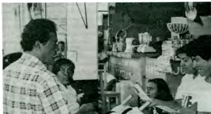
Nada sustituye el contacto directo con la gente