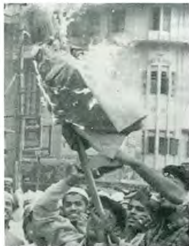
¿Qué pasará con el Medio Oriente?

Los sucesos del pasado martes negro, han dado pie a una infinidad de interpretaciones. En lo que concierne a nosotros, cabe destacar una observación sobre la cual desplazaremos nuestra reflexión.