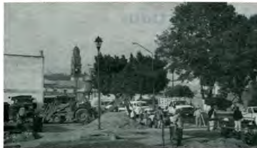
Listos para acudir al primer llamado de los E.U.A.

Para los últimos días de octubre el Congreso Internacional de Gastronomía que promueve la UNESCO, y para noviembre la mejor cita del año: la Exintex que capta en una semana más de 25 mil visitantes que consumen, compran y duer-