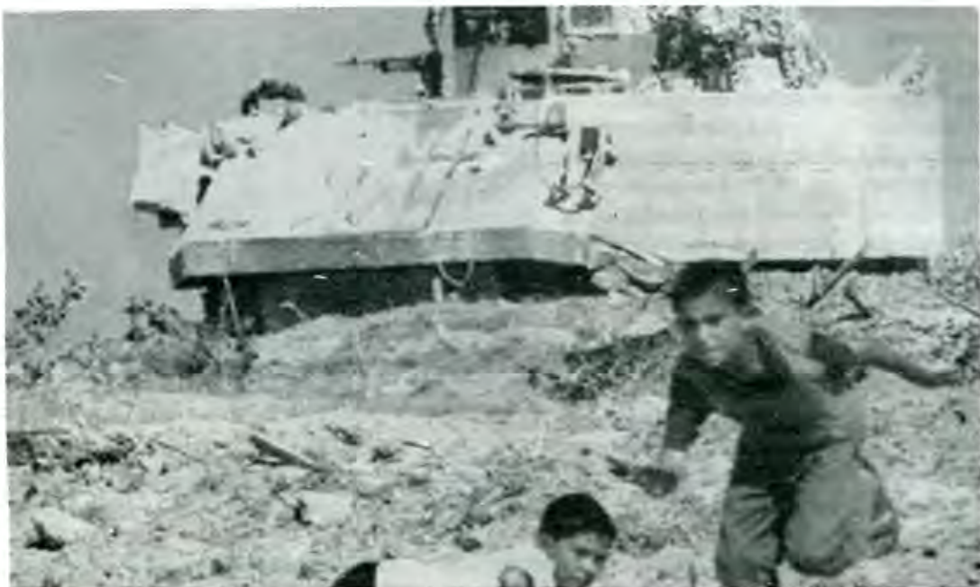
"No es sólo un pequeño grupo de terroristas fanáticos..."

Cuando la Guerra Fría parecía haber sido ganada por los Estados Unidos, un enemigo cada vez más audaz realiza lo que parecía increíble: golpear duramente al imperialismo en su propia tierra.