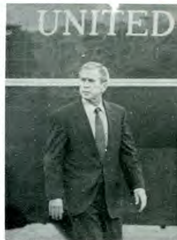
George W. Bush

la técnica, los fundamentos de sus formas y técnicas prácticas de violencia material, física y espiritual, y el Medio Oriente la ha encontrado y la está utilizando. Sin embargo, no podemos culpar del todo a esta región, puesto que el ataque ha sido de una minoría que ha seguido fiel a los postulados de la modernidad. Al respecto conviene que no perdamos de vista el hecho de que el ataque haya provenido del mismo territorio dañado. Recordemos que también existe una destrucción creativa y aquí cito textual a J.A. Schumpeter (Capitalismo, socialismo y democracia. Javier Vergara, 1984): "El impulso fundamental que inicia y mantiene el movimiento de la máquina capitalista surge de los nuevos bienes de consumo [...] nuevos métodos de producción o transporte [...] nuevas formas de organización industrial [...] apertura de nuevos mercados [...] ilustran al propio proceso de mutación industrial [...] que incesantemente revoluciona la estructura económica desde dentro, incesantemente destruyendo la vieja, incesantemente creando una nueva. Ese proceso de destrucción creativa es un he-