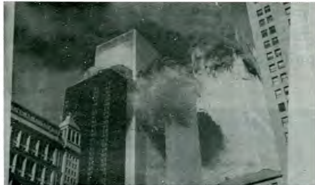
"Lo increíble sucedió"

Y ese es el gran problema para el gobierno norteamericano y sus aliados: La repuesta que el pueblo islámico pue-