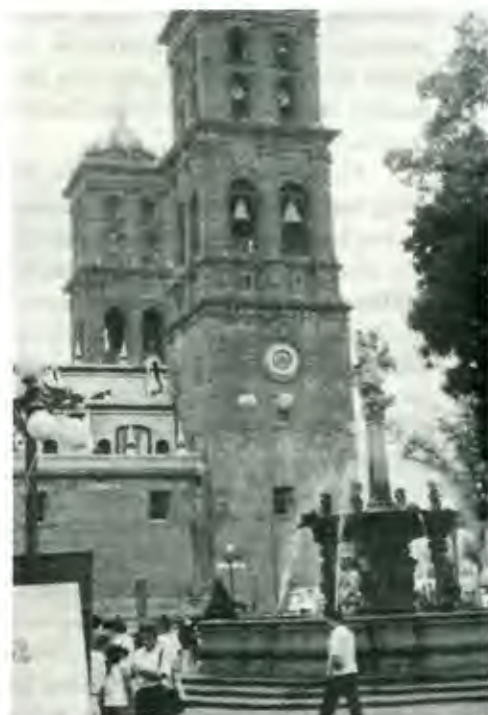
Comienza la fiesta en Puebla