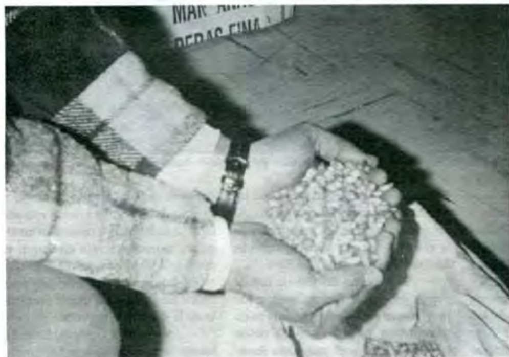
Las semillas tratadas en laboratorios incrementan la productividad y calidad de la cosecha

Para los productores, la simple producción de semillas puede dejarles