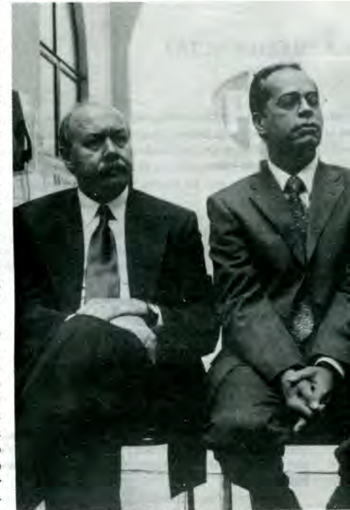
González y Giorgana, ¿Podrán llevar al PRI al triunfo municipal?

Uno de los últimos traspiés del dirigente estatal. A principios de mes