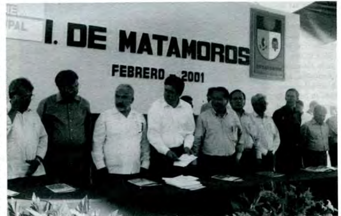
Segundo Informe de Gobierno

Y es que a pesar de su posición estratégica como punto de entrada a la mixteca poblana, y a los estados de Morelos, Guerrero y