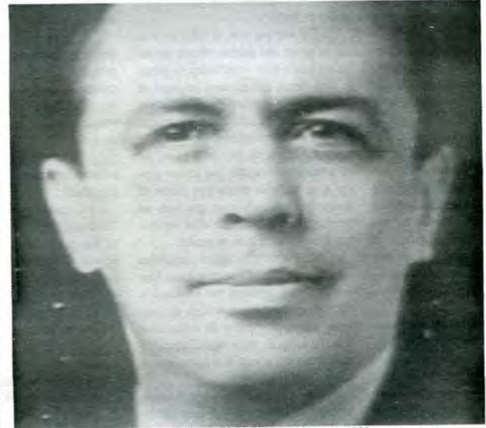
Manuel Gómez Morín, fundó al PAN en 1939

Hay municipios difíciles para el PRI, como lo son Tehuacan y Texmelucan por ejemplo, pero esas dificultades se agravan cuando hay imposición de candidatos o cuando el