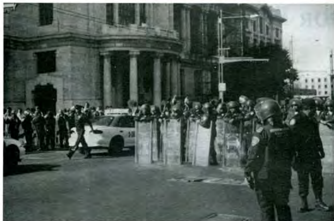
Granaderos del DF preparándose para evitar marcha.