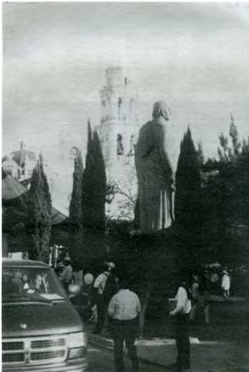
Centro de Izúcar de Matamoros

tuvo una votación de más de siete mil votos, superando al PRI con más de tres mil sufragios. Desde esta posición, los directivos del