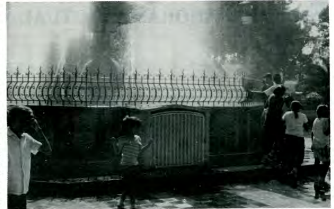
Niños refrescándose el día del informe

Y mencionó tres ejemplos: hay 274 mil pesos en el adoquinamiento