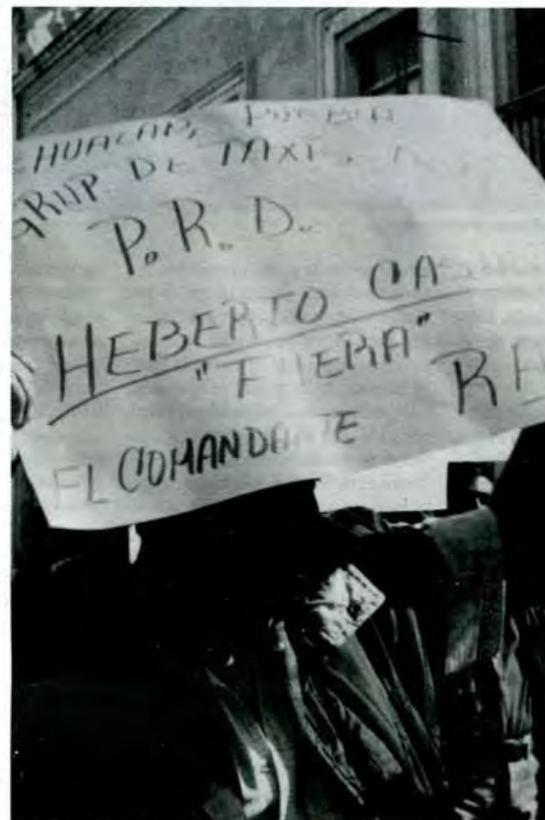
Marchas, mítines y plantones, resultante del ejercicio de los derechos de asociación

En efecto, si, como sostienen muchos conocedores de la materia, marchas, mítines y plantones no son más que la resultante obligada del ejercicio de los derechos de asociación, manifestación pública y petición, consagrados en la Constitución General de la República, por parte de la ciudadanía, cae por su propio peso la conclusión de que los mismos no pueden ser objeto de