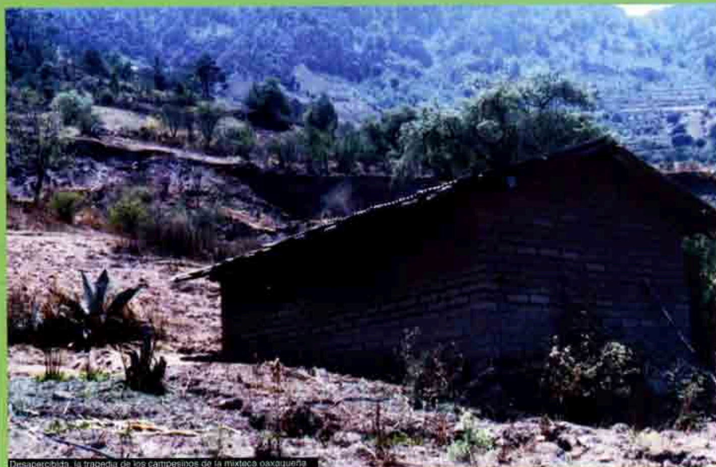
Desapercibida, la tragedia de los campesinos de la mixteca oaxaqueña

A diecinueve kilómetros de Yolomecatl en el distrito de Tlaxiaco, se encuentran Guadalupe y Cabayúa Monteverde, dos comunidades enclavadas en la Mixteca oaxaqueña, la tierra árida y los cerros descubiertos dan una sensación de melancolía, sólo los pequeños caminos son testigos de que alguien habita aquellos alejados y desconocidos lugares, al bajar por esos caminos de terracería viene a la mente aquel fragmento tan conocido "se sube o baja, según se va o se