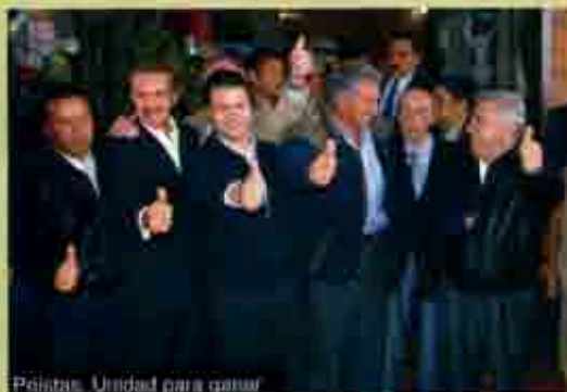
Panistas. Unidad para ganar