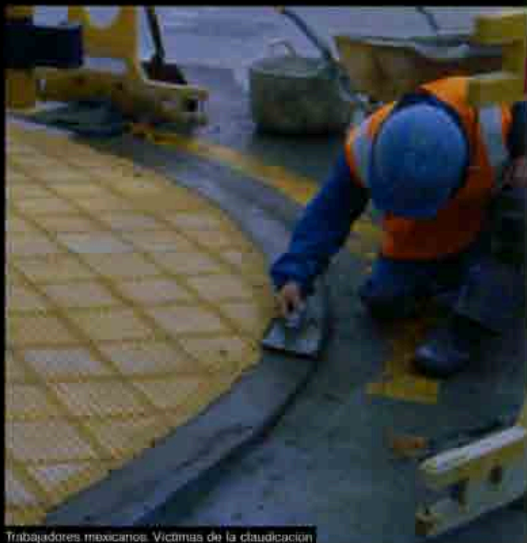
Trabajadores mexicanos. Víctimas de la claudicación

"Tomamos como referencia la lucha de los obreros de América Latina, los bolivianos, uruguayos, brasileños; pero la más significativa es la de los argentinos, es un ejemplo como se están recomponiendo, poniendo en sus manos los