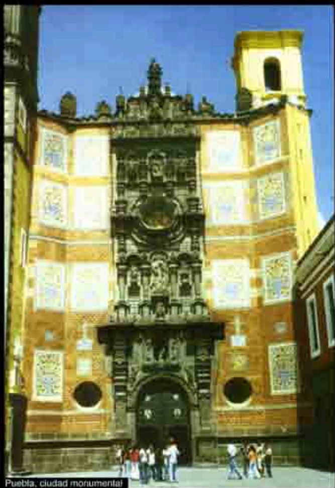
Puebla, ciudad monumental

Treinta familias españolas, y una viuda, fueron las primeras