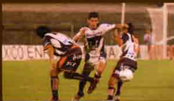
La élite del fútbol. Competencia en la liguilla

precisamente, los Monarcas, los de la UAG y las Águilas, aunque los Potos podrían colarse como uno de los mejores de la tabla general.