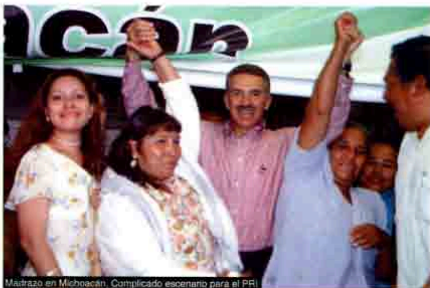
Mastrazo en Michoacán. Complicado escenario para el PRI

La convocatoria puntualizó que la fórmula debería estar