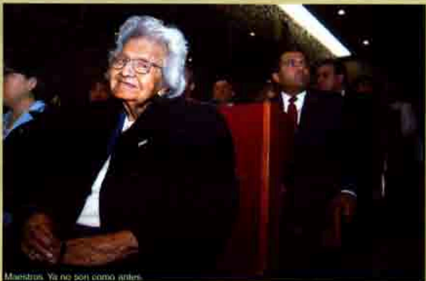
Maestros. Ya no son como antes.

Si usted se fija bien, las normales, que durante muchos años fueron semillero de mentores y que propiciaron la