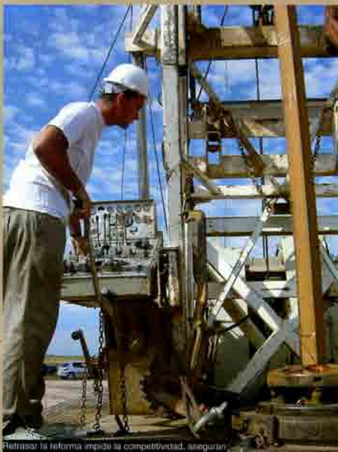
Retrasar la reforma impide la competitividad, aseguran

aprobación de la reforma a la 'Ley federal del trabajo'. Sin embargo, ésta se quedó en el limbo por la remoción de la propia coordinadora priísta, instrumentada por su presidente de partido, Roberto Madrazo Pintado, por mediación de su grupo.