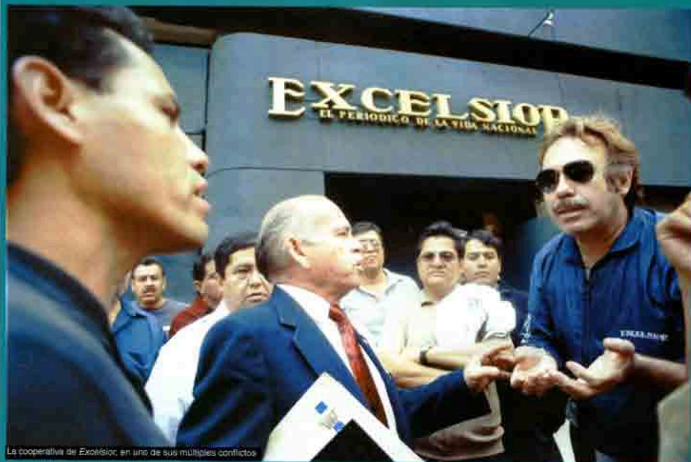
La cooperativa del Excelsior, en uno de sus múltiples conflictos

E n sus inicios, en la economía de mercado predominaban empresas pequeñas, algo cercano a lo que se concibe como competencia perfecta. Se requería poca inversión e infraestructura, con pocos obreros y talleres pequeños; sin embargo, conforme el capitalismo evolucionó, se ha impuesto como una férrea necesidad la concentración del capital en unidades económicas cada vez mayores; ya no bastan algunos caballos y un par de diligencias para establecer una compañía de transportes. Las empresas grandes absorben a las pequeñas, que tienden a arriarse al no poder competir con aquellas, por lo que