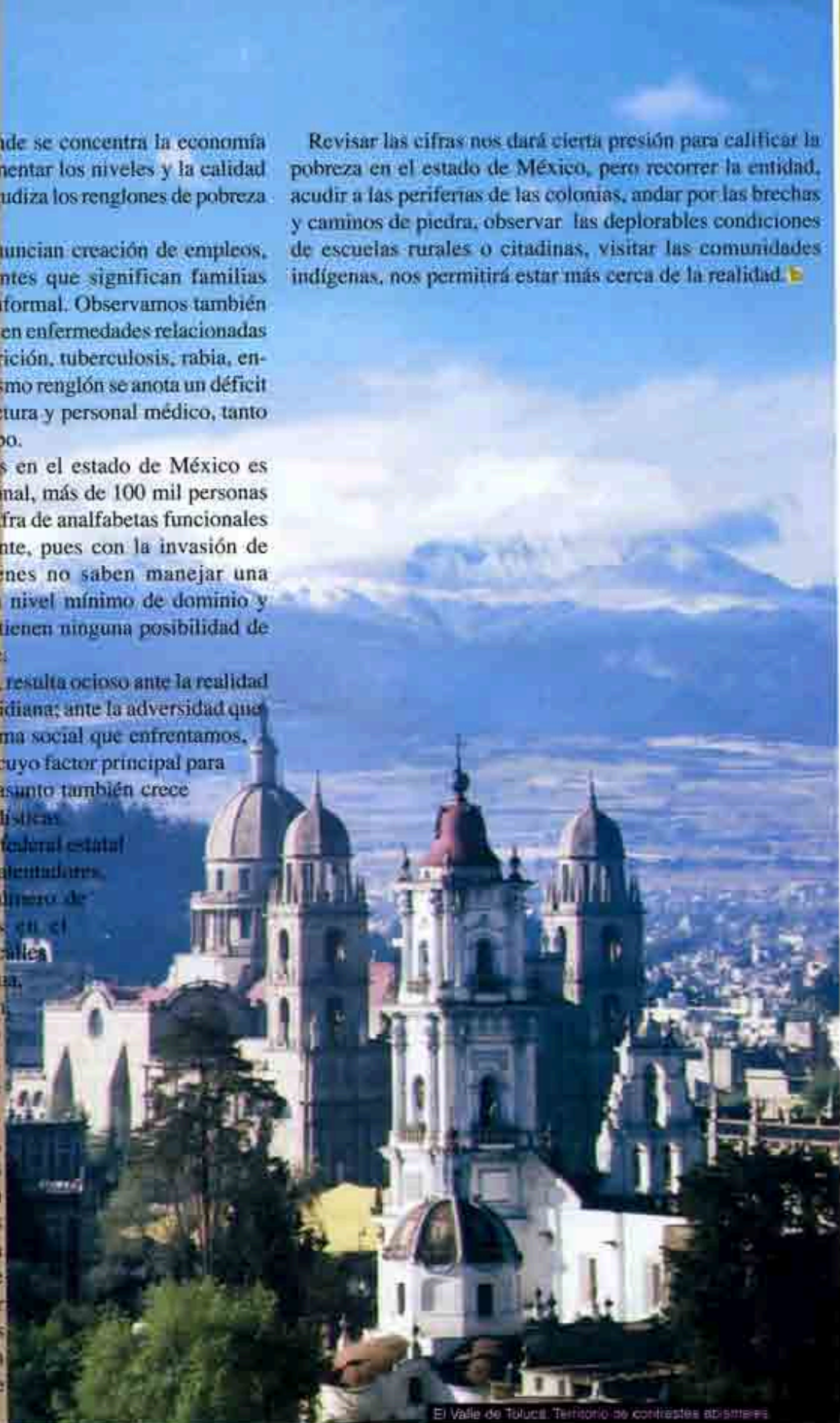
El Valle de Toluca. Territorio de contrastes abismales

Revisar las cifras nos dará cierta presión para calificar la pobreza en el estado de México, pero recorrer la entidad, acudir a las periferias de las colonias, andar por las brechas y caminos de piedra, observar las deplorables condiciones de escuelas rurales o citadinas, visitar las comunidades indígenas, nos permitirá estar más cerca de la realidad. ▀