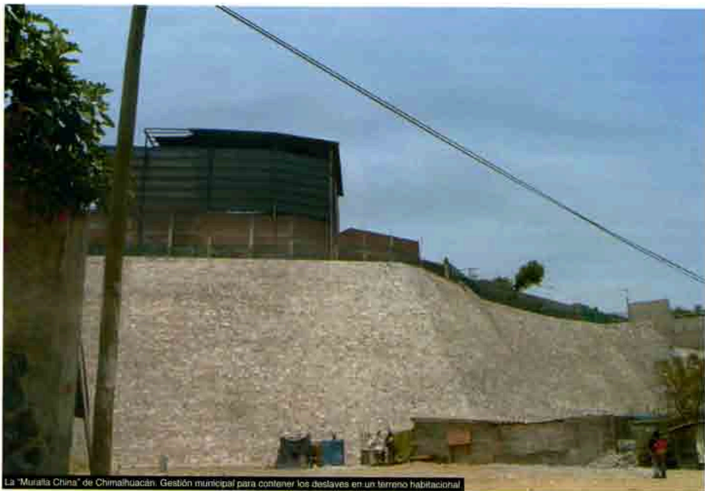
La "Muralla China" de Chimalhuacán. Gestión municipal para contener los deslaves en un terreno habitacional

Una lucha social por 150 millones de pesos para los pobres