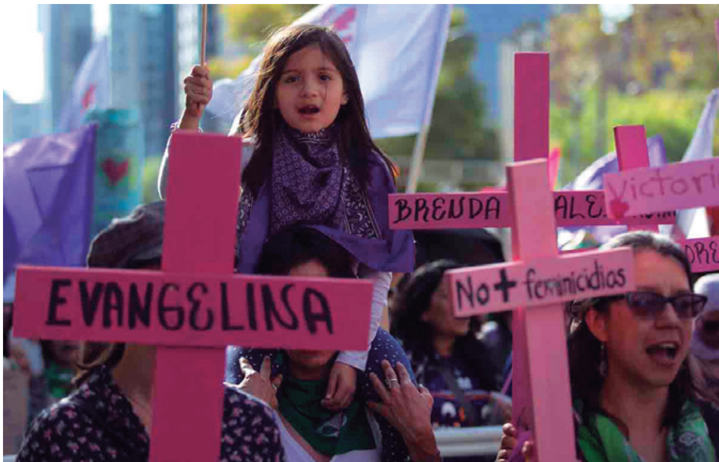
De los seis municipios potosinos con alerta de violencia de género, San Luis-capital se situó en el lugar 13 de los 100 municipios de la República Mexicana con más asesinatos de este tipo. La alerta contra la violencia de género (AVG) fue declarada el 21 de junio de 2017 en Ciudad Valles, Matehuala, SLP-capital, Soledad de Graciano Sánchez, Tamazunchale y Tamuín.