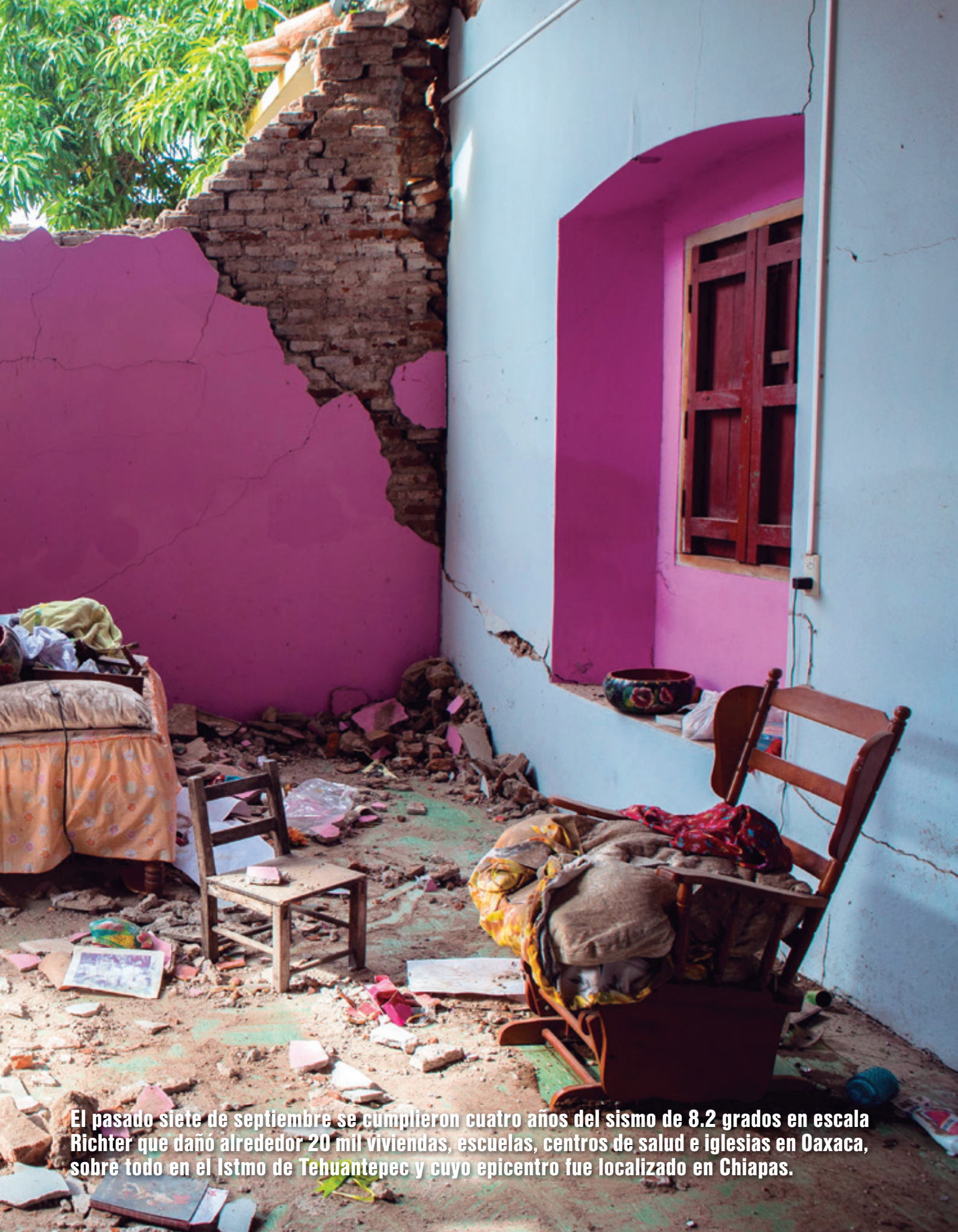
El pasado siete de septiembre se cumplieron cuatro años del sismo de 8.2 grados en escala Richter que dañó alrededor 20 mil viviendas, escuelas, centros de salud e iglesias en Oaxaca, sobre todo en el Istmo de Tehuantepec y cuyo epicentro fue localizado en Chiapas.