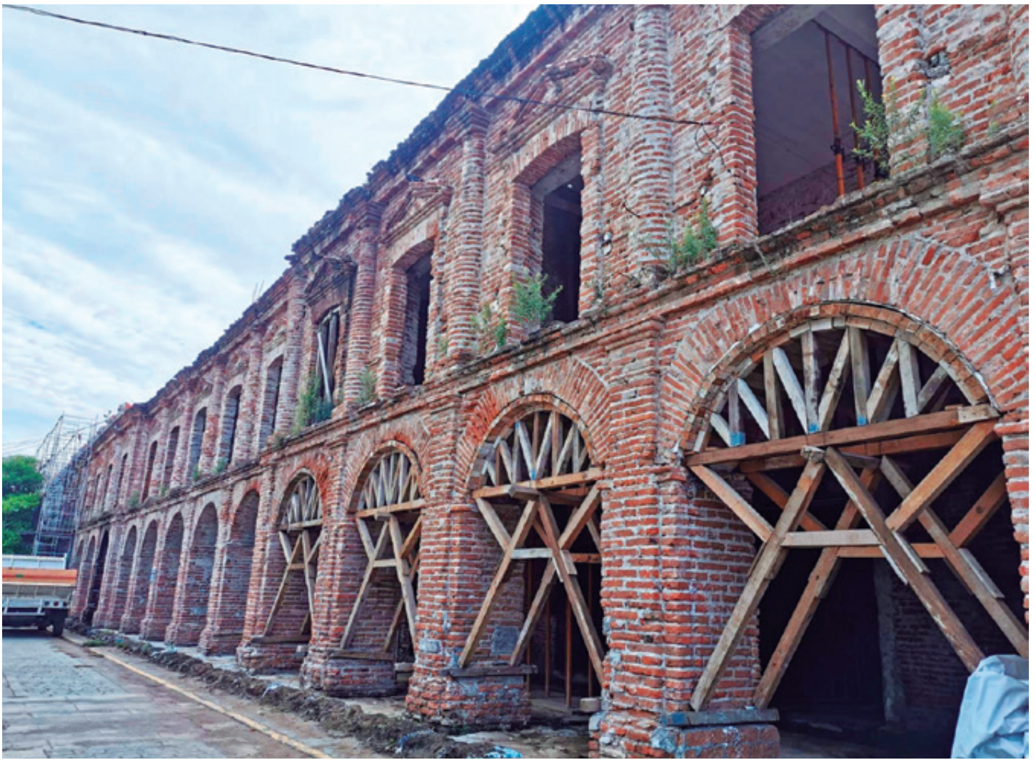
A cuatro años del sismo, promete Gobierno Federal terminar reconstrucción del Palacio Municipal de Juchitán en 2022.

E l terremoto de septiembre de 2017, uno de los más fuertes en la historia reciente de México y superior en intensidad al del 19 de septiembre de 1985, provocó la muerte de 79 personas y afectó a otras 800 mil tan solo en Oaxaca. Pocos días después, el 19 de septiembre, se registró otro con una magnitud de 7.1 grados con epicentro en los límites de Puebla y Morelos, que afectó a estos estados, la Ciudad de México (CDMX) y las regiones mixtecas de Guerrero y Oaxaca. Cinco meses más tarde, otro movimiento telúrico, de magnitud 7.2 grados, con epicentro en la costa oaxaqueña, dañó alrededor de 50 viviendas.