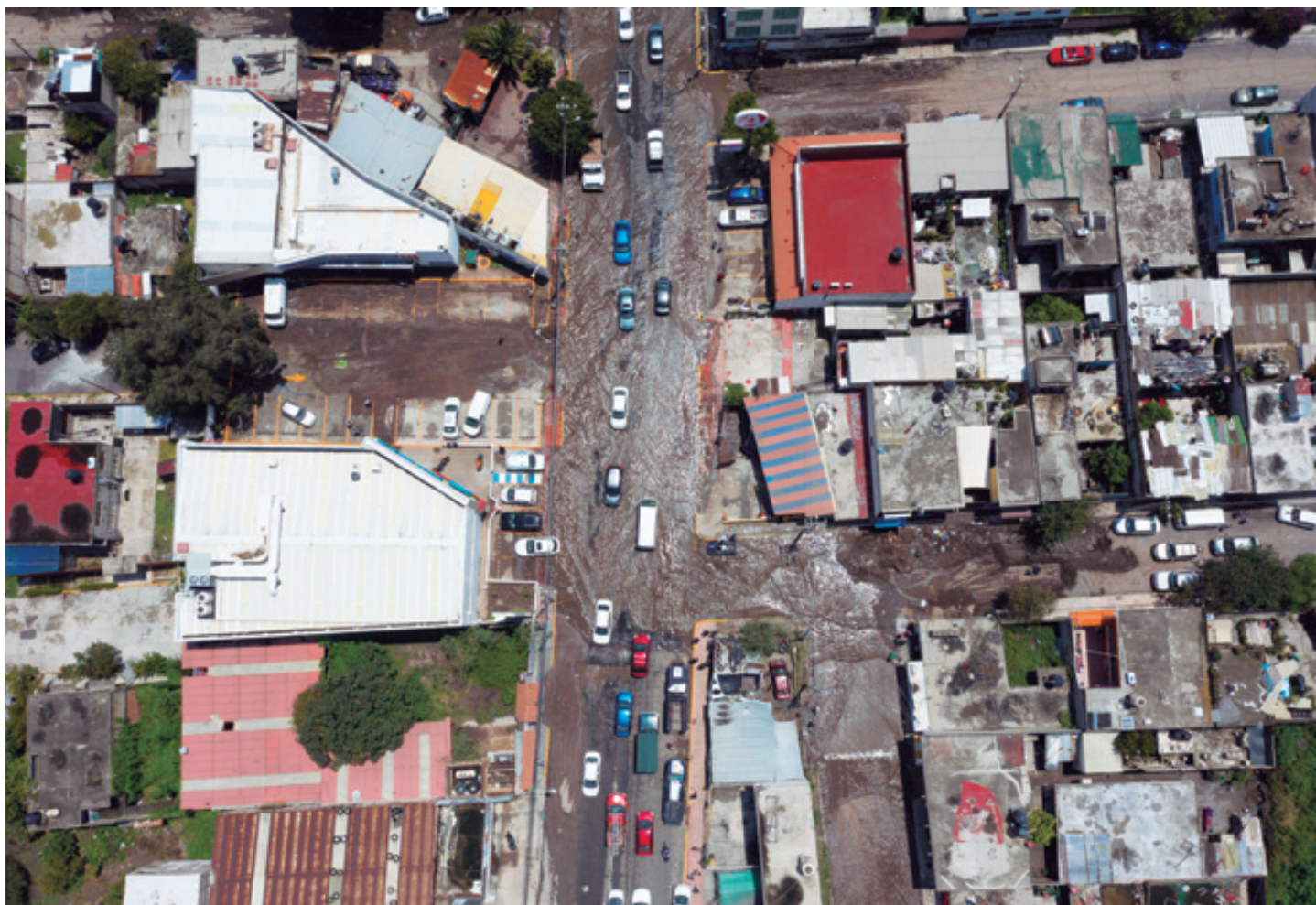
“Algunas colonias de Ecatepec siguen bajo el agua; el nivel ha disminuido solo cinco centímetros; y en Chalco continúa la limpieza de los hogares. Pero será muy difícil superar esta situación sin la ayuda de las autoridades correspondientes. Por ello acudimos también a la Cámara de Diputados local para pedir la intervención y el auxilio para ambos municipios”.

coladeras ni se le dé mantenimiento a cárcamos que pudieran ayudar a desalojar las aguas de lluvia. Son ellos quienes, hasta el momento, no tienen certidumbre de dónde pasarán las noches, incluida una mujer que dio a luz y mantiene a su bebé en condiciones inhumanas dentro de su hogar; son ellos los que, en estas lluvias, perdieron su modesto patrimonio”, puntualizó.