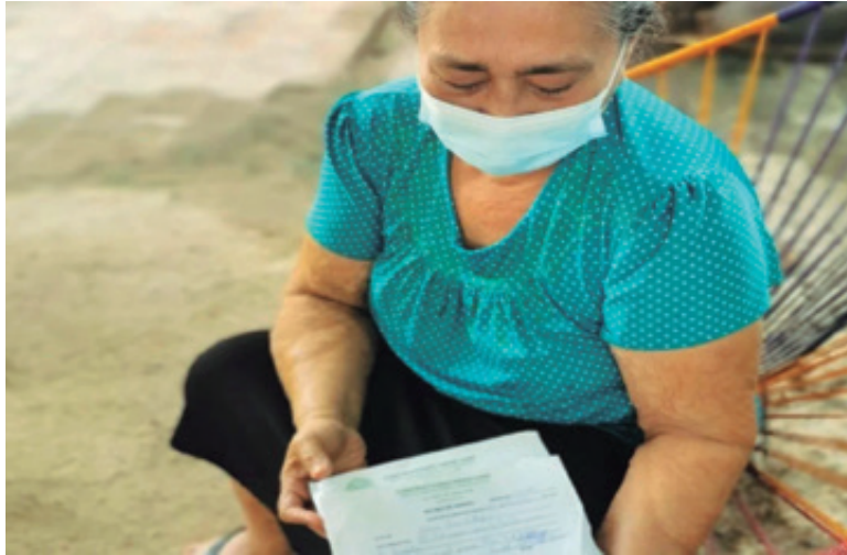
Son miles los damnificados (abajo) que aún no reciben ayuda gubernamental, pese a que sus nombres figuran en los dos censos efectuados y que hasta el pasado siete de septiembre seguían esperando el apoyo ofrecido.

Integrantes de la Comisión Especial de Seguimiento al Uso y Destino de los Recursos Presupuestales Asignados a Trabajos de Reconstrucción de los sismos de 2017 y 2018 han denunciado que son miles los damnificados que aún no reciben ayuda gubernamental, pese a que sus nombres figuran en los dos