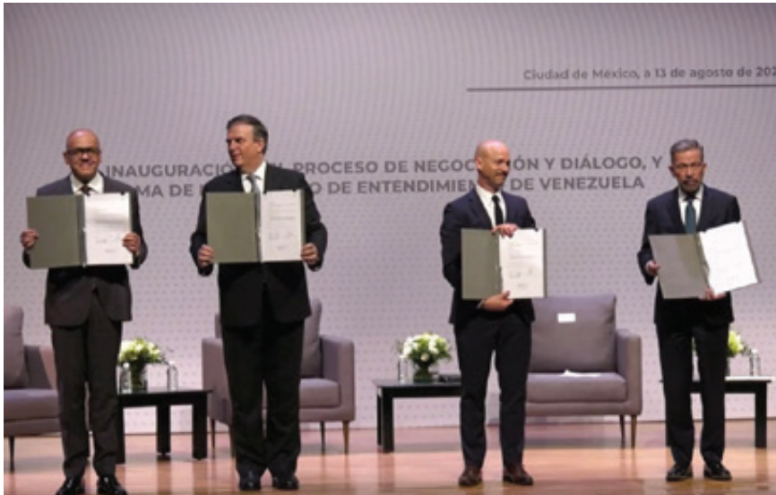
Cautela, máxima precaución y prudencia son los puntales de esta negociación trascendente que se celebró en la CDMX el quinto diálogo formal entre gobierno y oposiciones venezolanas desde 2013.

negociación marca un hito en la crisis venezolana. Para algunos, el gobierno bolivariano obtiene grandes réditos: reconocimiento internacional que apuntaría a desbloquear activos y reducir sanciones a cambio de ceder en algunas cuestiones de índole electoral.