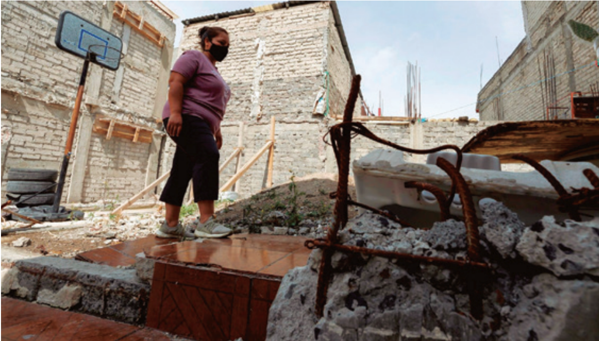
Los pobladores de Pinotepa Nacional recibieron una primera ayuda para reconstruir sus viviendas y otros inmuebles, pero nunca llegó para la segunda etapa de la reconstrucción.

20 Francisco J. Santiago Hernández @BuzosNoticias