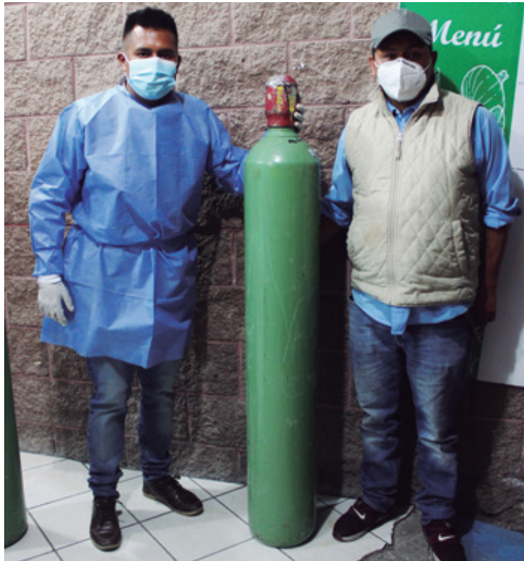
El gobierno de Chimalhuacán planteó un nuevo reto: proveer de oxígeno gratuito a los pacientes de más escasos recursos. El oxígeno se había convertido en el bien más preciado a lo largo del país, como lo evidencian las enormes filas en los expendios, sus precios altos, incluso el robo de tanques del gas medicinal en las carreteras.

El Centro de Atención COVID-TEL representa otra herramienta contra el Covid-19 en Chimalhuacán, con el objetivo de atender las 24 horas y los siete días de la semana los casos sospechosos o confirmados, a través del número telefónico 55-75-83-90-49, las 24 horas. Este servicio es atendido por médicos, psicólogos y trabajadores sociales que