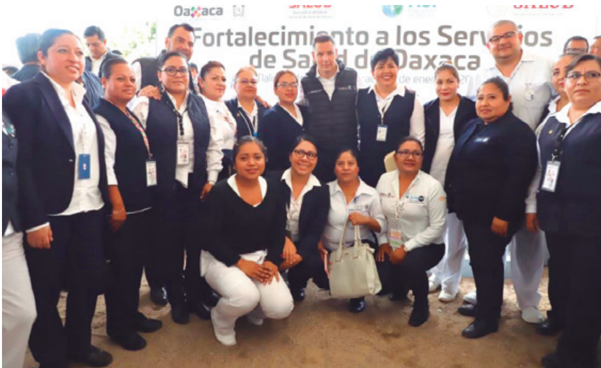
Alejandro Murat reconoció que se han desviado más de ocho mil mdp de los descuentos efectuados a los trabajadores mediante la nómina. “Oaxaca enfrenta la pandemia del Covid-19 con un sistema de salud en déficit presupuestal y deudas por impuestos correspondientes a ocho mil millones de pesos”, sostuvo.

Vasconcelos, quien actualmente se encuentra preso por el desvío de 100 mdp. La SC precisó, sin embargo, que no se ha iniciado ninguna denuncia contra el gobierno de Murat Hinojosa y los titulares de los SSO por el desvío de más de seis mil mdp por la misma práctica.