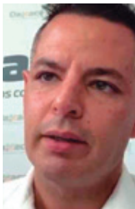
Alejandro Murat Hinojosa