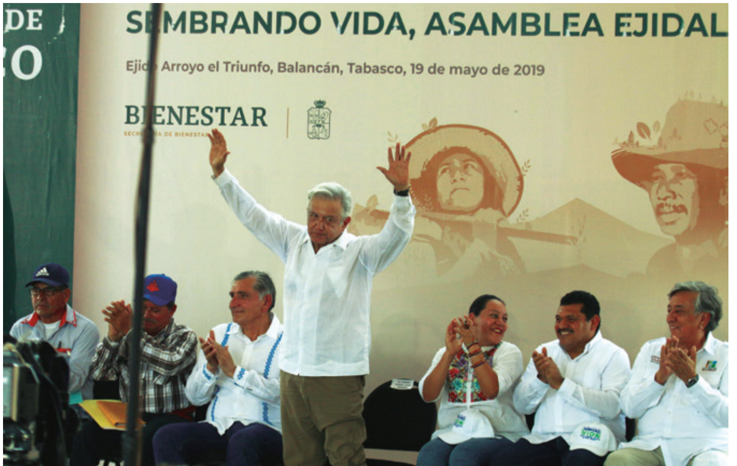
AMLO anunció, el 19 de mayo de 2019 en Balancán, Tabasco, la conversión del Sistema de Administración y Enajenación de Bienes (SAE) en el Indep, que en adelante controlaría los bienes asociados a presuntos actos de corrupción con base en una nueva versión de la Ley Nacional de Extinción de Dominio, la cual se publicó el nueve de agosto de 2019, en el Diario Oficial de la Federación (DOF) .