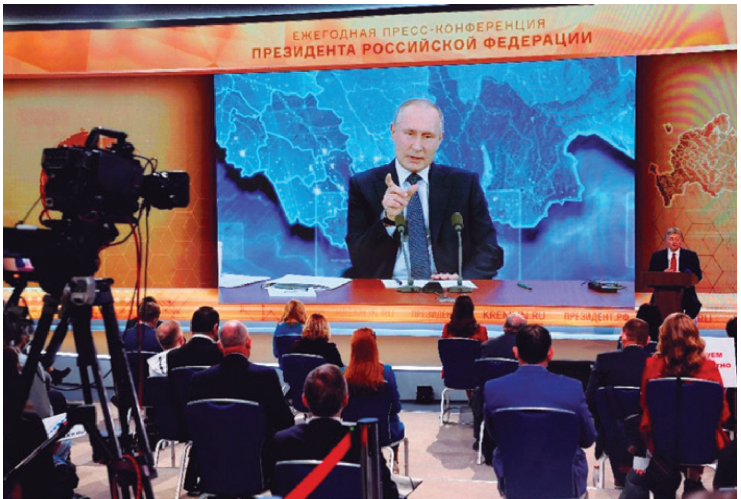
El tercer eje de acción que EE. UU. desplegó contra Rusia es una estrategia de emergencia, pues ve que su caballo de Troya no logra el efecto esperado. Entonces acusó al gobierno de Vladimir Putin de violar el tratado de la Convención sobre Armas Químicas “por usar un agente nervioso”.

y brindaron todo el apoyo –que no es poco– en detrimento de la imagen internacional del gobierno ruso.