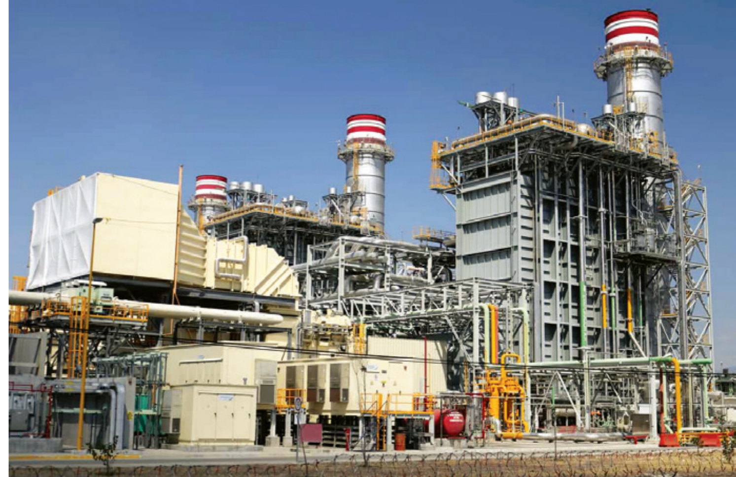
En la Termoeléctrica de La Huexca se alzan tres grandes torres, donde se ubican las turbinas, que requerirán grandes cantidades de agua. Uno de los extrabajadores señaló a buzos que por la dimensión de las turbinas, se requeriría “mucho agua del río, porque no tienen pozos”.

Él se puso al frente de los campesinos cuando se descubrió que pretendían quitarles el agua. “No vamos a permitir ese proyecto de Termoeléctrica, porque nos viene a perjudicar nuestras tierras. No quieren entender que Morelos es un estado productor de alimentos, de