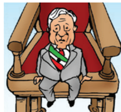
CARTÓN 43 Dulces sueños Luy