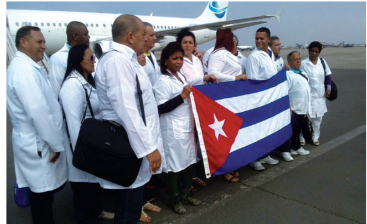
La Cuba revolucionaria envió el contingente Henry Reeve, con 52 especialistas, a las zonas más afectadas de Italia, en situación de desastre y graves epidemias.

La isla, que sufre un cruel bloqueo económico-financiero por parte de