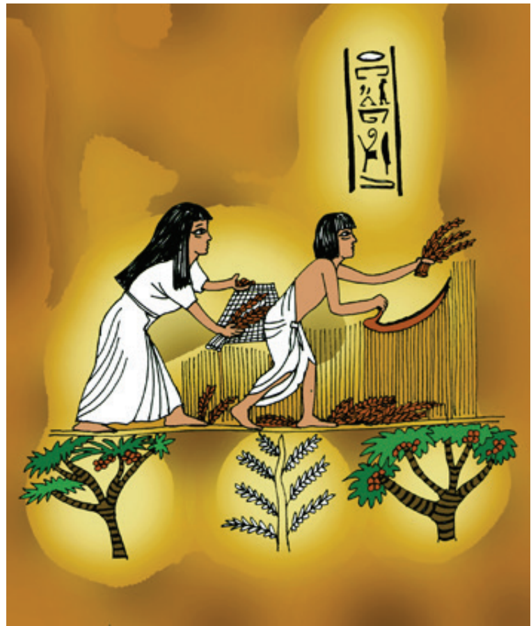
Ilustración: Carlos Mejía

En las áreas urbanas había un sistema residencial de correos; se usaban también mapas para localizar lugares de difícil acceso en el Alto y el Bajo Egipto (Tebas y el Delta, respectivamente), en el desierto colindante con Libia y en la