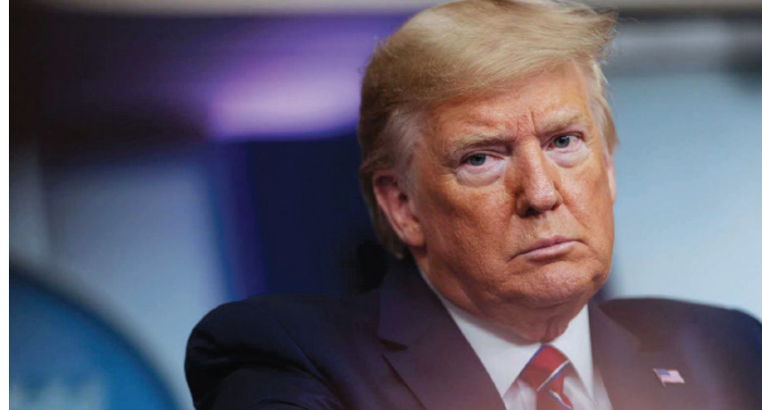
El Presidente Donald Trump desató gran polémica al indicar que muy pronto se comenzará a relajar las medidas de distanciamiento social que se adoptaron para frenar el avance del coronavirus, pese a un nuevo pronóstico de la OMS, según el cual EE. UU. es el nuevo foco de la pandemia.

Es significativo que los 54 países de África tengan pocos casos registrados. Inquieto, Occidente pregunta si esa baja se debe a la falta de pruebas. Para los expertos, la lenta dispersión es por el colapso de la infraestructura africana tras la epidemia del Ébola y, por tanto,