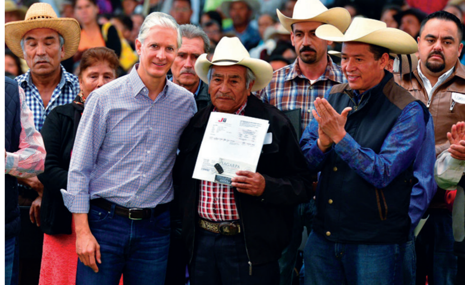
El Gobierno Federal puso en marcha solo cinco programas sociales para atender las necesidades agrícolas y ganaderas en el país.

Con respecto a la inversión pública en el campo, advirtió que el Edomex destina dos mil 400 millones de pesos (mdp) en materiales y capacitación para los labriegos, que deben cumplir con reglas de operación para acceder a estos programas. Al preguntarle sobre la falta de apoyo para 80 mil agricultores que demandan un subsidio del 50 por ciento en la compra de fertilizante, el funcionario estatal insistió en que deben acercarse a las 11 delegaciones regionales y cumplir con las reglas de operación.