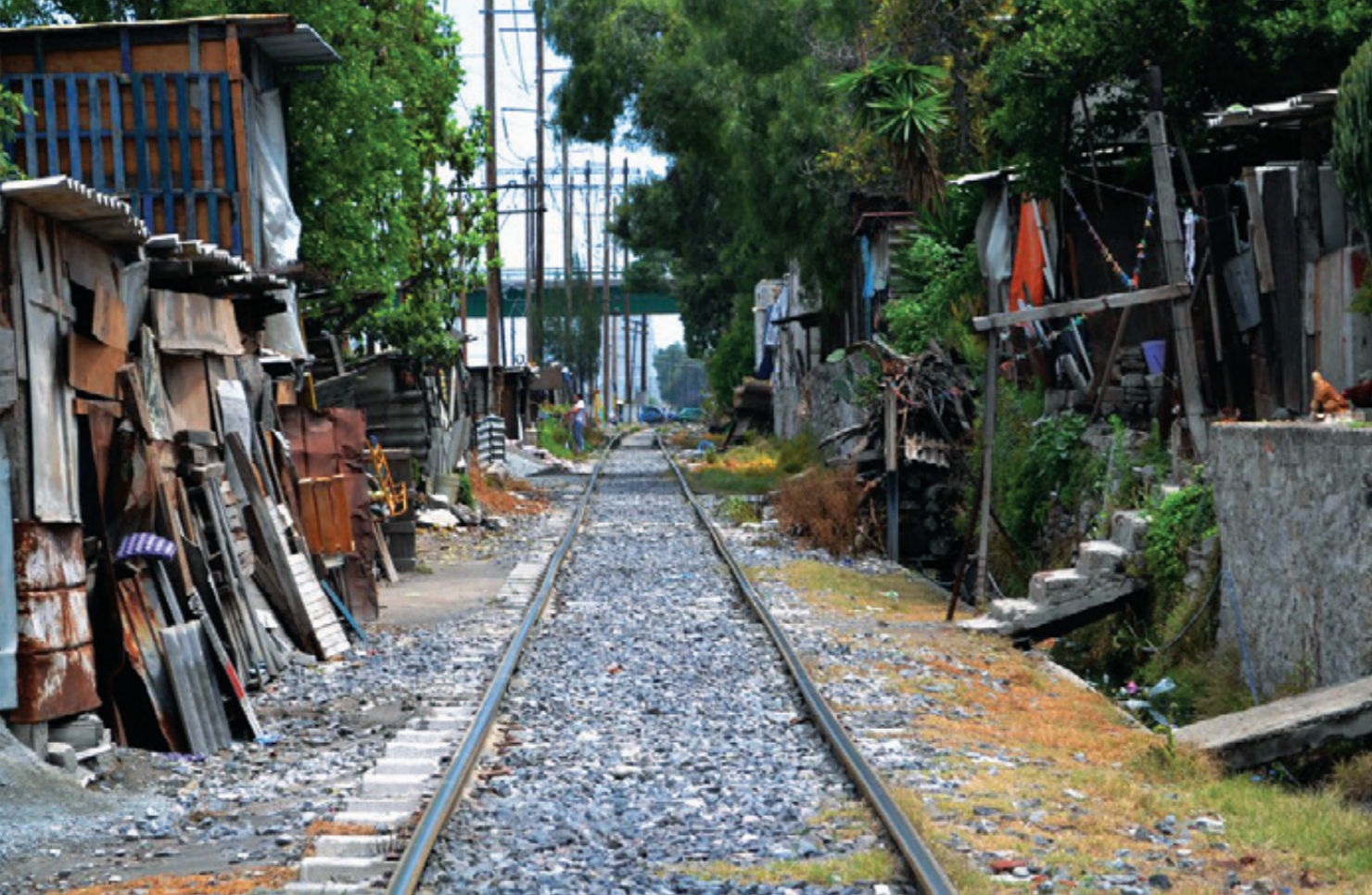
“En los países de ingresos medianos-altos y altos (Brasil, México y EE. UU., la inseguridad alimentaria aumenta la probabilidad de padecer sobrepeso u obesidad”: FAO.