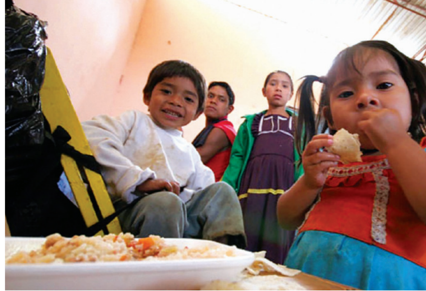
En Latinoamérica, 42.5 millones de personas viven sin alimentarse bien para realizar sus actividades, de los cuales, uno de cada 10 es mexicano.

Aseguran que la depreciación del peso encarecerá el costo de los insumos, como el fertilizante o la renta de maquinarias: “importamos la mayoría de los fertilizantes y es mayor el número de agricultores que requieren este tipo de insumos que no están dentro del programa de la Secretaría de Agricultura y Desarrollo Rural (Sader). Estimamos