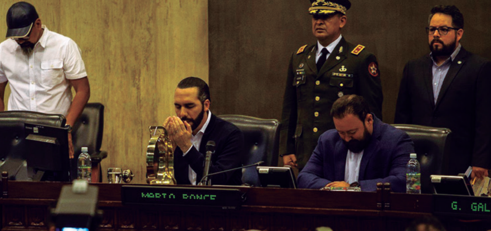
Ante una Asamblea sin quórum, pues solo había 20 de los 84 diputados, Bukele ordenó a las decenas de fuerzas del orden tomar posiciones rifle en mano.

Y mientras que, en las calles aledañas, miles de personas voceaban a coro “¡Insurrección, insurrección, insurrección!”, el presidente salvadoreño penetró en el Congreso escoltado por militares armados con rifles de asalto y agentes de la Policía Nacional Civil (PNC).