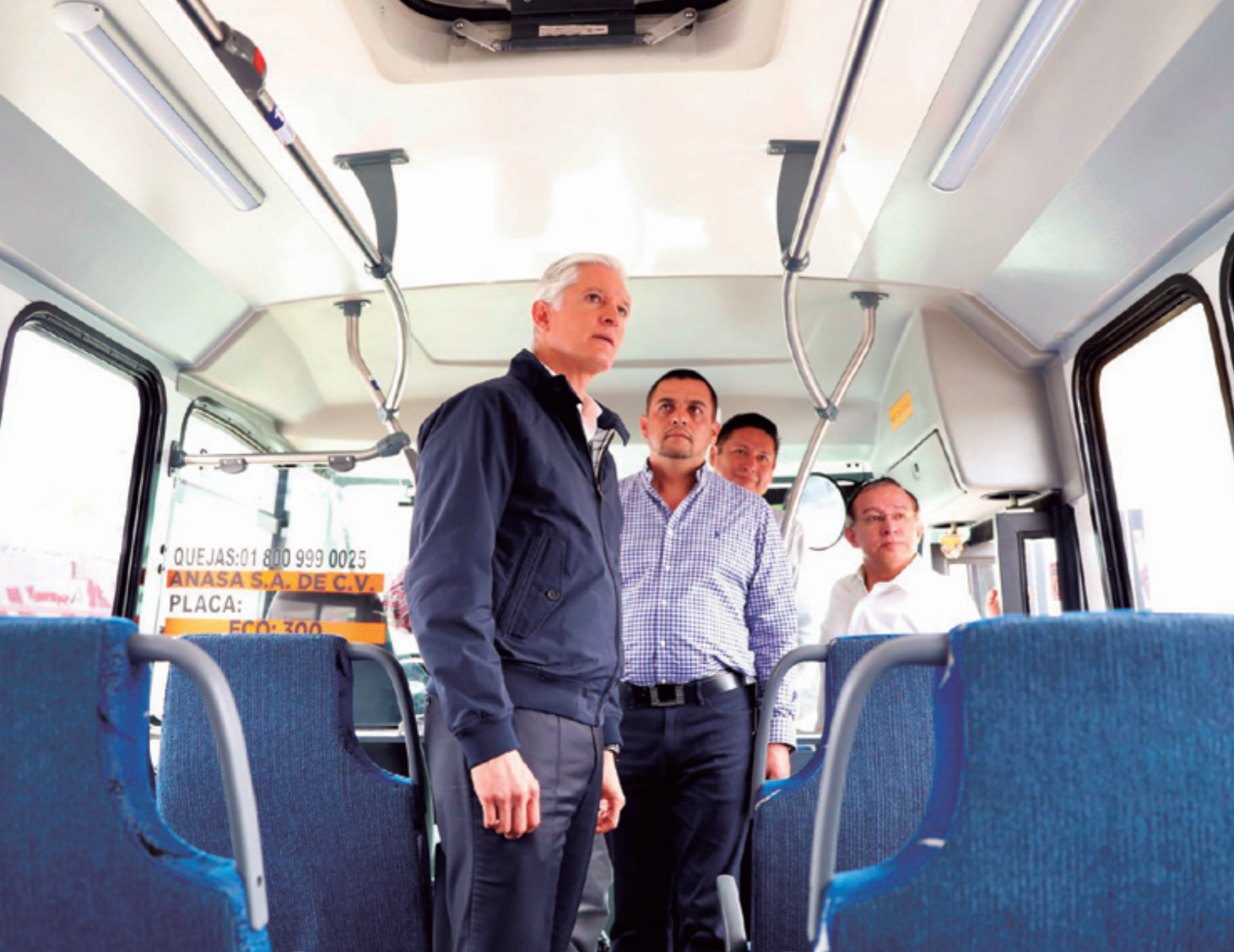
El principal reclamo al gobernador Alfredo del Mazo Maza es que “el tarifazo es ilegal... que el ajuste a la tarifa la pidieron solo 17 concesionarios, de los más de dos mil que prestan el servicio en la entidad mexiquense”.