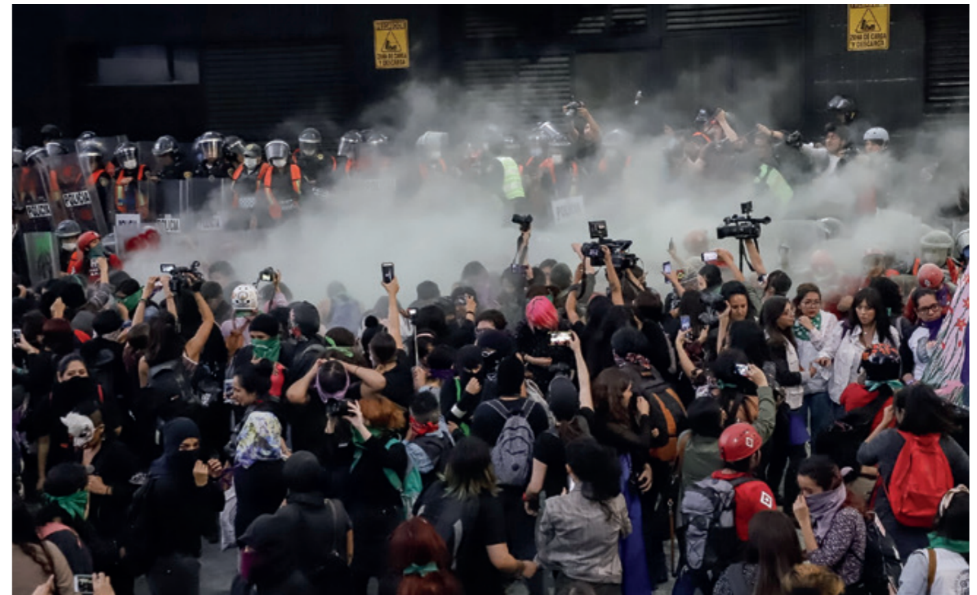
En la Ciudad de México no importa quiénes sean los manifestantes, todos reciben el mismo trato de la autoridades: represión y violencia. La foto de arriba muestra las recientes marchas feministas que fueron repelidas por las autoridades; la imagen de abajo muestra el enfrentamiento en el Aeropuerto Internacional de la Ciudad México entre policías y los padres de los niños que han dejado de recibir medicamentos.

Ante las acusaciones, Sheinbaum pidió pruebas. Las feministas contestaron con una ola de videos y fotos de las agresiones, que fueron publicadas en varias cuentas de Twitter y Facebook . Las mujeres policías tuvieron que abandonar el cerco formado frente a las manifestantes para lavarse el rostro con agua; pues también fueron víctimas del químico verde rociado durante la movilización. b