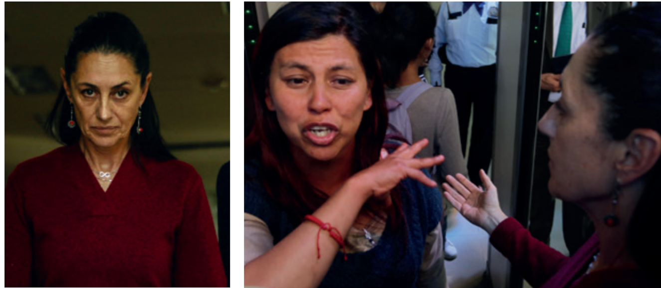
En su discurso, Claudia Sheinbaum se comprometió a atender los problemas de seguridad y a no reprimir a la población. En los hechos, como el reciente caso del feminicidio de Fátima, las autoridades capitalinas han culpado a la escuela y a los padres, acusándolos de "violencia familiar" y "demencia senil".