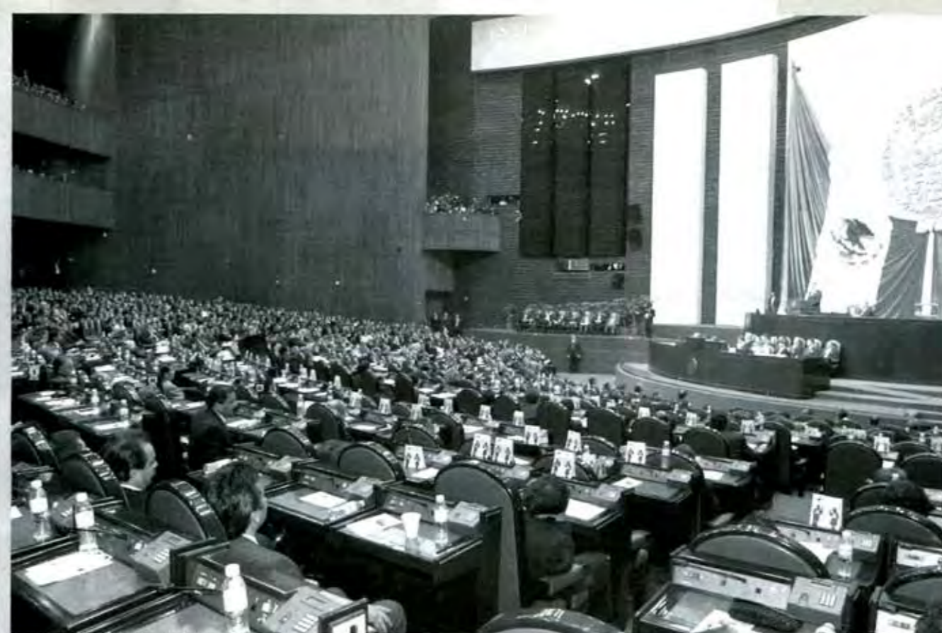
La construcción de consensos y los intereses de grupo.

En las calles la gente se refiere a ellos como “tranzas, flojos y corruptos”, pero en los círculos políticos, académicos y empresariales, son considerados como la posible “bisagra entre el pasado y el futuro”; incluso los miran como los próximos protagonistas de la vida política del país durante los próximos tres años. Se trata de ellos, los Diputados y Senadores que el pasado 1 de septiembre dieron vida a la LIX Legislatura, aquella que tendrá ante sí el reto de redefinir el papel del Poder Legislativo en la vida política y económica de México.