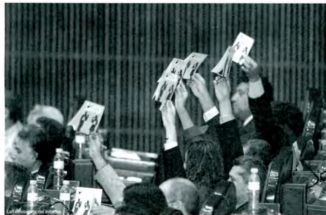
Las omisiones del informe

Por estas escuetas razones se prefiere el discurso y no el informe. Porque, además, permite ocultar el verdadero rumbo que lleva nuestro país, permite ocultar la maquinaria económica nacional e internacional diseñada y dispuesta para empobrecer a nuestro país y permite, finalmente, ocultar también a sus operadores: al gobierno y a su líder, al Presidente. ■