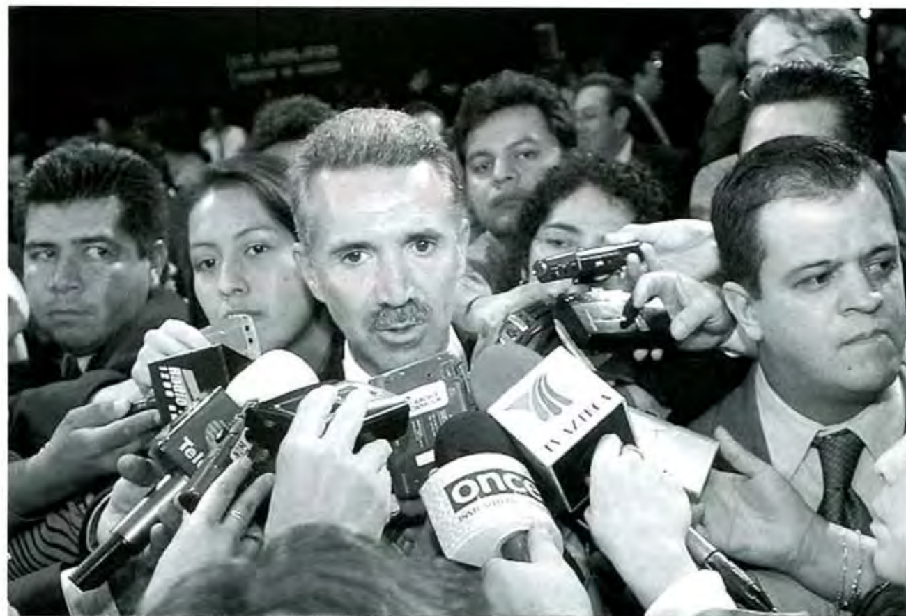
Para muchos, Roberto Madrazo es una figura ornamental en la dinámica parlamentaria.

Francisco Barrio, de Acción Nacional, conoce las cifras