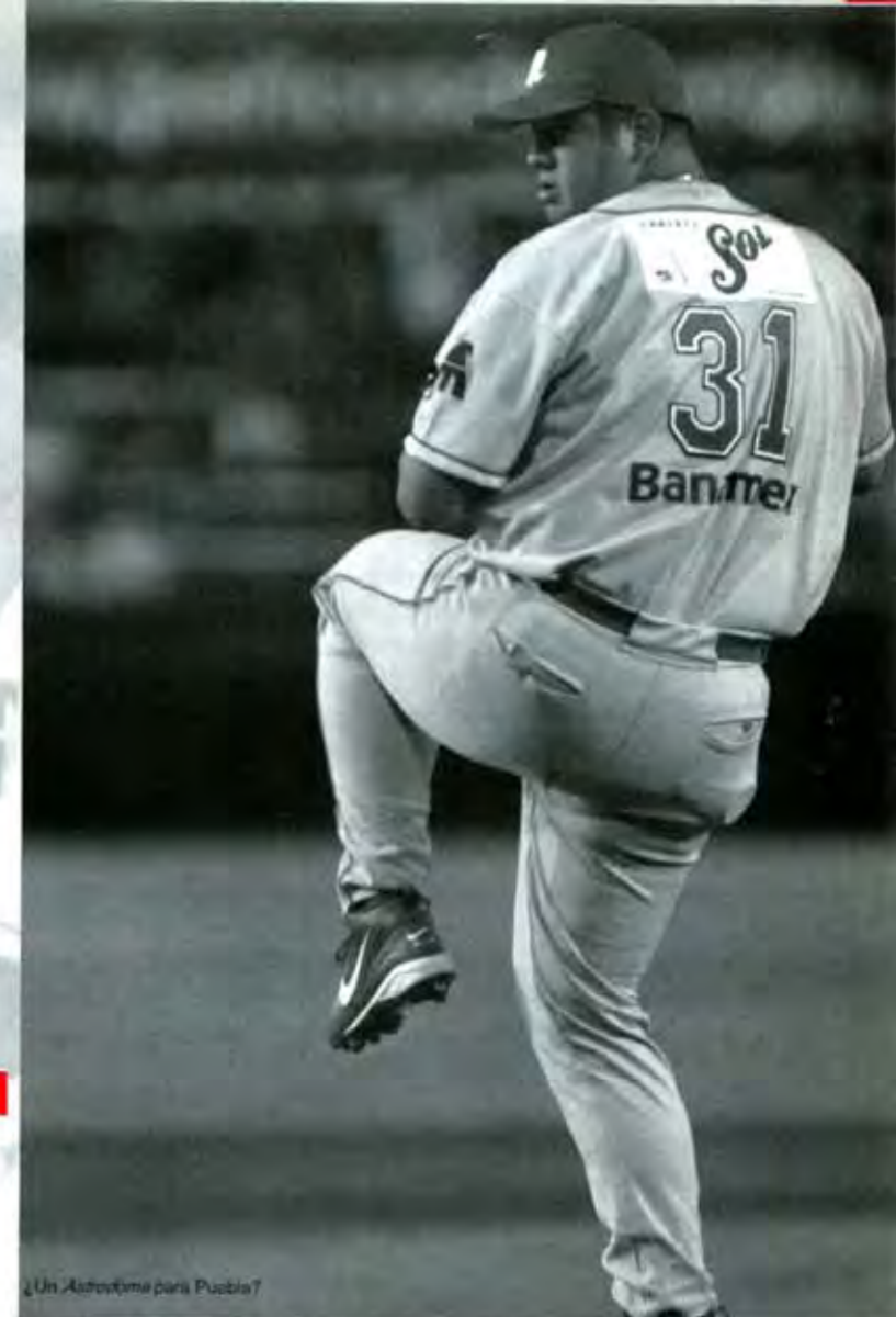
¿Un Astrotel para Puebla?

afición que exhibió un letrero que los destapaba como gobernador- es crear un espacio profesional único en su tipo. La consolidación del Domo de Maravillas será un hito en la historia deportiva poblana, acostumbrada a la mediocridad y el engaño, (piense en el velódromo de angelópolis) y significaría sumar a la Ciudad de Puebla en la lista de metrópolis con instalaciones de primer mundo. Digo, eso es más realista que suponer que Puebla está para trenes metropolitanos, por ejemplo. Y no comparo más por que al rato me dicen que no estoy con el cambio. (Por cierto, lo reto a que cite tres logros en materia deportiva de parte de la autoridad municipal de la capital poblana. Y conste que no estoy hablando del número de balones que regala la Promotora del Deporte).■