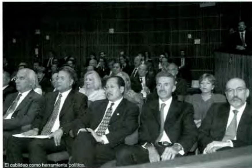
El cabileo como herramienta política.