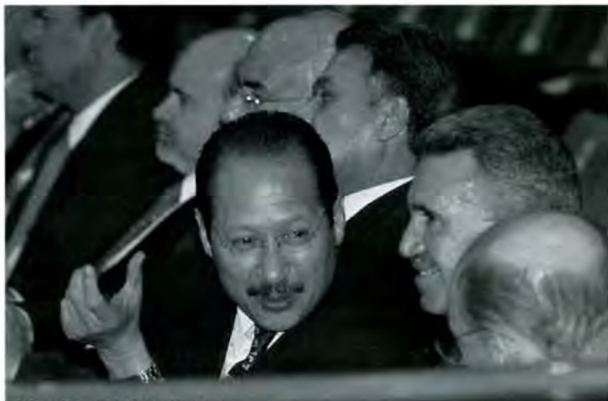
El PRD y la búsqueda de una postura crítica.

* Circunscripción plurinomial: Son cinco circunscripciones que conforman la República Mexicana agrupadas por Estados que funcionan como una sola región para efectos electorales.