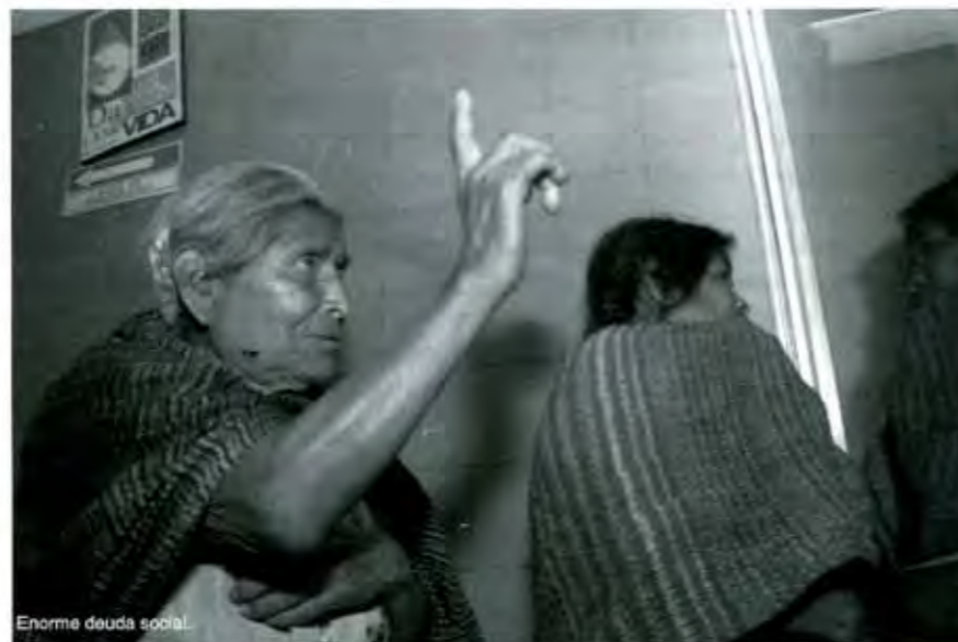
Enorme deuda social.