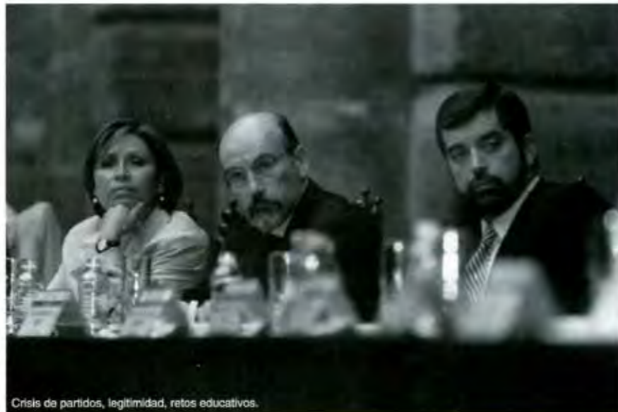
Crisis de partidos, legitimidad, retos educativos.

11 minutos después llega a San Lázaro. Relajado. "se acabaron los regímenes autoritarios", pese al dispositivo que impidió que diversos contingentes de manifestantes se apostaran en las inmediaciones del recinto. He aquí el poder real del Congreso. Baja solo de su micro y es recibido y acompañado por diputados, "se llama comisión de protocolo" explica una deslumbrante Adela Micha. Unos segundos de caos en la transmisión. 1000 periodistas apostados para dar seguimiento puntual a los gestos, para interpretar los discursos, para leer entrelíneas. Llega a la sala de sesiones con los aplausos de Martha y de algunos priístas aplauden. Asciende y saluda con frialdad a Enrique Jackson. Juan de Dios Castro, ese viejo panista que apenas ayer era director de asuntos jurídicos de la Presidencia se conduce con decoro parlamentario antes del Himno. Vicente Fox: bolsas en los ojos, silencio sepulcral. Apenas comienza y lo interpelan. Ahora sí, sonríe y sabe que lo más difícil ha quedado atrás. Tan seguro estuvo que al concluir el informe con un ¡Viva México! Estentóreo, a sus adversarios no les quedó más que corearlo y rubricar el acto con aplausos generosos. La tragicomedia de la política mexicana. ■