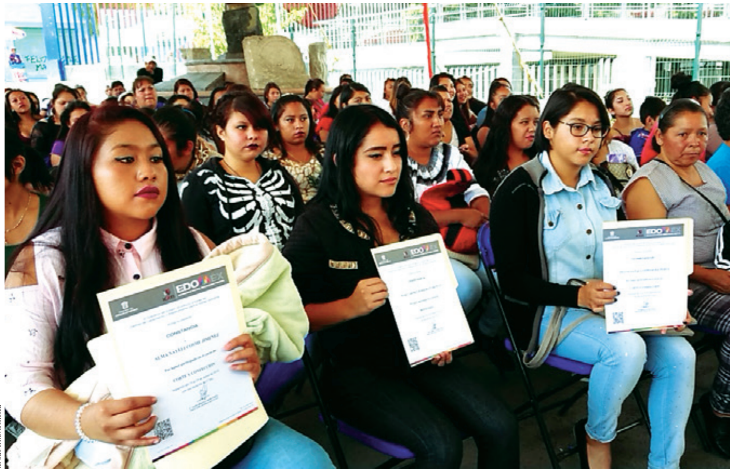
Certificación por curso de capacitación para el empleo, gestión del Consejo Municipal de la Mujer (arriba). Prevención del Delito Ixtapaluca es el nombre del programa del Gobierno Federal comprometido con la cultura de la prevención, erradicación de la violencia de género y el aprendizaje en la comunidad.