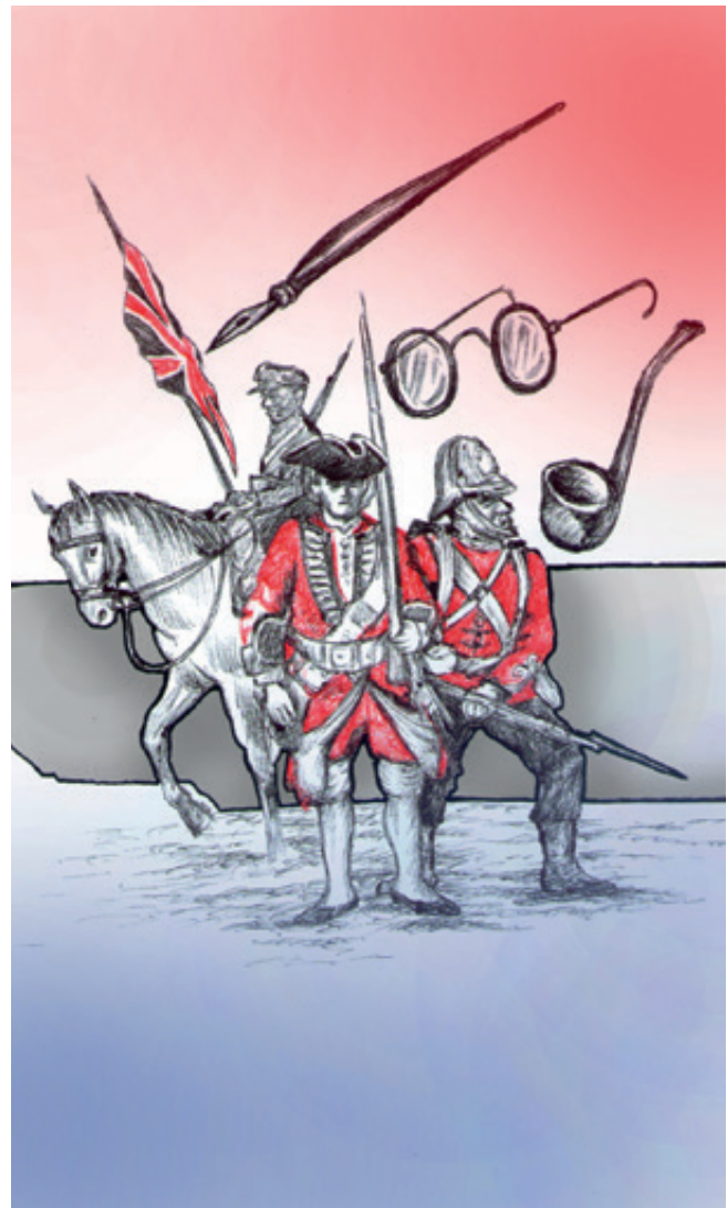
Ilustración: Carlos Mejía

La revuelta de los pueblos árabes (sirios, palestinos, libaneses, jordanos, sauditas, iraquíes, beduinos) fue promovida por los ingleses a cambio de su liberación con respecto a los turcos y la creación de una nación independiente con sede en Damasco. El levantamiento tendría la misión estratégica de distraer la atención y la fuerza del Imperio Otomano en Siria y Palestina, mediante levantamientos y ataques armados en la región sur de la Península Arábiga. Fue en este contexto histórico en el que surgió la leyenda de Lawrence de Arabia