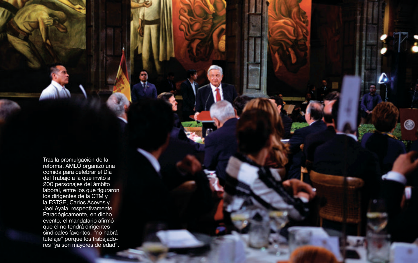
Tras la promulgación de la reforma, AMLO organizó una comida para celebrar el Día del Trabajo a la que invitó a 200 personajes del ámbito laboral, entre los que figuraron los dirigentes de la CTM y la FSTSE, Carlos Aceves y Joel Ayala, respectivamente. Paradójicamente, en dicho evento, el mandatario afirmó que él no tendrá dirigentes sindicales favoritos, “no habrá tutelaje” porque los trabajadores “ya son mayores de edad”.

➤ confederación. Fundó la Confederación Autónoma de Trabajadores y Empleados de México (CATEM), con la que ha aspirado a aglutinar más sindicatos.