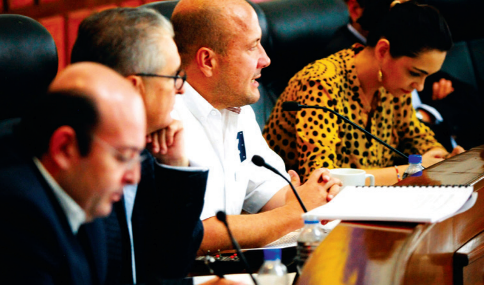
Peña Cortés aclaró que piensa recurrir a la instancia federal porque, tal como se han desarrollado los hechos, no tiene confianza en la administración estatal del gobernador Enrique Alfaro Ramírez.

➤ Precisó asimismo que la crisis financiera del Ipejal se ha dado pese a las reformas aprobadas a la Ley de Pensiones, la noche del 13 de noviembre de 2009, entre las que resaltan el incremento de la edad de jubilación a 65 años, con 30 años de servicio; el alza del cinco al 11.5 por ciento en las aportaciones laborales y la creación del salario tabular (sueldo base) en sustitución del salario integral (sueldo base, sobresueldo y prestaciones), con el que se calcula la pensión.