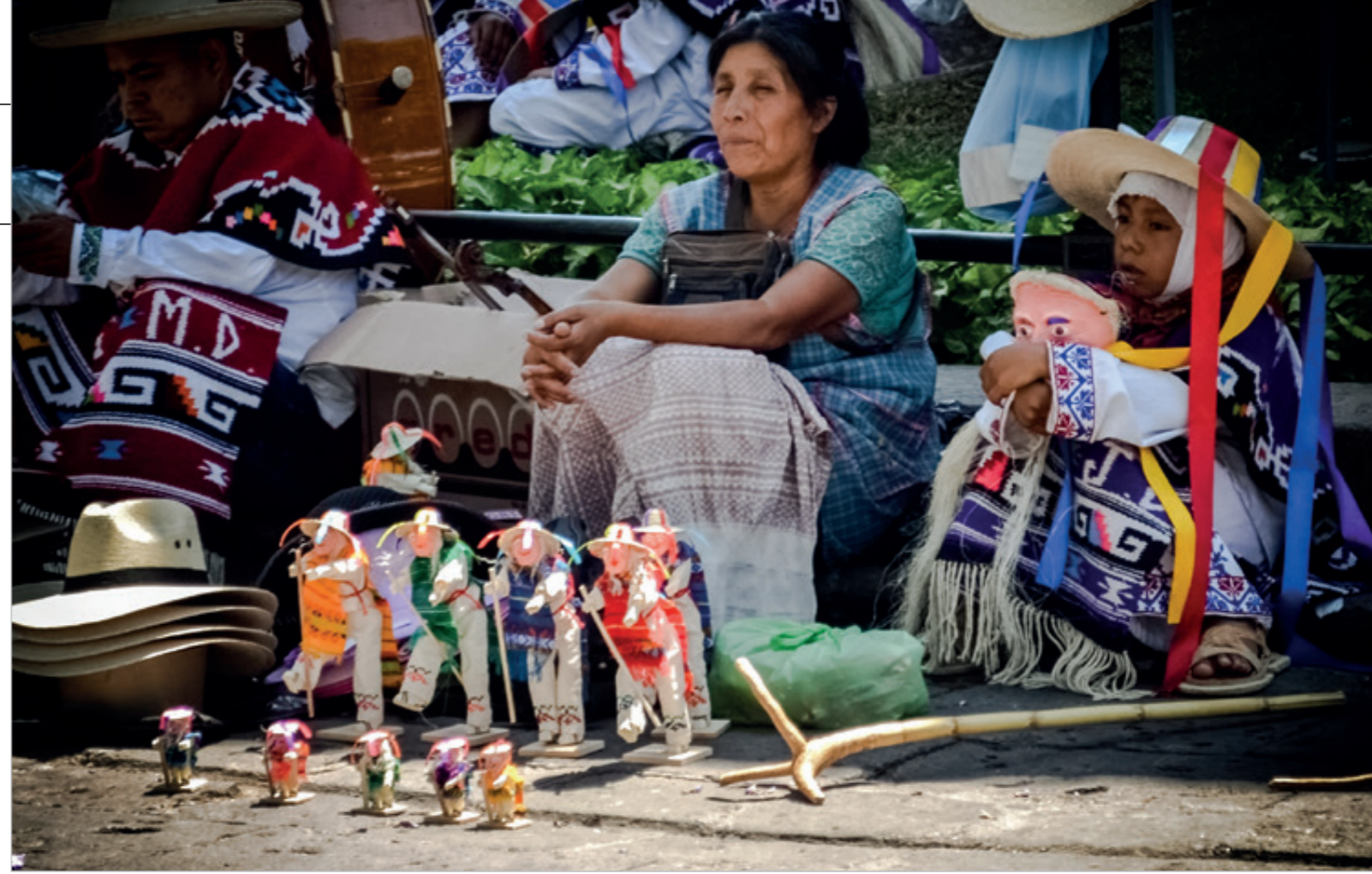
Cerca de tres mil personas se dedican al comercio informal en Morelia; esto hace de Michoacán la séptima entidad con mayor número de ambulantes.

En Morelia hay alrededor de tres mil personas que se dedican al comercio informal, quienes desde enero de este año han