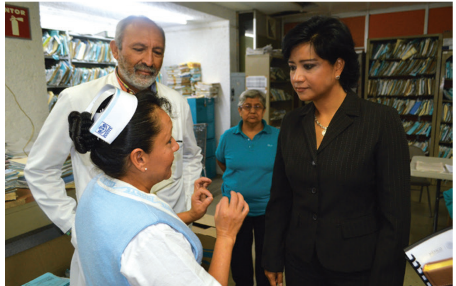
Trabajadores del Hospital Civil de Xalapa, entre ellos médicos y enfermeras, denunciaron públicamente el desabasto de insumos básicos, como jeringas y medicinas. “A nosotros nos llegan pacientes graves y desgraciadamente tenemos que improvisar, porque muchas veces no tenemos los materiales; tenemos una sala de choque que no tiene ni lo necesario para atender a pacientes graves”.

El pago de nómina representa el 22 por ciento de los adeudos, mientras que el de proveedores llega al 44 por ciento. Para el pago de los trabajadores del sector salud, la Federación debe entregar los recursos a través del Fondo de Aportaciones para los Servicios de Salud (FASSA).