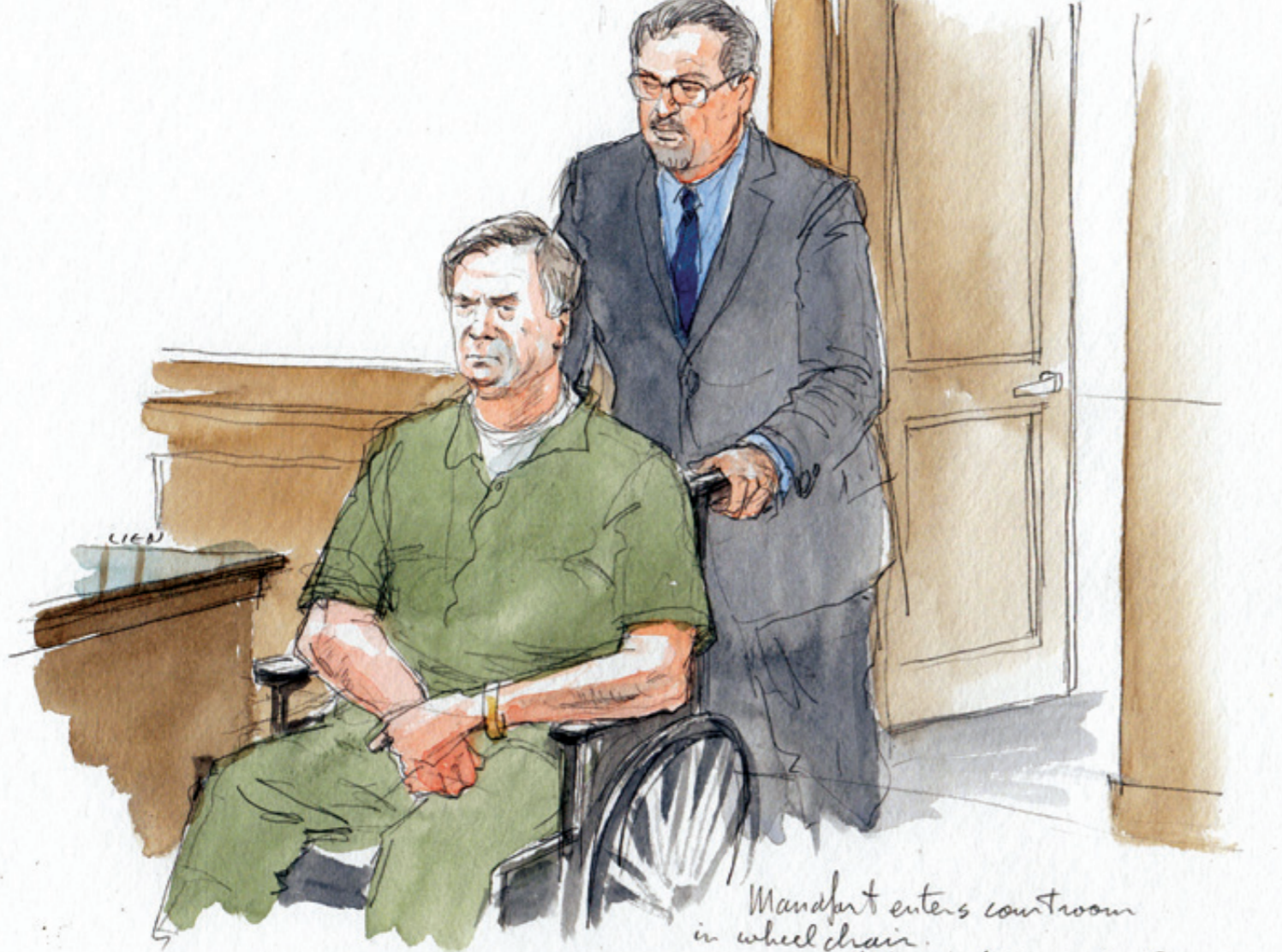
Paul Manafort, compareció ante el tribunal en una silla de ruedas; su abogado dijo estar preocupado por su salud mientras permanezca recluido.

E l Russiagate no fue una trama inocente contra el magnate que preside EE. UU. Se trató del desvergonzado intento de las élites político-corporativas de mentir y manipular a sus conciudadanos con base en inventar un enemigo. En este juego, que ya dura dos años, las fuerzas neoconservadoras tienen un doble objetivo: al desacreditar a Trump han pretendido eliminar a Moscú, un adversario que se reposiciona en el tablero global.