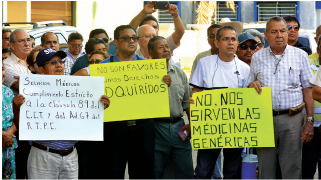
El 25 de febrero en Poza Rica, jubilados de Pemex se manifestaron a las afueras del hospital regional por el desabasto de medicamentos.