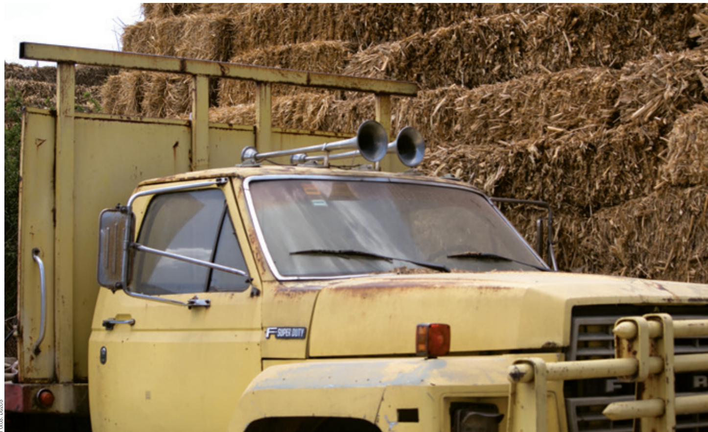
Los productores del campo u otros grupos organizados que quieran disponer de los apoyos del programa Pesa se someten a trámites complejos que dificultan su acceso; aunado a la información incompleta de este programa en zonas rurales.