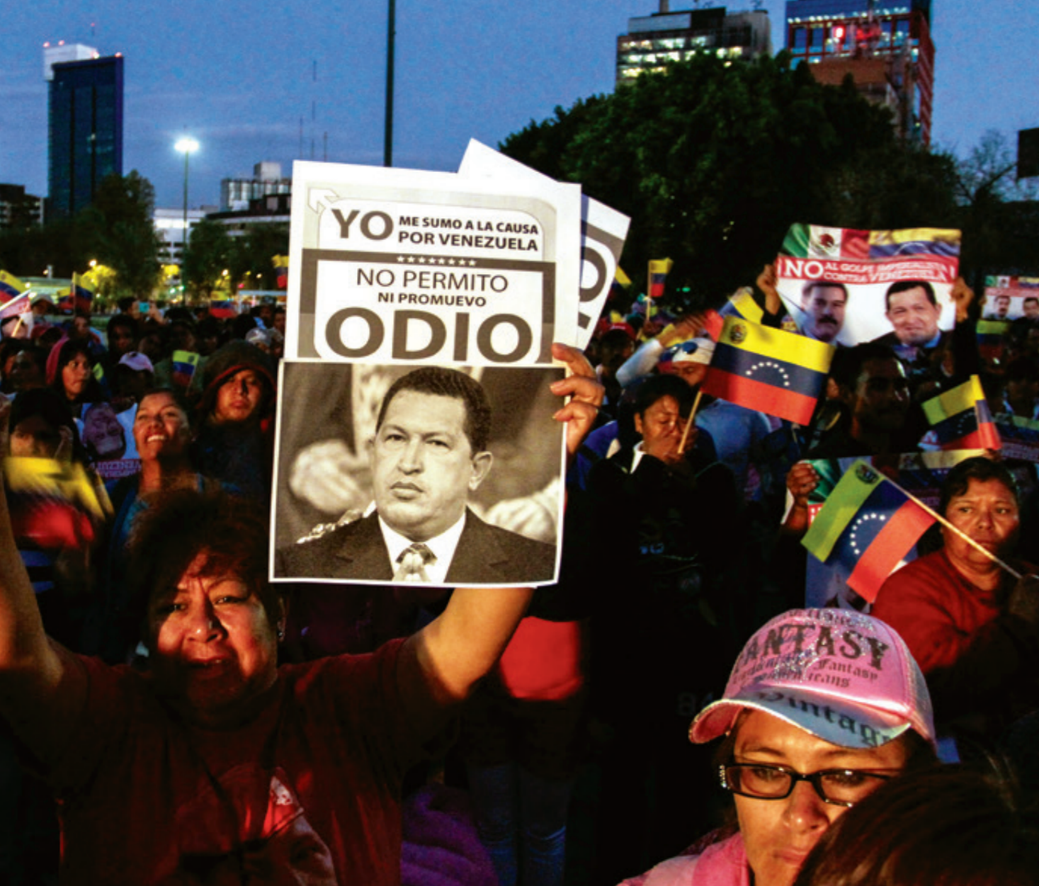
Cientos de personas se congregaron en el Monumento a la Madre para conmemorar el aniversario luctuoso del expresidente venezolano Hugo Chávez.