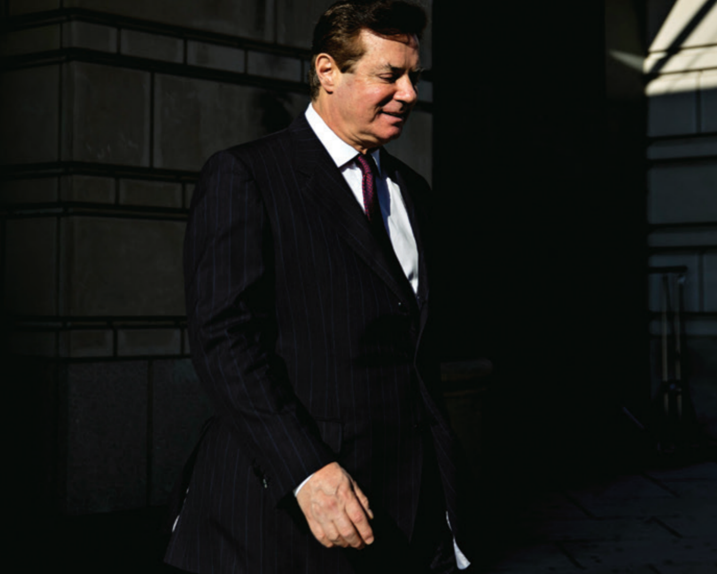
Un juez federal sentenció a Paul Manafort, exjefe de campaña de Donald Trump, a 47 meses de prisión.

➤ Cohen, Michael Flynn y Roger Stone. Hay otros 26 que son rusos y que si bien no serán procesados en EE. UU., son arbitrariamente asociados a un acto de traición.