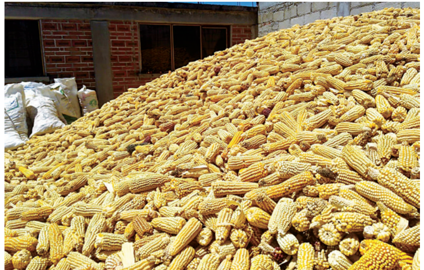
“El gobierno está olvidando a los campesinos; aquí nosotros nos sentimos abandonados, tiene que voltear a ver el campo”.

Y agregó: “El gobierno del Estado de México debe cumplir su promesa de entregarle fertilizante subsidiado al 50 por ciento a 100 mil campesinos; ya se está pasando la temporada para aplicarlo y este desfase implica una pérdida en la producción de autoconsumo, e incluso eleva el riesgo de que se desate la hambruna entre los campesinos”.