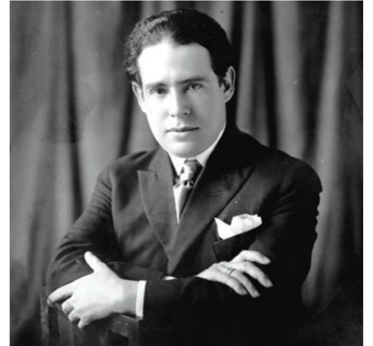
JOSÉ JUAN TABLADA. Poeta, periodista y diplomático. Nació en la Ciudad de México el tres de abril de 1871. Falleció en Nueva York, Estados Unidos, el dos de agosto de 1945. Cursó estudios en escuelas particulares y en el Colegio Militar, incursionando en el campo poético desde muy joven. Colaboró en El Universal , El Imparcial , El Mundo Ilustrado , Revista de Revistas , Excélsior y El Maestro . A los diecinueve años viajó a Japón y posteriormente a París, países que influyeron notablemente en la calidad de su poesía. Además de poeta fue cronista y crítico. Fue miembro de la Academia Mexicana de la Lengua y ocupó varios cargos diplomáticos en Venezuela, Colombia y Estados Unidos. Forman parte de su importante obra: Florilegio (1898), Al sol y bajo la luna (1918), Un día (1919), Poemas sintéticos (1919), Li-Po y otros poemas (1920), Retablo a la memoria de Manuel López Velarde (1921), El jarro de flores (1922), La Feria (1928). Enrique González Martínez realiza una Antología general de sus poemas que publica en 1920. b

Y —símbolo de estéril vida, de inútil ilusión fallida— mueven en vano el ala trunca, ¡el ala inválida y herida que ya no habrá de volar nunca!