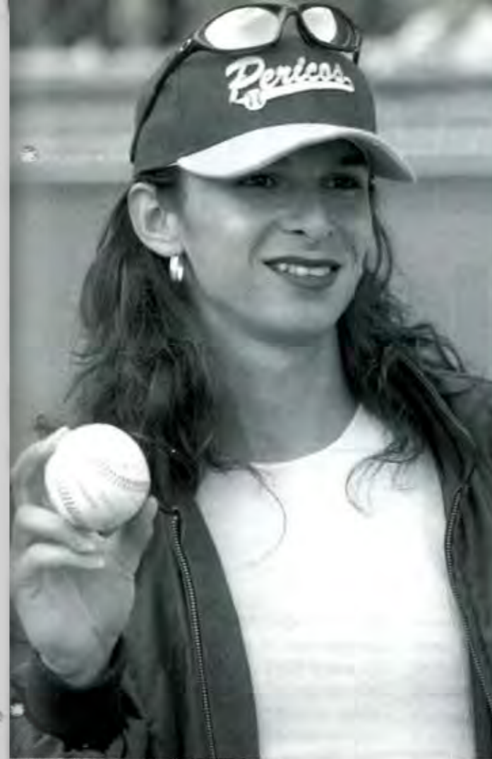
Ojalá Ana Gabriela pudiera promoverlo todos los días...

*De manera deliberada hemos omitido la mención de los canales 11, 22 y 41, que transmiten por televisión abierta en el Distrito Federal y en algunos sistemas de cable en el interior. Aún así, en el D.F la audiencia sigue con más atención los culebrones de Adela Noriega y las piernas de Galilea Montijo que la acuciosa entrevista de Sergio Sarmiento.■