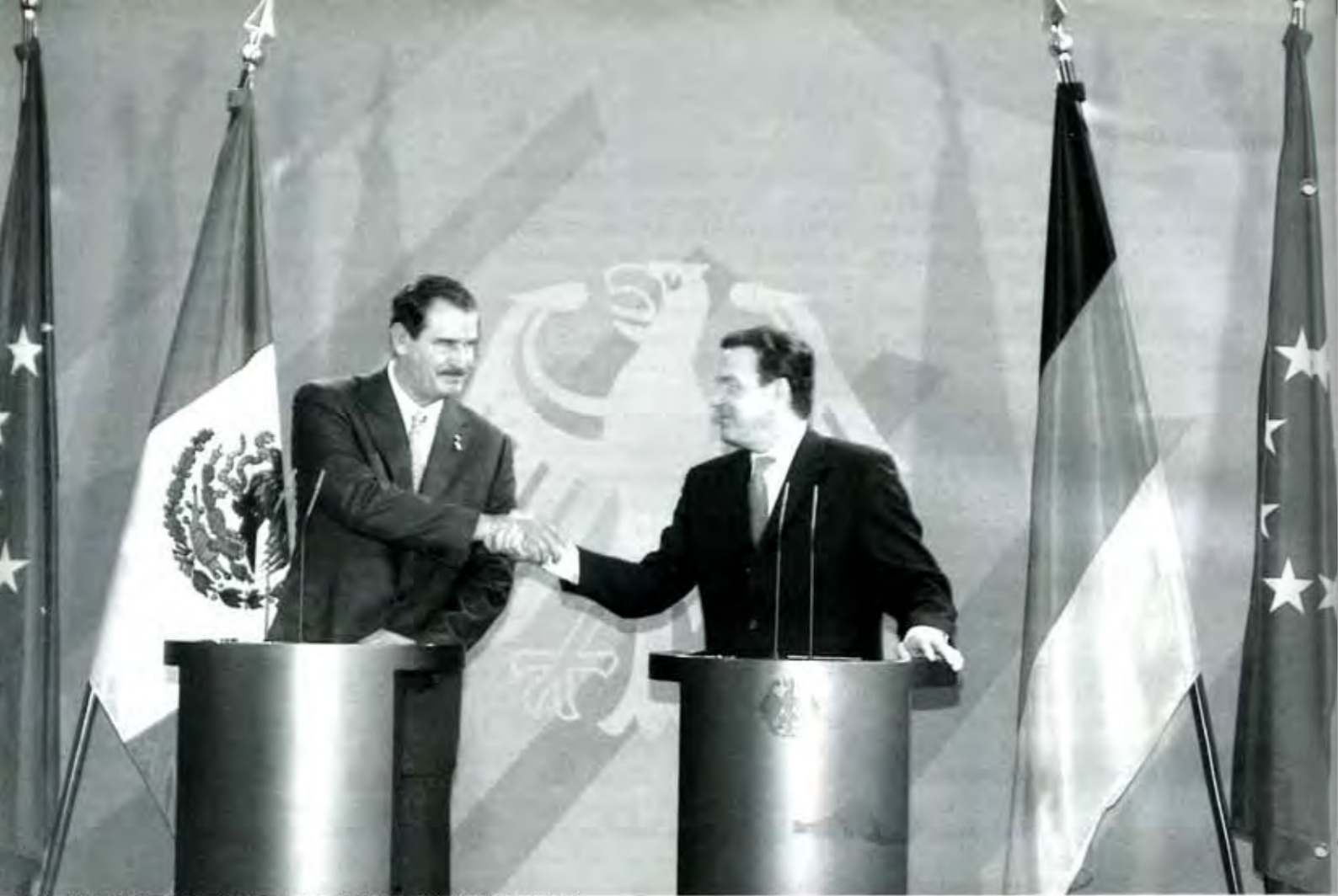
El canciller Gerhard Schröder, de Alemania, justifica en su país la política empresarial exterior.