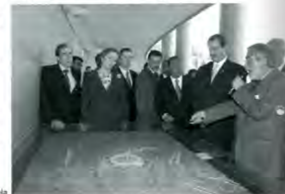
Ciudad Judicial: pasarela