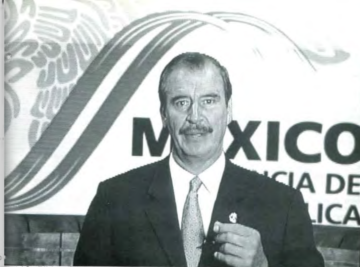
Respuesta de Fox a Woldenberg, por Televisión.