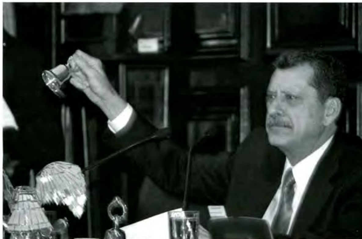
Jackson: conocimiento de causa desde que presidia el PRI defensor.