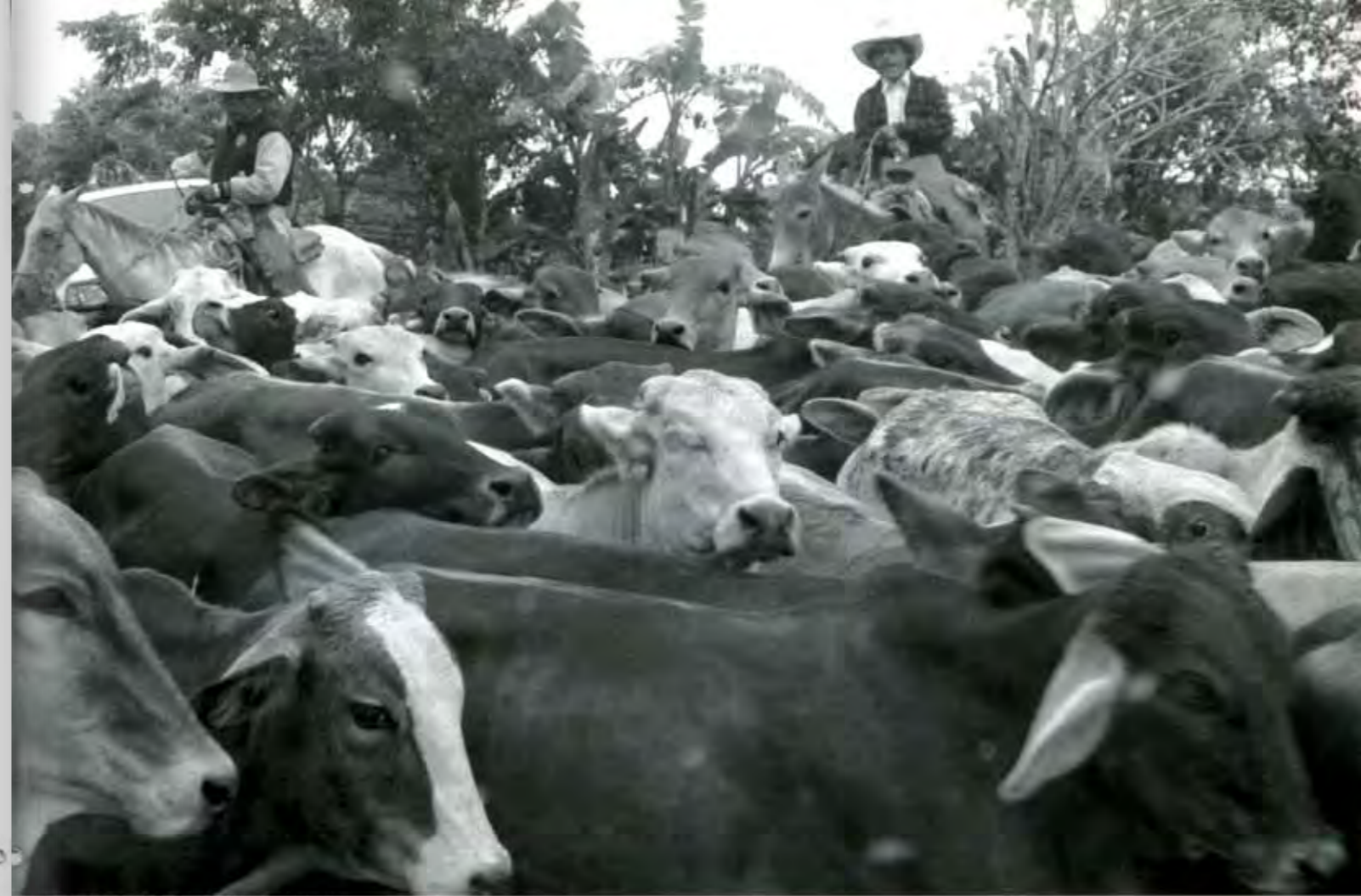
Mientras tanto, sigue detenido el desarrollo del sector.