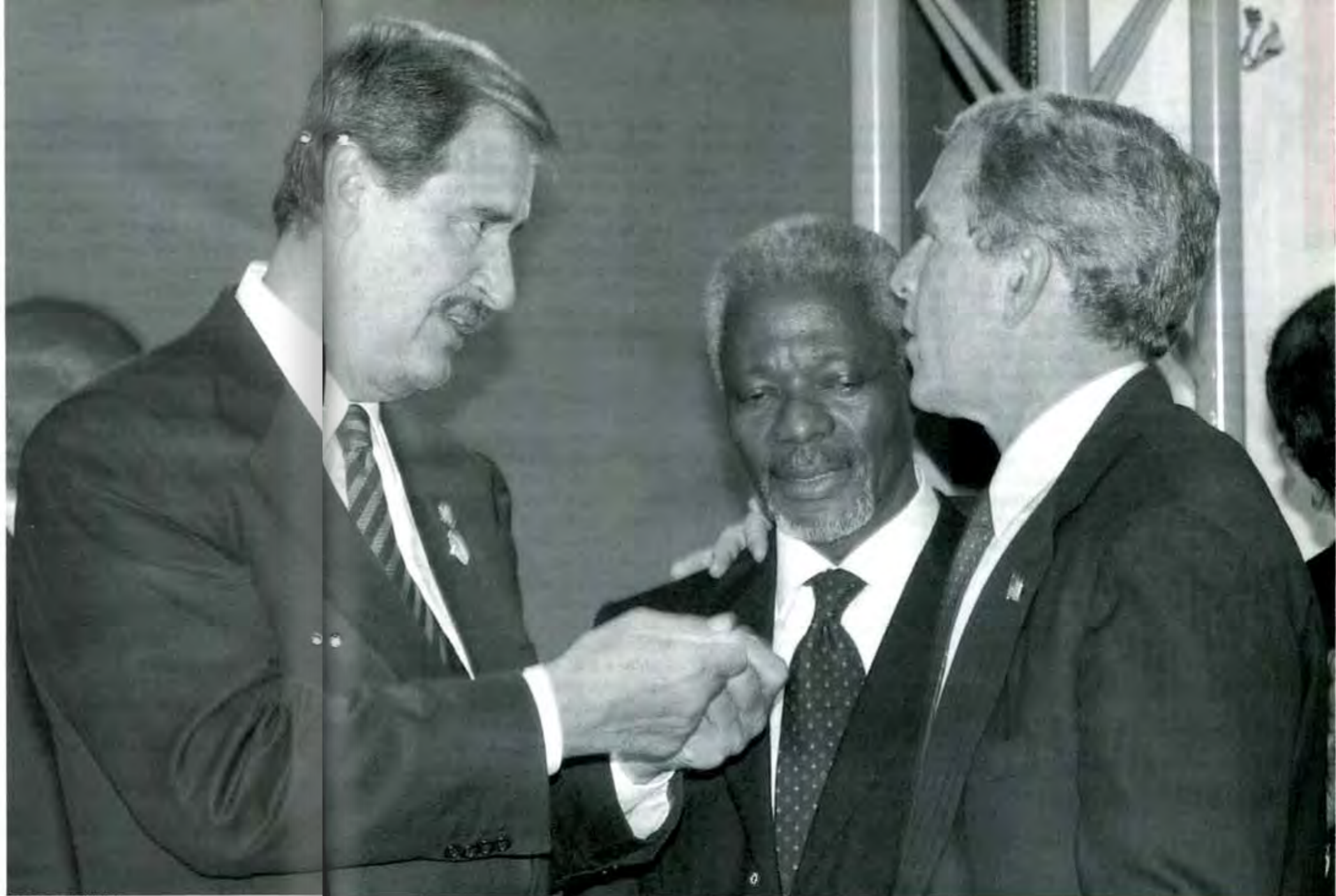
Las razones de Mr. Bush

sobre los medios masivos de comunicación de todo el mundo, se ha filtrado ya a la opinión pública que lo del material listo para fabricar bombas atómicas fue un invento total, una burda mentira para engañar a la opinión pública de Estados Unidos, Inglaterra y el resto del planeta, destinada a ganar apoyo y simpatía para la brutal agresión que se tenía ya decidida y preparada con varios meses de antelación. Y una mentira del mismo calibre ha resultado la famosa capacidad de respuesta en menos de 45 minutos.