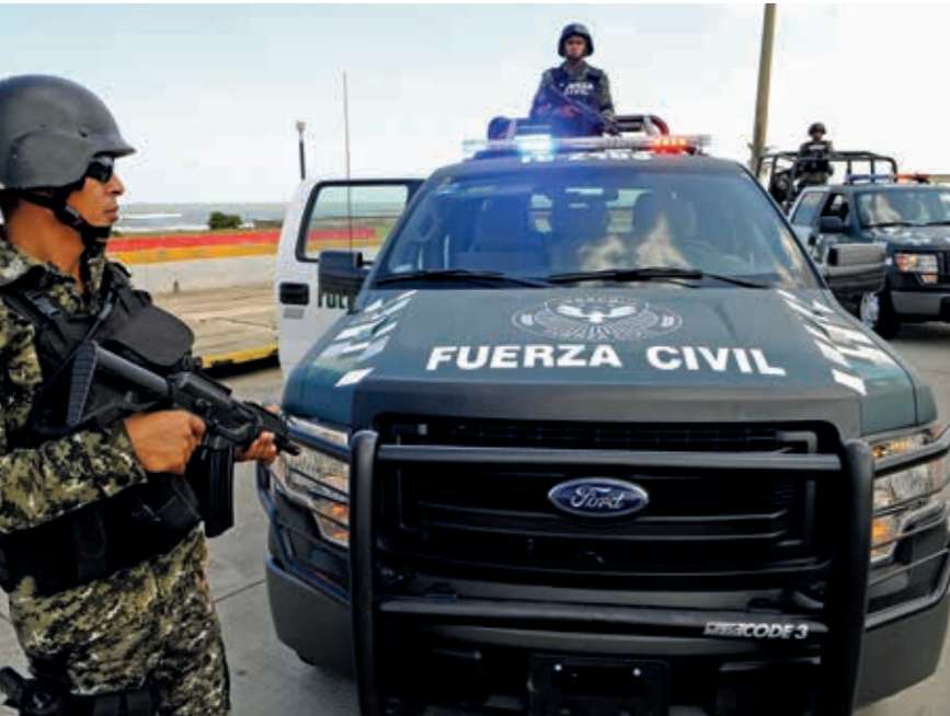
Los abusos policiales y el incremento de la inseguridad son los resultados del nuevo gabinete morenista en Veracruz.