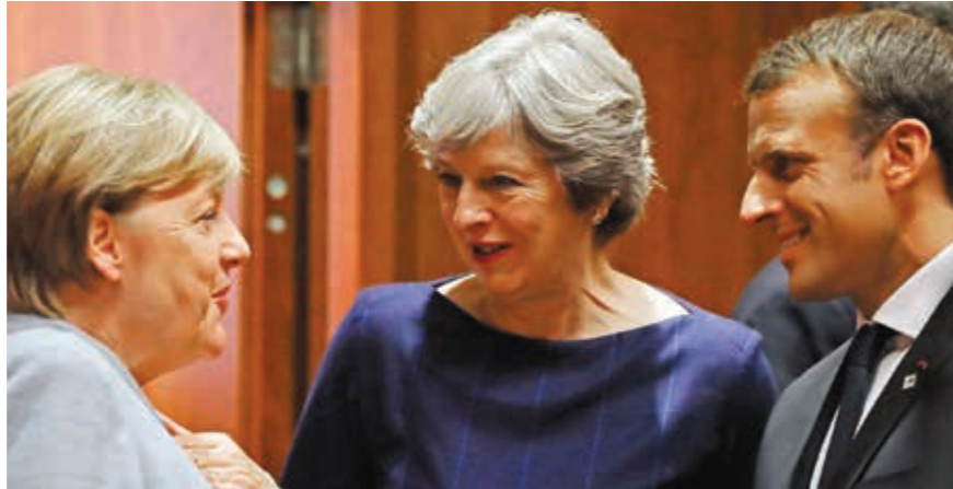
Ángela Merkel y Emmanuel Macron creen que el Brexit es una coyuntura de realineamiento político.

El primer vicepresidente de la Comisión Europea, Frans Timmermans, cuestionó: “¿Qué tipo de Brexit tendremos? No podemos volver atrás y cambiar el inicio, pero podemos empezar donde estamos y cambiar el final”.