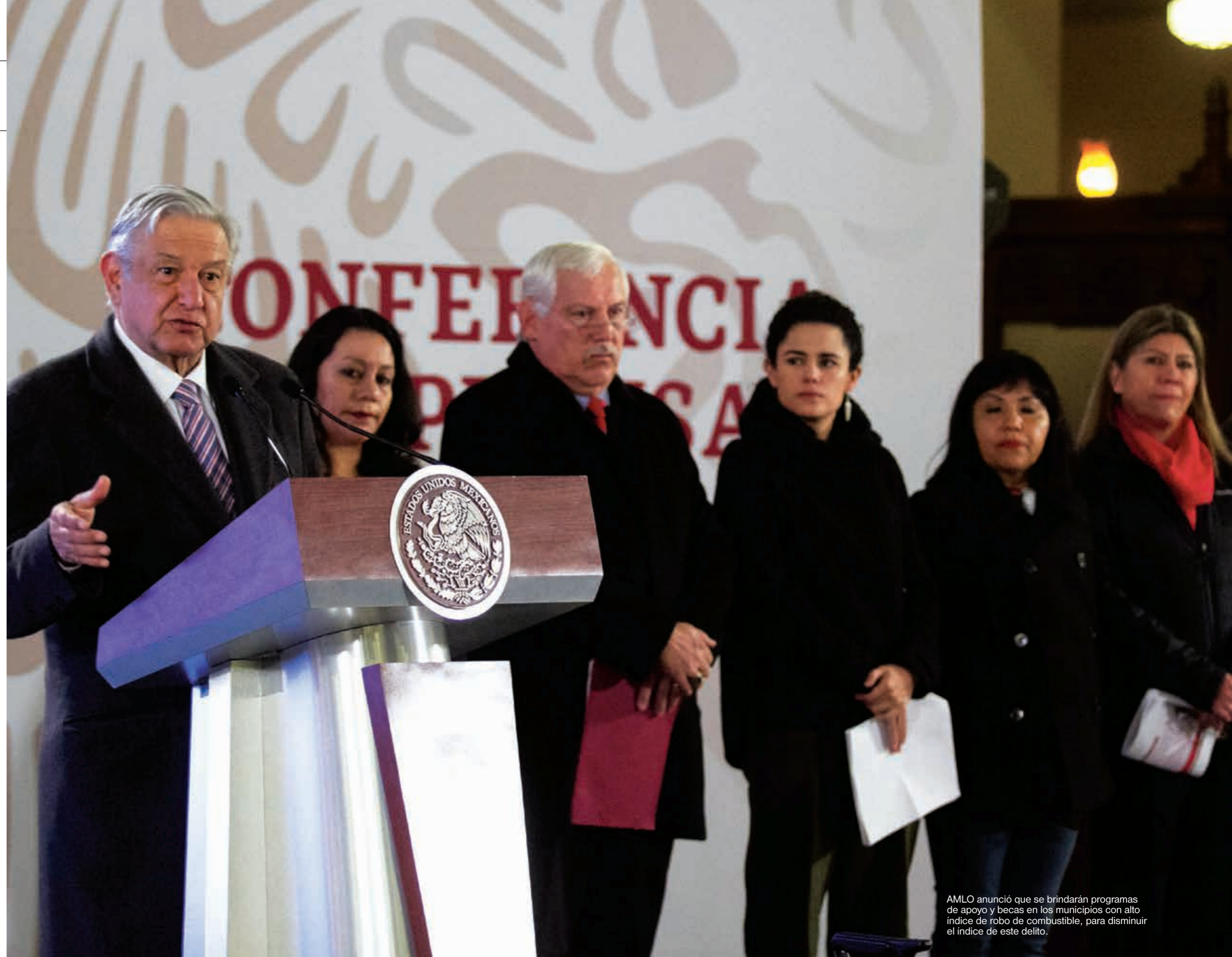
AMLO anunció que se brindarán programas de apoyo y becas en los municipios con alto índice de robo de combustible, para disminuir el índice de este delito.

En su discurso de asunción a la Presidencia de México, AMLO aseveró: “Gobernaremos para todos, pero daremos preferencia a los desposeídos: por el bien de todos, primero los pobres”, pero en ningún momento ha declarado la intención de gravar con más impuestos a quienes más tienen y más ganan. b