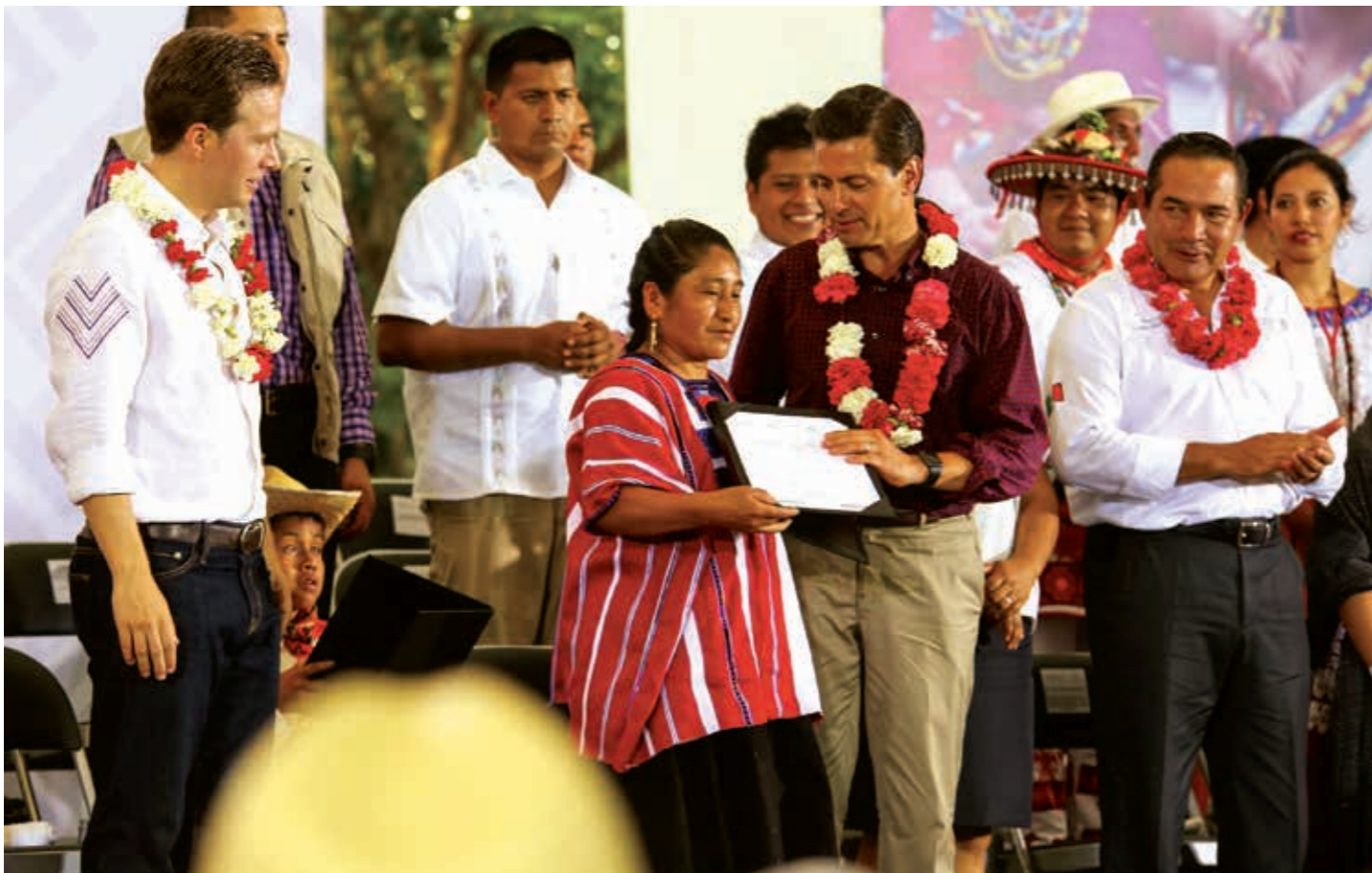
El expresidente de México, Enrique Peña Nieto, destacó los beneficios de su política asistencialista durante la entrega de apoyos del programa Oportunidades en el estado de Chiapas.

información de primera fuente para poder hacer la planeación nacional, que es muy importante”.