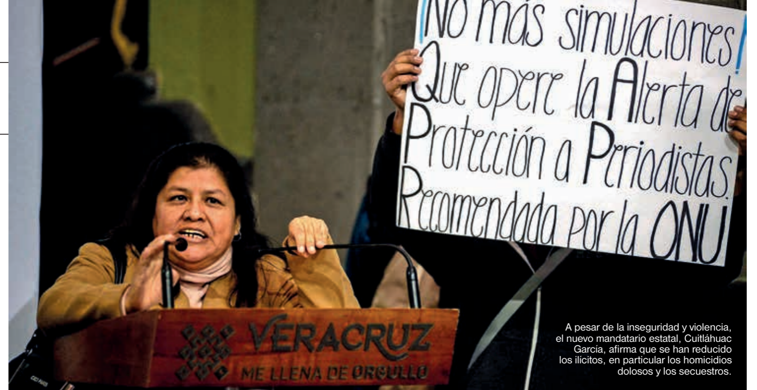
A pesar de la inseguridad y violencia, el nuevo mandatario estatal, Cuitláhuac García, afirma que se han reducido los ilícitos, en particular los homicidios dolosos y los secuestros.

Por su parte, el Secretariado Ejecutivo del Sistema Nacional de Seguridad Pública (SESNSS) reveló que en el primer mes de gobierno de Cuitláhuac García, desde diciembre de 2018, se registraron dos mil 755 delitos, de los cuales 69 fueron homicidios dolosos y 44 se concretaron con arma de fuego, 396 fueron lesiones dolosas, dos feminicidios, siete secuestros y mil 294 robos de diversa índole.