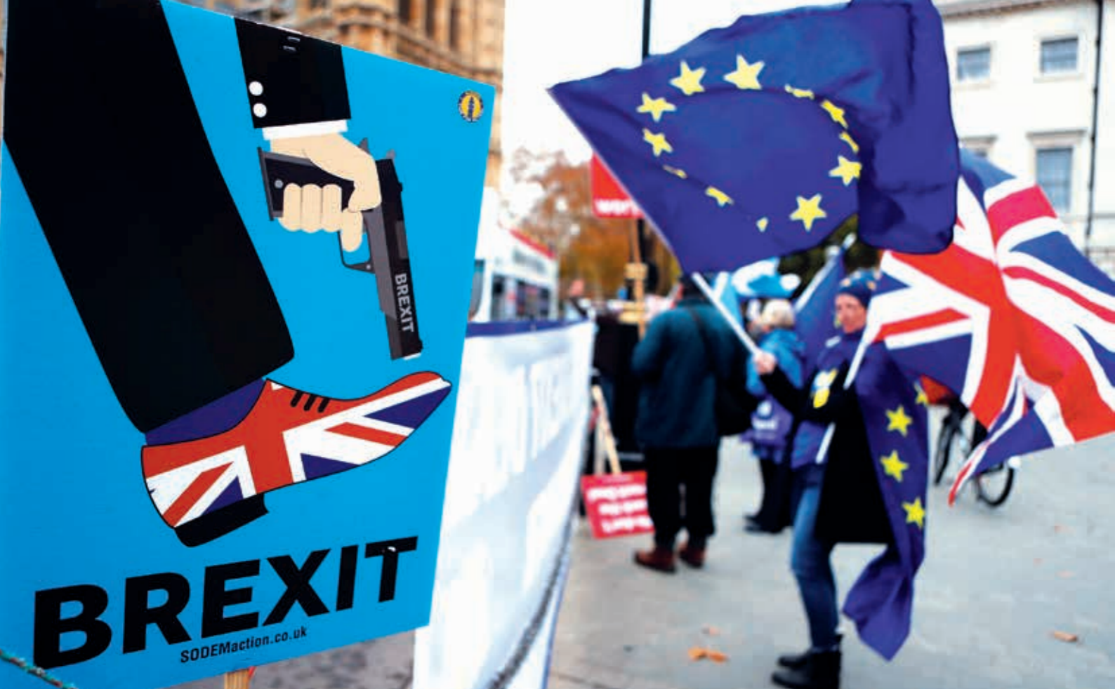
El Brexit confirma el descalabro del proyecto neoliberal en que se ha sostenido la UE y exhibe la crisis del capitalismo neoliberal del Reino Unido.

G racias al Brexit, la Unión Europea (UE) y la Gran Bretaña viven una crisis existencial. Por un lado, el desesperado bloque comunitario busca contener el riesgo de fuga de otros miembros que desafíen su razón de ser: el control del mercado comunitario. Por el otro, es paradójico que el Reino Unido sea hoy un Estado con profundas divisiones y desigualdades, pese a ser la quinta economía más poderosa del planeta.