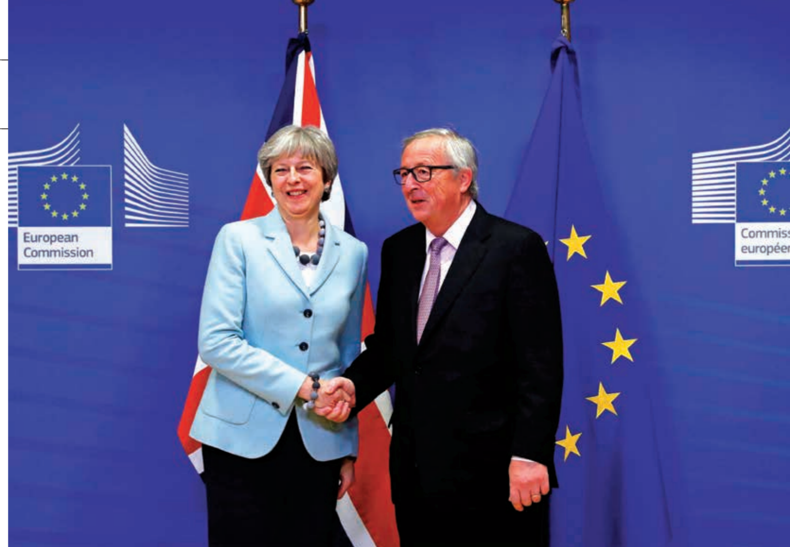
La líder del Partido Conservador y primera ministra del Reino Unido, Theresa May y Jean-Claude Juncker, presidente de la Comisión Europea.

La reacción de los socios de la UE es diversa. Austria y Holanda afirman que darían más tiempo a Londres si tiene una estrategia clara. Portugal apoyaría la prolongación del plazo para negociar esa salida y el Ejecutivo español afirma que ya trabaja en medidas de contingencia y prioriza los