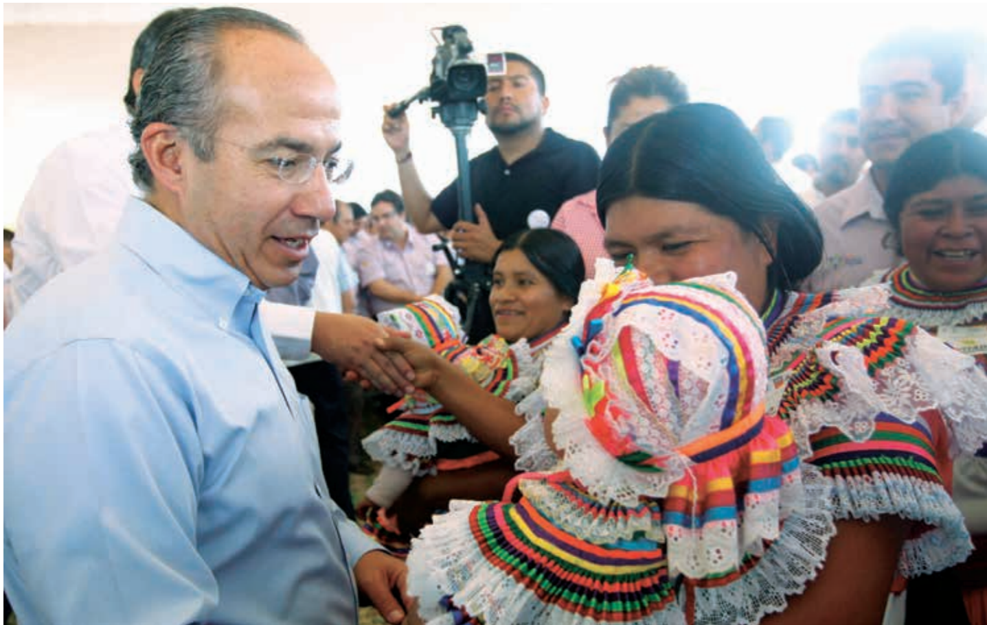
Ni el programa Prospera de Felipe Calderón, ni Contigo, de Vicente Fox, consiguieron impulsar el crecimiento económico del país y reducir así los índices de pobreza.