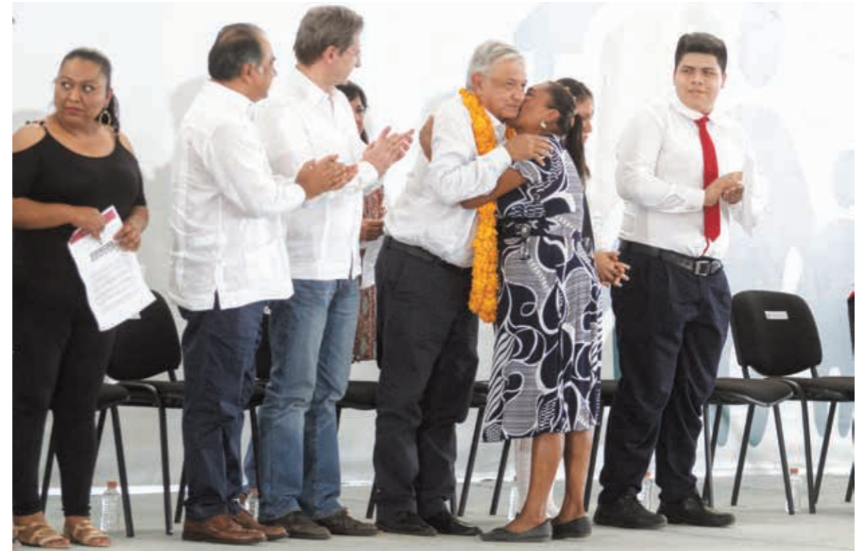
Ante miles de estudiantes de diferentes instituciones educativas, el presidente Andrés Manuel López Obrador entregó apoyos a jóvenes y madres, como parte del programa de Bienestar para las Familias. En la imagen, con Esteban Moctezuma Barragán, titular de la SEP, y el gobernador Héctor Astudillo.

E s evidente que el sistema de comunicación política de la Cuarta Transformación (4T) construye un México ideal y feliz para una población lacerada severamente durante 36 años de neoliberalismo y urgida de vías reales de movilidad social para salir de la pobreza, el desempleo masivo y la violencia delictiva.