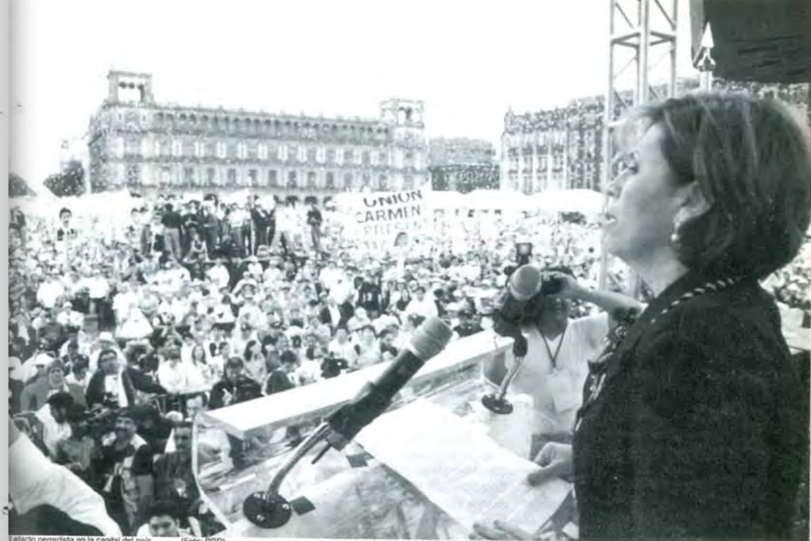
El efecto perredista en la capital del país.

De todo lo anterior se desprende como conclusión principal la necesidad urgente de opciones políticas que ofrezcan soluciones efectivas a los grandes problemas nacionales. Se requiere de partidos que tanto en el poder ejecutivo como en la agenda legislativa pugnen por establecer como prioridad el combate a la pobreza, esa calamidad que destruye física y espiritualmente a la mayoría de los mexicanos e impide el desarrollo de una economía independiente y competitiva. Al hacerlo se beneficiaría a los sesenta millones de pobres y los 24 millones en pobreza extrema, pero también se propiciaría el desarrollo económico. Así pues, sin mejoras reales y sostenidas en la vida de la gente, la alternancia por sí sola no basta y no pasa de ser humo en los ojos. ■