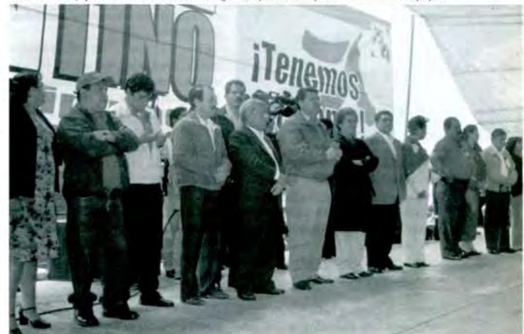
Congruencia del trabajo político en Chimalhuacán