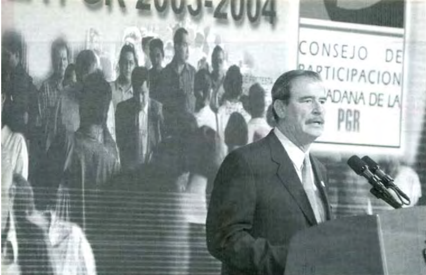
El desencanto ciudadano no parece afectar al Presidente.