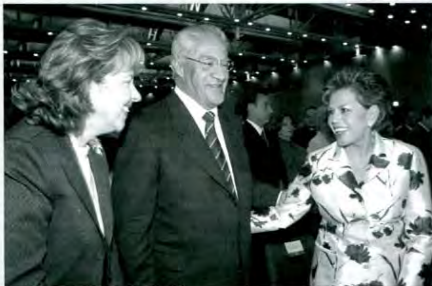
¿Cuántos políticos se encomiendan a los santos?