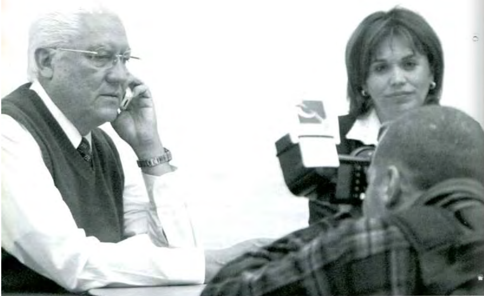
Finalmente, el PRI hizo lo suyo en la Mixteca.