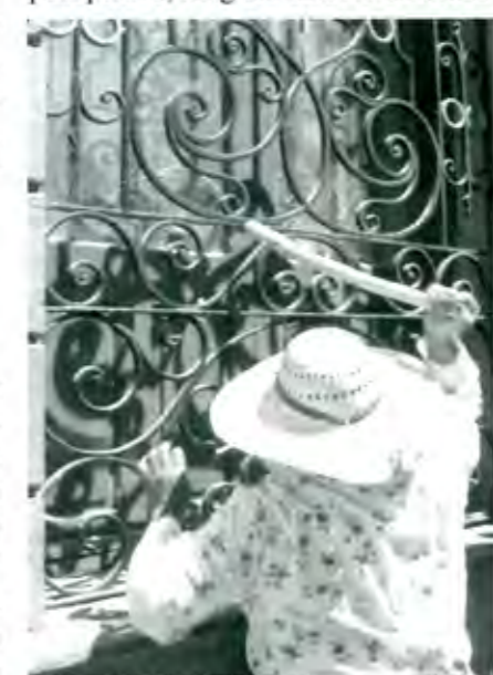
Una jornada relativamente tranquila

Tres fuerzas políticas quedarán: PRI, PAN, PRD, éste último se mantiene pese a que bajó su número de votos, y pospuesto, no ganó un solo distrito.