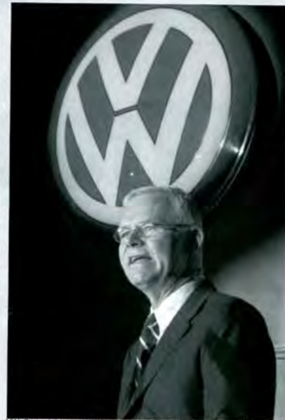
VW: Se acabó la producción del vocho y comienza la crisis de empleo.

Y hasta la próxima, cuando comience a conformarse la nueva cámara de diputados de la que dependerá el nuevo proyecto de nación. ■