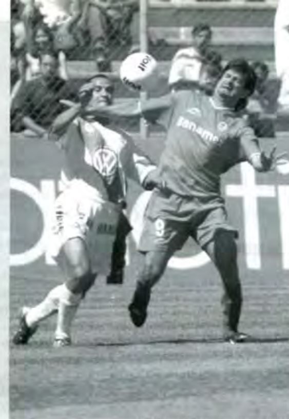
En el TRI, ninguno de la talla de Cardozo.