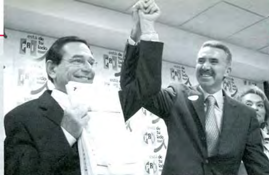
El PRI tiene que hacer un ejercicio de auto crítica.

El Partido Verde Ecologista creció y los partidos bonsái, desaparecen. Verde Ecologista, Convergencia y Partido del Trabajo, son los que tendrán acceso a la cámara y seguirán existiendo. ■