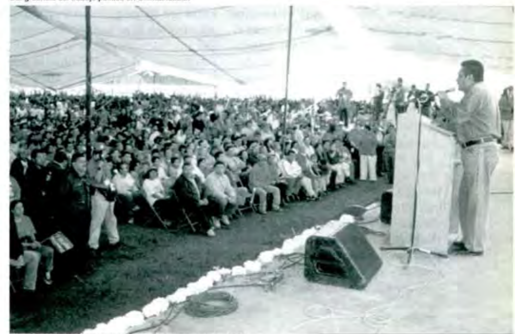
Uno de los distritos que mayor número de votos aportaron al PRI.