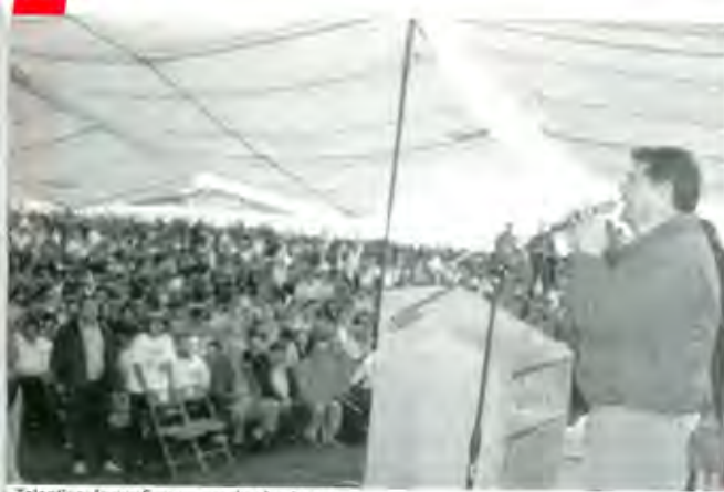
Tolentino: la confianza que dan las bases.