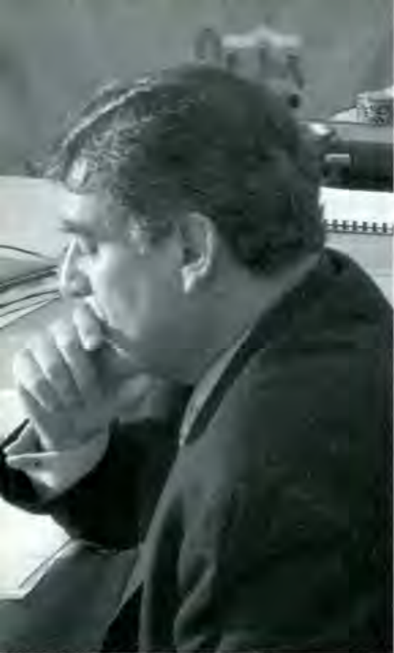
Paredes: cavilando sobre un futuro que se desvanece.