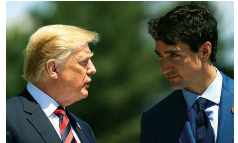
Canadá fue el último en aceptar las condiciones del nuevo Tratado.

Más allá de ese panorama, AMLO ha reiterado que buscará recuperar la soberanía energética mexicana, ampliando la capacidad nacional de refinar gasolinas con el fin de bajar los precios de los combustibles en el mercado mexicano y dejar comprar combustibles en dólares a las petroleras texanas. En función de este