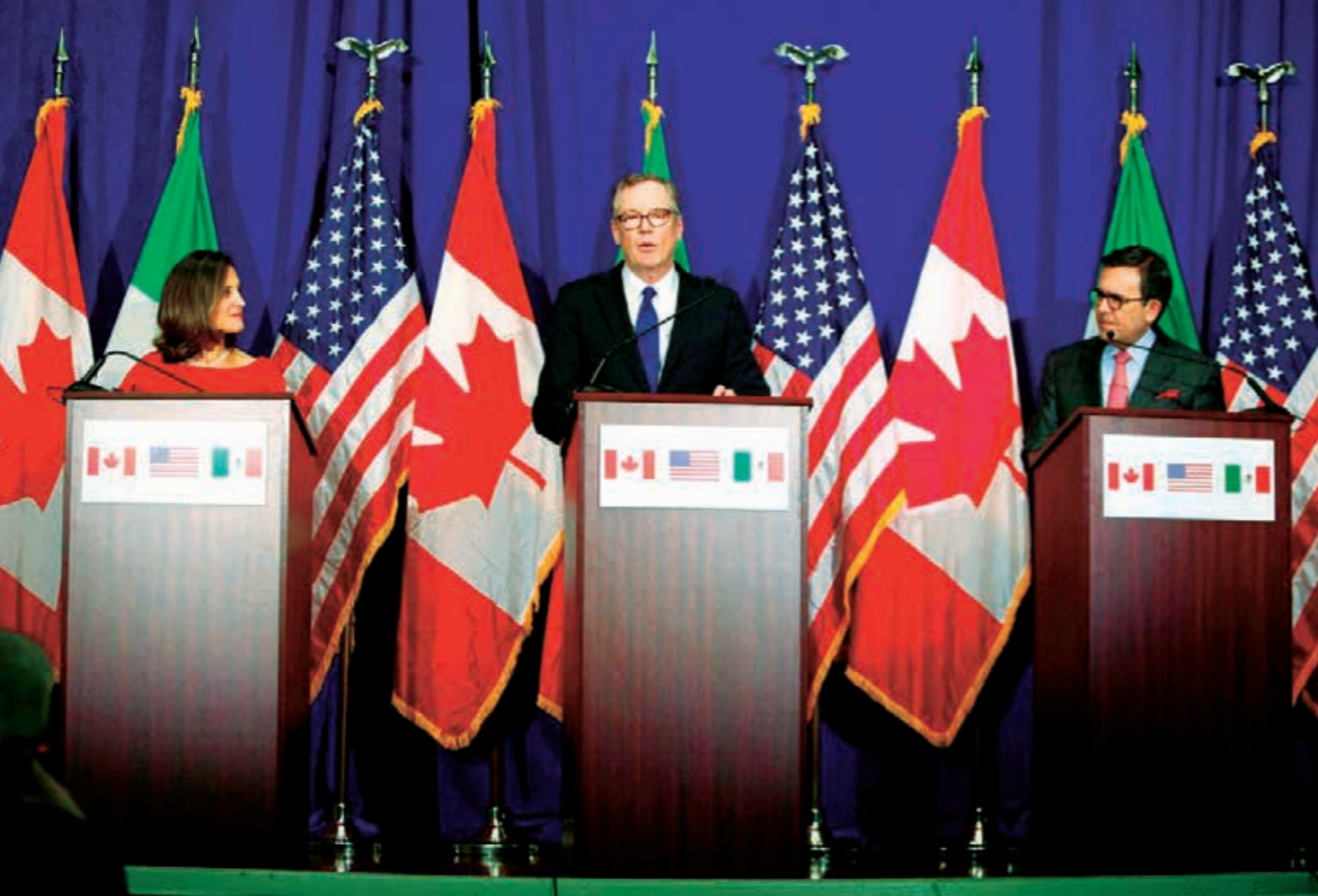
La Ministra de Relaciones Exteriores de Canadá, Chrystia Freeland, el Representante Comercial de Estados Unidos, Robert Lighthizer y el Secretario de Economía de México, Ildefonso Guajardo Villarreal concluyen ronda de negociaciones.

que ha usado en su guerra comercial contra China, principal competidor global de EE. UU., cuyo gobierno ha mostrado su interés en profundizar inversiones en México y en el resto del continente.