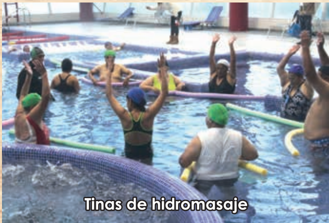
Tinas de hidromasaje

D e los 125 municipios que conforman el Estado de México, Ixtapaluca es el primero en tener un centro recreativo para el adulto mayor (CERMAS) de alto nivel. Hasta el momento, el Sistema Municipal de Desarrollo Integral de la Familia tiene inscritos a tres mil 500 abuelitos, distribuidos en 81 grupos.