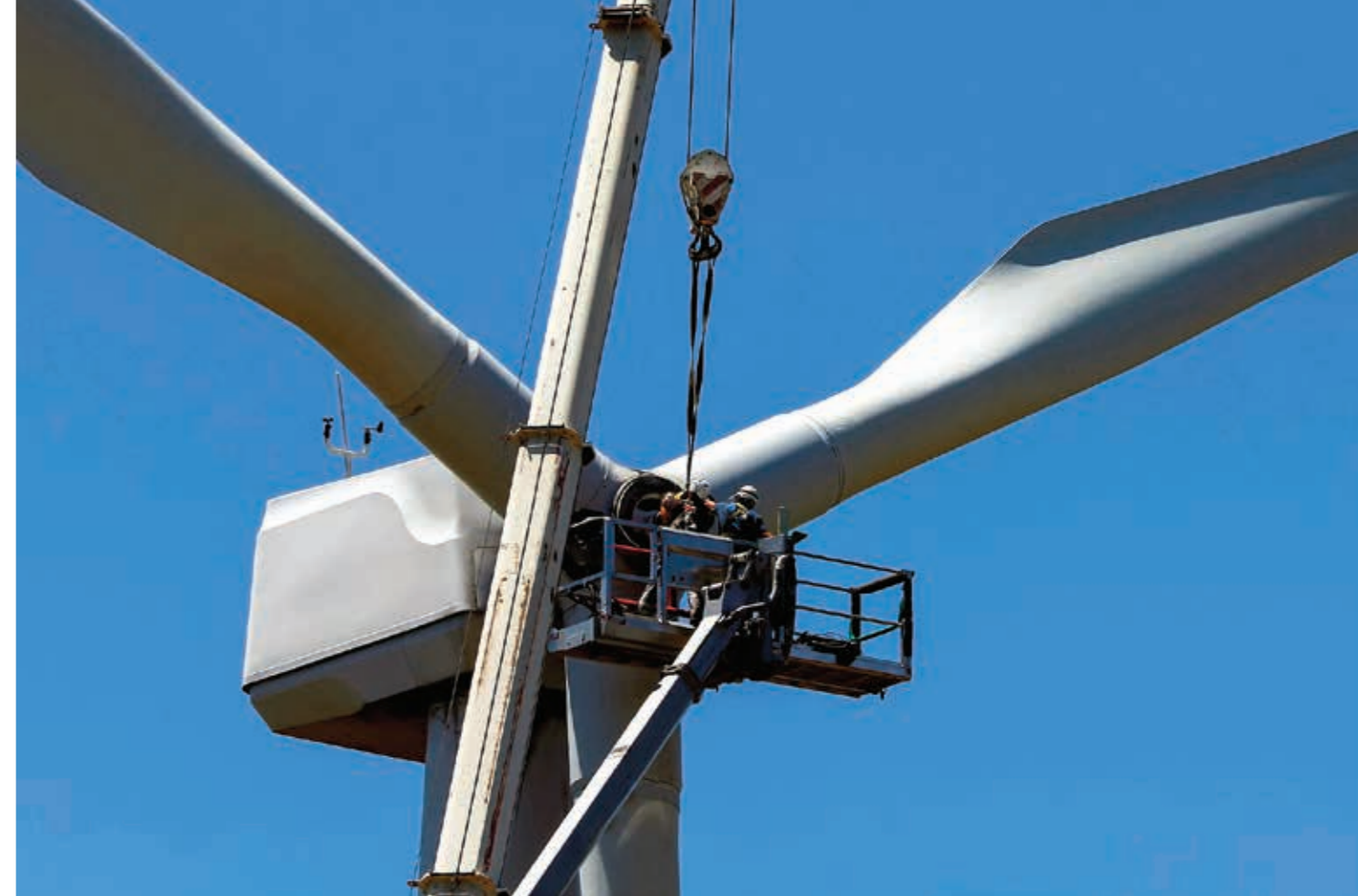
El potencial eólico en México es innegable, pero existe un claro problema social que separa a las empresas de las comunidades.

“Es decir, que el olmo comience a dar peras o que el viento sople a favor de todos”, dijo el experto. b