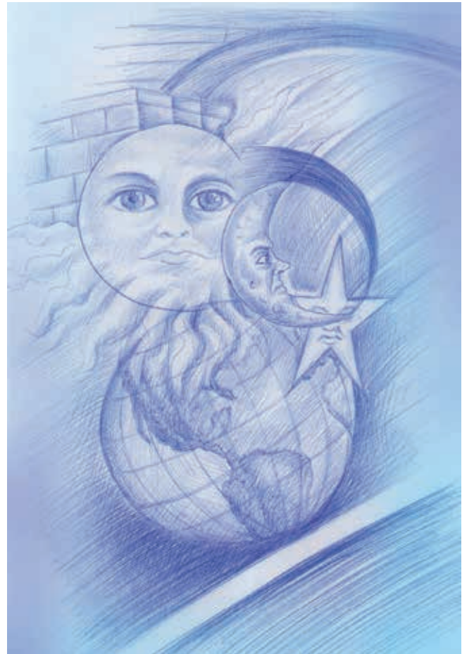
Ilustración: Carlos Mejía

Sin embargo, aún en este texto de divulgación, el Piscator de Salamanca no renunció a exhibir los conocimientos de dos de sus 20 oficios de sobrevivencia: la astrología y la alquimia. En la primera jornada del libro, después de explicar que los metales están integrados con azufre y azogue (mercurio); que estos elementos surgen de la cocción de agua y tierra con el fuego interior de ésta y que los más puros tienen menor porción térrea y están mejor cocidos, como es el caso del oro y la plata. ¿De esto se deduce que no hay “metal que no esté empreñado del azogue y que todos los metales vienen a ser oro imperfecto o no bien cocido?”, pregunta uno de los amigos. Torres responde: “Es así; pero además destas precisas materias y decocciones, que hemos dicho, es de advertir que en cada metal trabaja con especialidad un cuerpo celeste y así el Sol purifica el oro; la Luna es la que trabaja en la plata; Saturno en el plomo; en el hierro Marte; en el estaño Júpiter y en el latón Venus; y de esta impresión y especial influencia, la deducen los filósofos por la similitud que en las cualidades tienen estos metales con aquellos astros”. Más adelante, el astrólogo Torres habla de la influencia que los planetas tienen sobre los hombres el día de su nacimiento, según la alineación de aquellos con