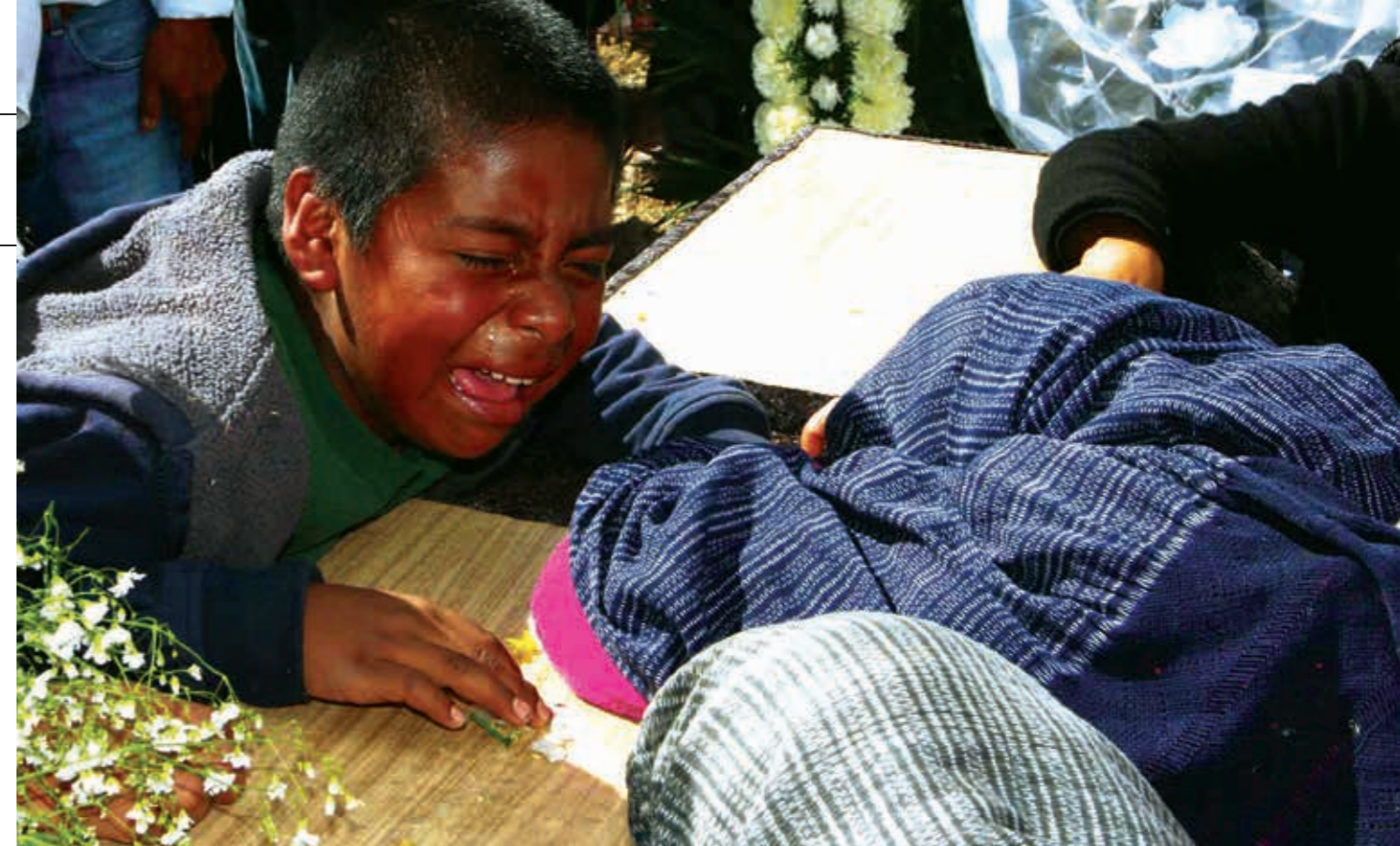
El conflicto entre Santo Domingo Yosoñama y San Juan Mixtepec se inició en 1945, con la disputa de las más de mil 740 hectáreas; pero el problema, en lugar de solucionarse, se ha venido agravando.

Los cinco hechos violentos y las 33 víctimas mortales han sido también atribuidos a otros posibles móviles —acciones de la delincuencia organizada y robo de autos— pero prevalece la línea de investigación que los vincula a la disputa agraria y todos tienen en común que los crímenes permanecen impunes. A excepción de San Pedro Mártir Quiechapa, caso en el que la Fiscalía General de