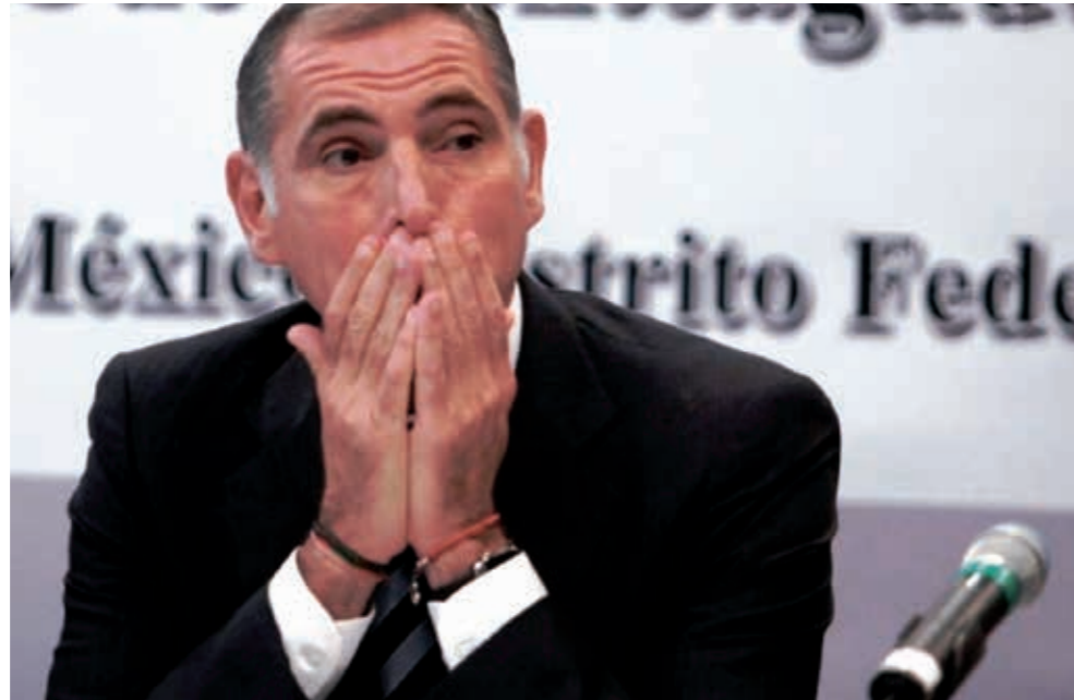
Asesinatos impunes durante el sexenio de Gabino Cué Monteagudo.