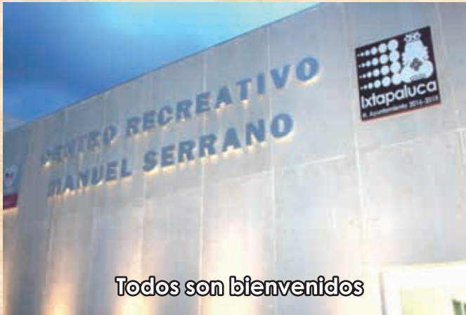
Todos son bienvenidos

D e los 125 municipios que conforman el Estado de México, Ixtapaluca es el primero en tener un centro recreativo para el adulto mayor (CERMAS) de alto nivel. Hasta el momento, el Sistema Municipal de Desarrollo Integral de la Familia tiene inscritos a tres mil 500 abuelitos, distribuidos en 81 grupos.