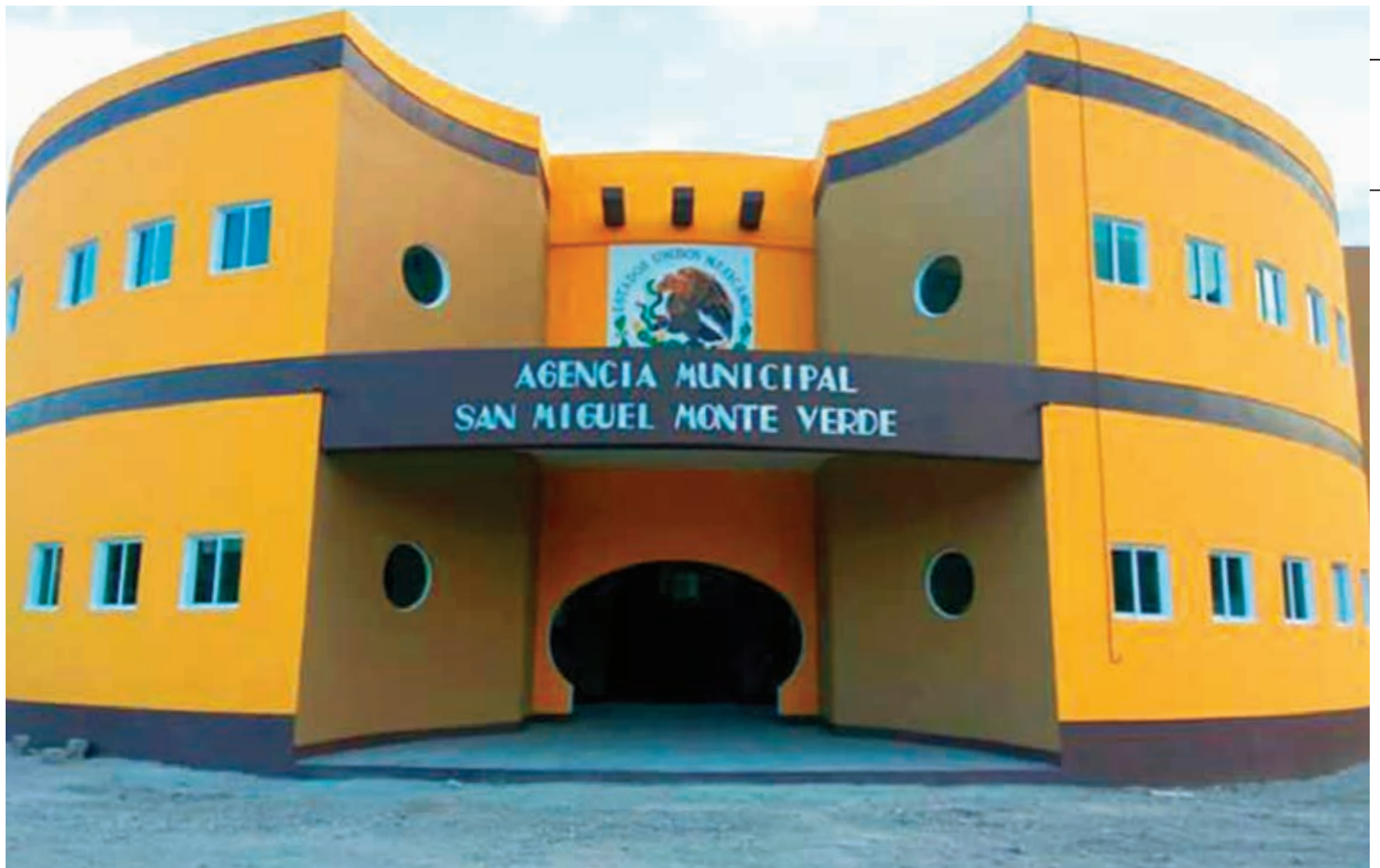
A diferencia de la dispersión con que hasta entonces habían vivido, el proyecto los ubicaba en un mismo entorno social, ordenado y armonioso, que con el paso del tiempo se fue concretando a la perfección.