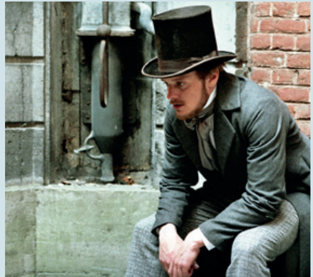
Fotograma de El joven Karl Marx .

Para Marx y Engels, la gran diferencia entre los métodos de formación y lucha de los seguidores de Proudhon, de Bakunin y del mismo Weitling estribaba en que estos “ideólogos”, en realidad no aportaban ideas revolucionarias a los obreros, no educaban a la gran masa trabajadora con una ideología científica; por ello crearon una teoría revolucionaria tan completa y armónica que nadie ha podido refutarla después de más de siglo y medio de su nacimiento, porque permita una visión de cambio integral de la realidad