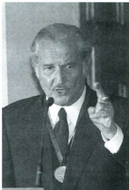
Carlos Fuentes: honor al literato.

Y sin lugar a dudas otro acontecimiento que hará que de Puebla se hable en todas las capitales del