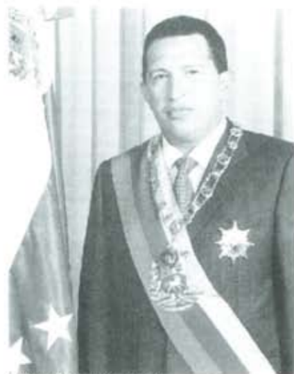
Hugo Chávez: resistir el acoso.

El movimiento bolivariano, festejó el domingo pasado, el primer aniversario de la derrota que el proceso revolucionario propinó a la reacción venezolana. Aquel amanecer del día 13 de abril de 2002, cuando con su acción en las calles hizo abortar y fracasar la conspiración fascista, el pueblo venezolano validó y legitimó, una vez más al Gobierno del presidente Hugo Chávez a quien rescató e hizo regresar al poder, tras haber sido secuestrado por los golpistas. Esa acción debió ser una lección para los enemigos del proceso, arrasados en las urnas en diciembre de 1998, para aquellos partidos tradicionales desplazados de las estructuras del poder por decisión de la mayoría.