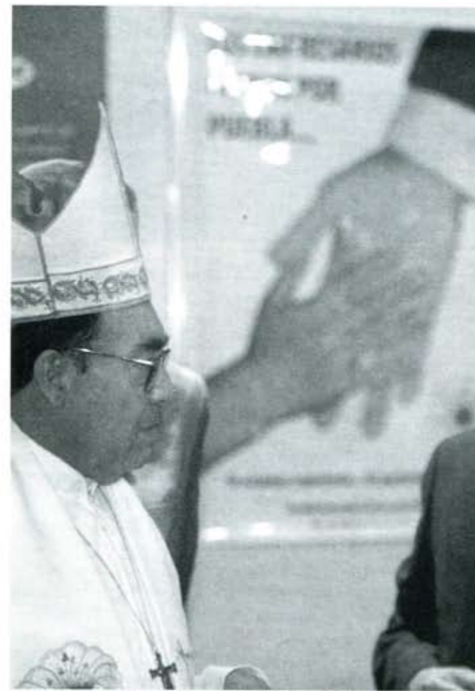
Pese a la crisis de los guías, se avencinan buenos días para Huesca.