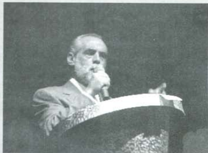
El "Jefe" de los panistas, atacado desde los Pinos.

Cada vez es más evidente que la disputa en la cúpula gubernamental sube de tono sin que nadie, ni siquiera el Presidente de la República, muestre que tiene los instrumentos necesarios para detenerla.