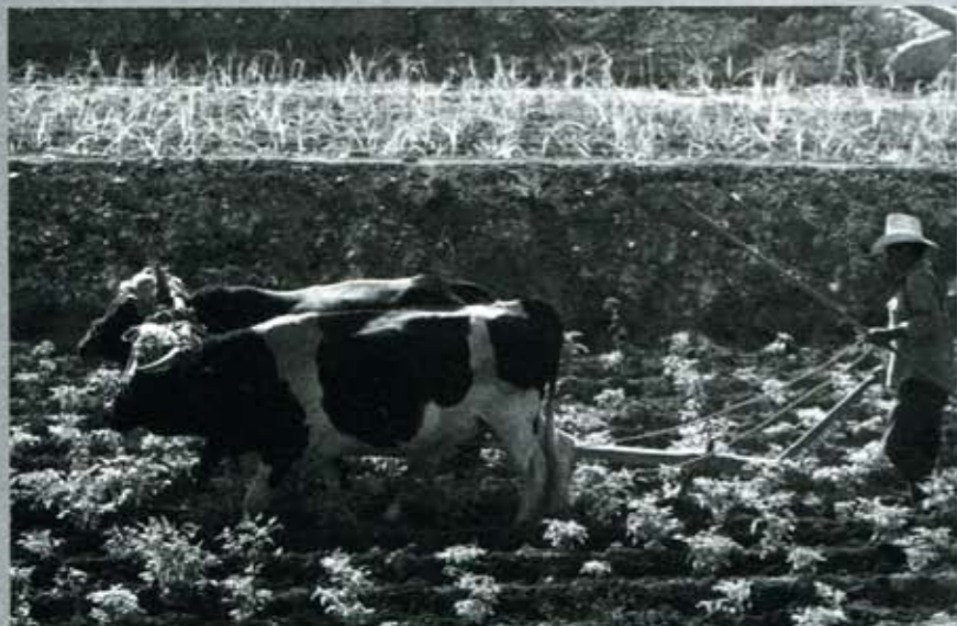
Hay quienes piensan que el campo es un estorbo...

Se dice que es objetivo aquello que tiene existencia propia, sea que los hombres lo conozcan o no, les guste o no; la realidad es objetiva, pues existe más allá de la voluntad de los hombres, sin importar preferencias o valores morales de economistas, filósofos o políticos. Lo subjetivo, en cambio, es lo que existe en la mente de los individuos, sus ideas. Pero la realidad, sea en la naturaleza, la sociedad o el pensamiento, tiene otra característica: su propia dinámica, pero no de manera desordenada, sino mediante procesos regulares, regidos por lo que se conoce como leyes, claro, muy diferentes a las que escriben los señores diputados. Las leyes expresan la regularidad con que ocurren los hechos y es tarea de la ciencia descubrirlas y formularlas. Sin embargo, el pensamiento anticientífico se ha empeñado en negar que existan, reemplazándolas con un mundo caótico y regido por la arbitrariedad.