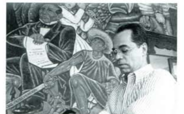
...esta elección será crucial