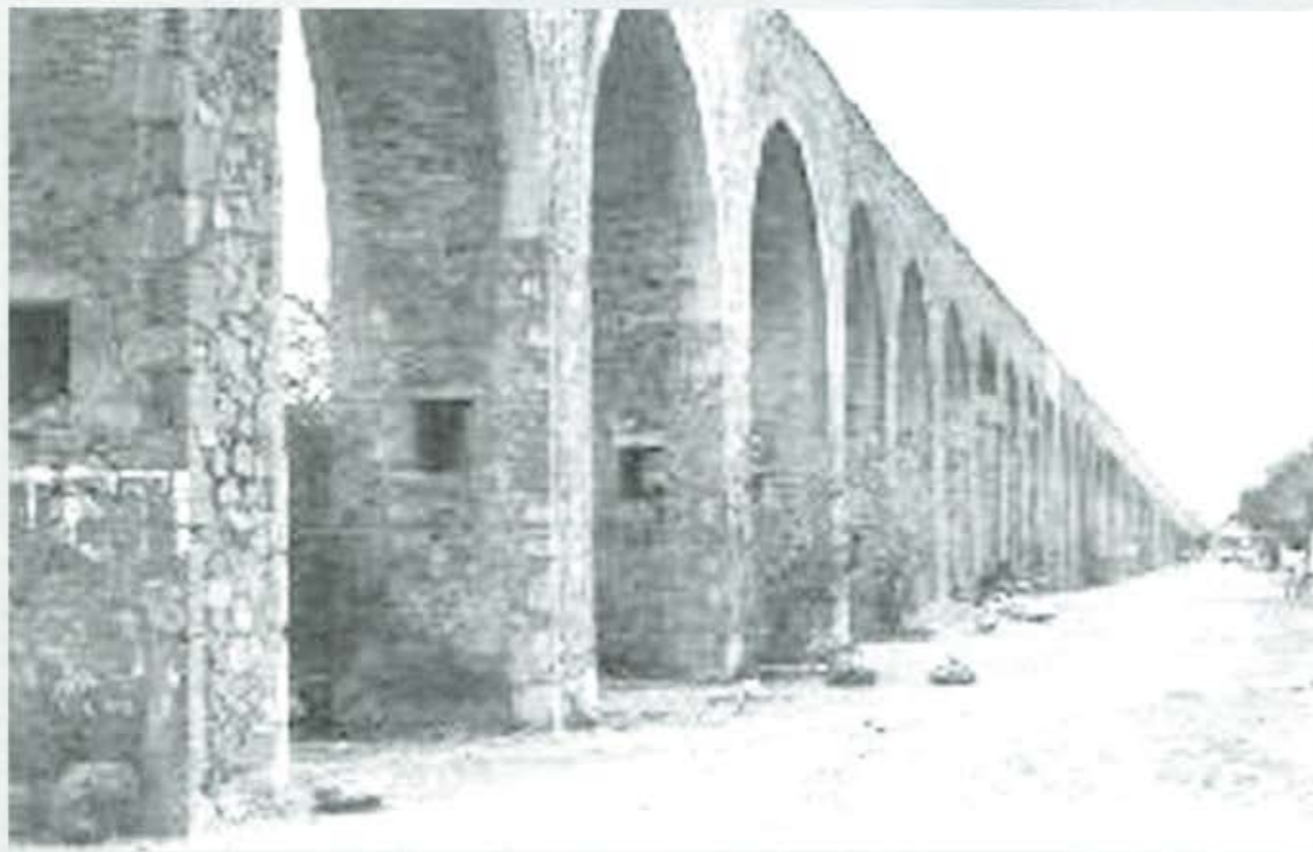
El velusto acueducto de Izúcar.

A partir de los años 80, los grupos considerados de izquierda en Izúcar de Matamoros, se vieron demasiado activos, organizando marchas, mítines, plantones y cierres de carreteras, esto en protesta por los constantes secuestros y la falta de seguridad pública en este municipio.