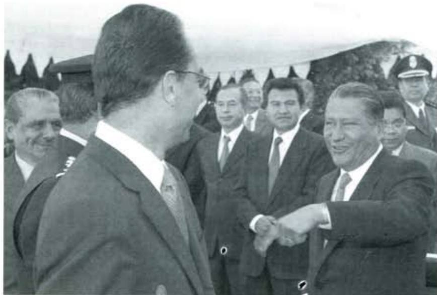
En la tierra de los Jiménez...