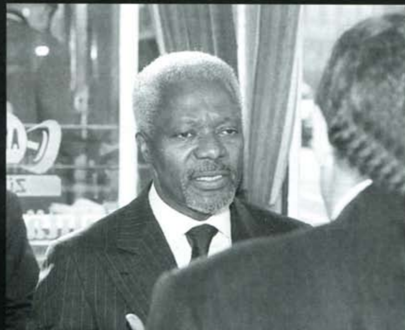
Kofi Annan, Secretario General de la ONU, en un momento crítico para la institución.

Todo esto viene a cuento por la masacre de Irak. En efecto ¿Cuál fue,