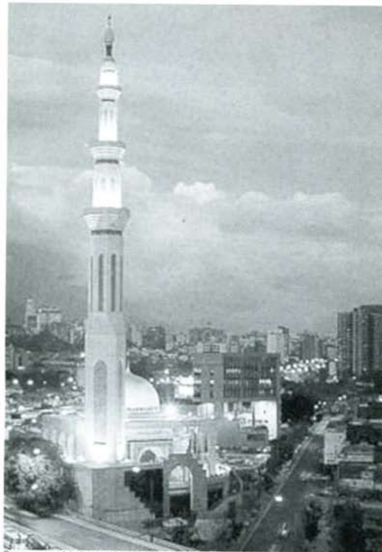
Como una paradoja, la mezquita de Ibrahim se levanta en Caracas.

heredada de los gobiernos anteriores. Los primeros días de este ejercicio fueron una buena señal: con la supresión de las matrículas se inscribieron 600 000 escolares; se crearon 519 escuelas bolivarianas con desayuno, almuerzo y merienda