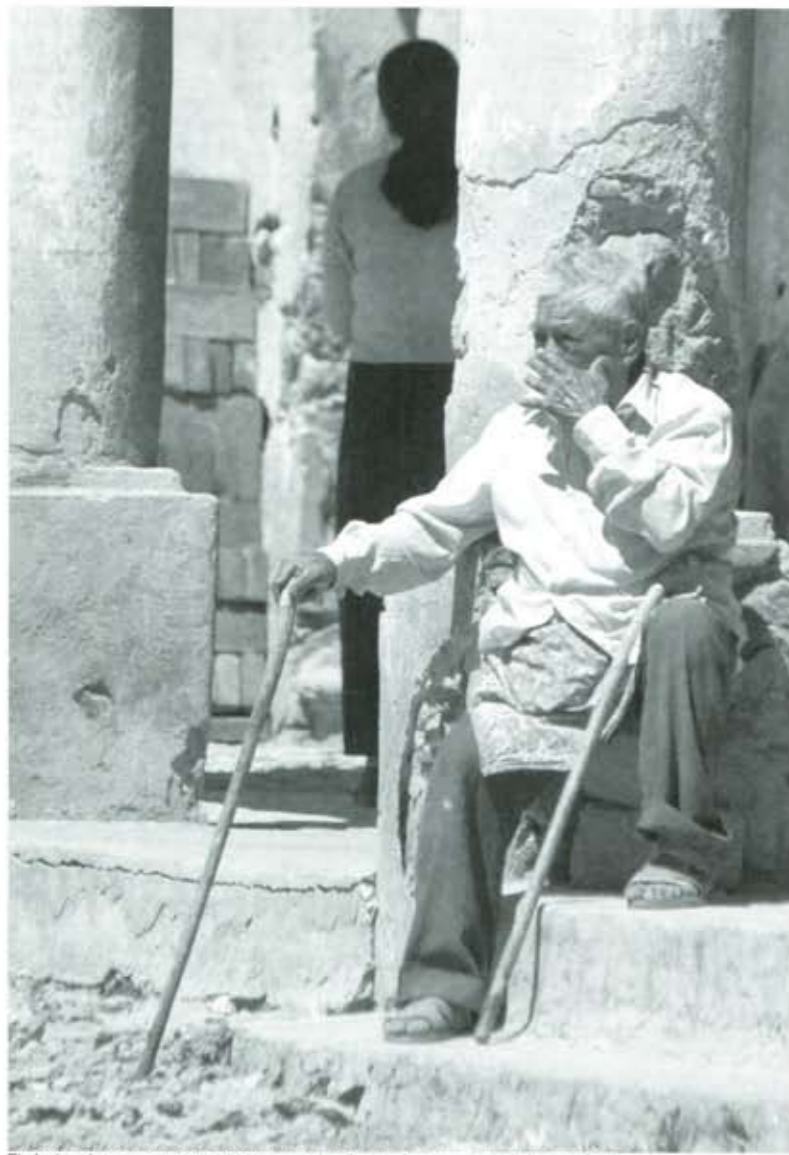
El electorado serrano parece agotar su paciencia ante las promesas de los candidatos.