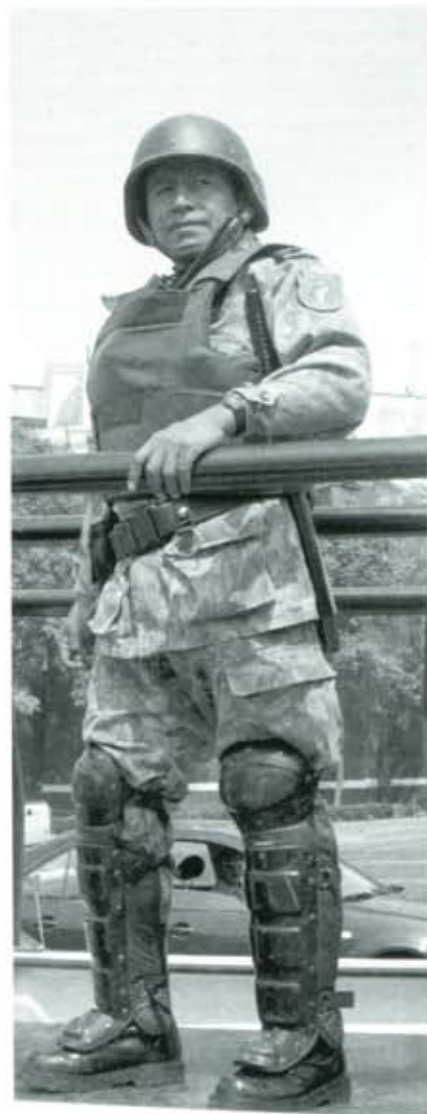
Un negocio sin escrúpulos.

La guerra contra Irak, además de buscar el sometimiento de un país políticamente independiente, pretende ganar mercados para los empresarios americanos, y en menor medida de los países aliados, pero mediante el pillaje,