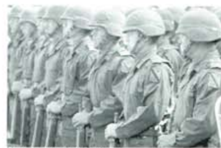
Literalmente, entre dos fuegos.

Finalmente, la guerra complicará aún más las cosas por el temor de atentados contra territorio americano, ahuyentando así a los capitales que se alejarían en busca de mayor seguridad, favoreciendo así el crecimiento de otras economías, competidoras suyas, mismas que ahora se sienten despojadas por la política filibustera de Estados Unidos. De seguir esta tendencia criminal basada en la guerra, los Estados Unidos habrían de perder paulatinamente su categoría de potencia única y podrían ver reducida su importancia en un escenario de capitalismo multipolar o menos supeditado a una sola nación como el actual. El odio creciente de la población del mundo no puede ser ignorado; política y económicamente entraña una alta peligrosidad, por lo que aún cuando los Estados Unidos triunfen militarmente en Irak, esa podría ser al final de cuentas una victoria pírrica. ■