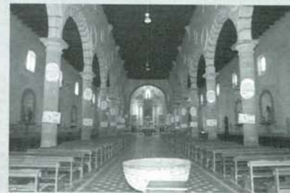
Algunos clérigos buscan otros foros de coacción...

Lo bueno es que los mexicanos ya estamos vacunados contra la demagogia y que se conocen las intenciones de quienes pretenden el cambio hacia atrás. Si al PRI le llevaron 71 años cansar al pueblo, al PAN le han bastado dos. ■