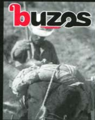
Portada: Matrix Photo