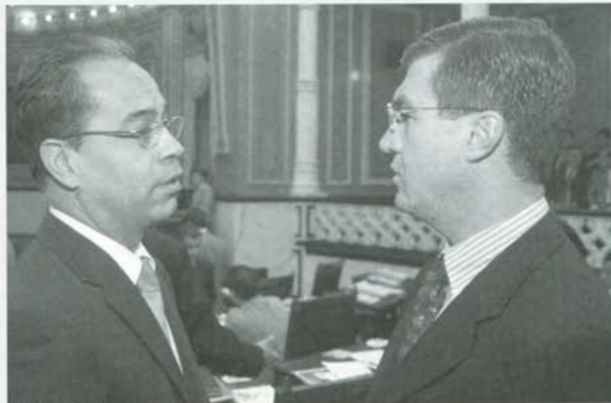
El 6 de julio: cara a cara

de libertades con base en la ley. Es distribución equitativa del saber, del tener y del poder. Es institucionalización del diálogo. Es confianza en la palabra razonable y veraz. Es voluntad de convivencia con quienes piensan de manera diferente. Es decisión de fundar la autoridad en razón, para que la autoridad tenga la razón que la sociedad le dé. Nosotros estamos convencidos que el progreso humano y, por tanto, el progreso de la Nación, depende de la capacidad que las y los mexicanos tengamos para edificar un Estado de libertad en el que nuestras acciones estén motivadas por la responsabilidad social y se dirijan al bien común. La responsabilidad social es, fundamentalmente, la decisión de actuar para evitar o curar el daño o dolor innecesario que un hombre puede causar a otro hombre"