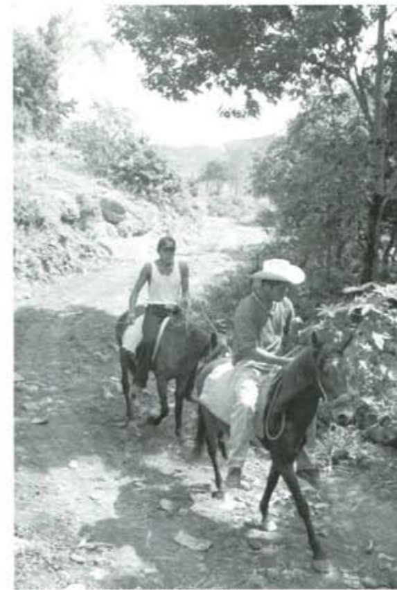
LA SIERRA. LISTA PARA OTRA ELECCIÓN...

comprensible el descontento hacia la autoridad luego de más de dos horas de hacer esperar al "respetable" -que en este caso no fue respetado- para iniciar un evento, aunque más bien la responsabilidad fue del Comité de Feria; en el segundo caso la rechifla se dio luego de que el locutor agradeciera irónicamente el apoyo recibido del ayuntamiento para regar el terreno de suertes y no se levantara una polvareda, apoyo que el ayuntamiento no dio.