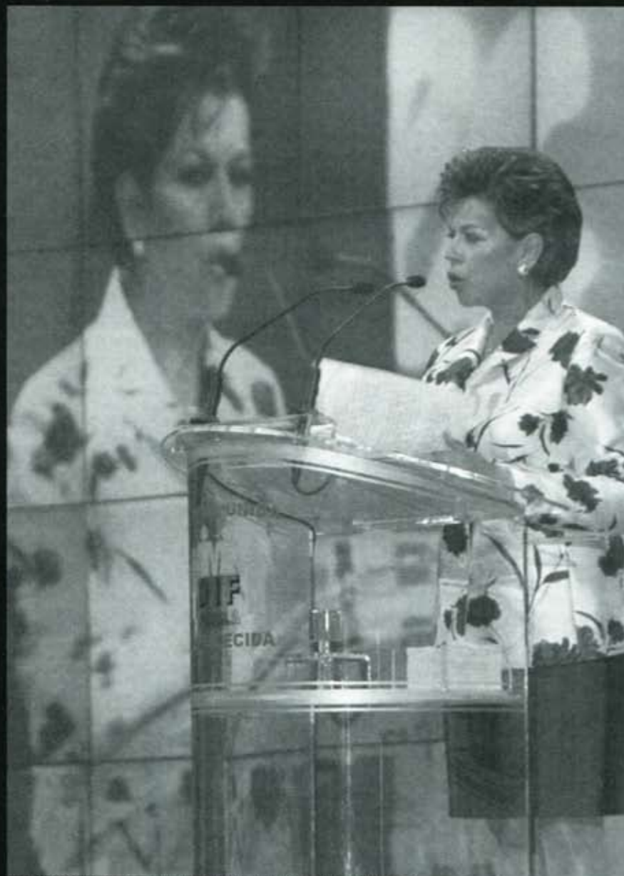
El reto es para el DIF, por ejemplo, que debe mantener los apoyos todo el año.