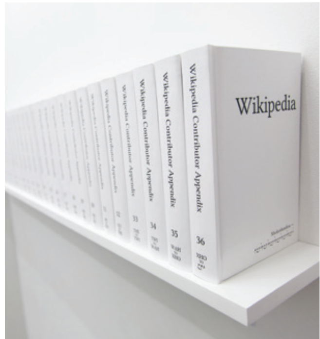
Print Wikipedia, 2015, Michael Mandiberg.

Se podría utilizar el argumento de que son una muestra de cómo el internet ha influido profundamente en las nuevas generaciones de artistas y que tal demostración es vital, pero aun así nos encontramos con creaciones artísticas que no nos