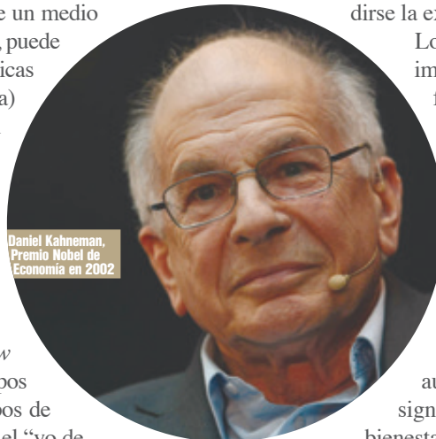
Daniel Kahneman, Premio Nobel de Economía en 2002

¿Qué podemos concluir? El bienestar no es solo un estado de consciencia. La memoria valorativa no hace justicia a todas las vivencias de las personas. No podemos confiarnos únicamente de los reportes de bienestar subjetivo. Hay que complementarlos con un estudio científico de los factores objetivos, biológicos, psicológicos y sociales del bienestar. Solo así tendremos un parámetro concreto que nos sirva como criterio para orientar el posterior desarrollo de las ciencias y asegurar que, en la medida de lo previsible, ésta sirva para el bienestar del ser humano y los demás seres sintientes, que es su objetivo deseable. b