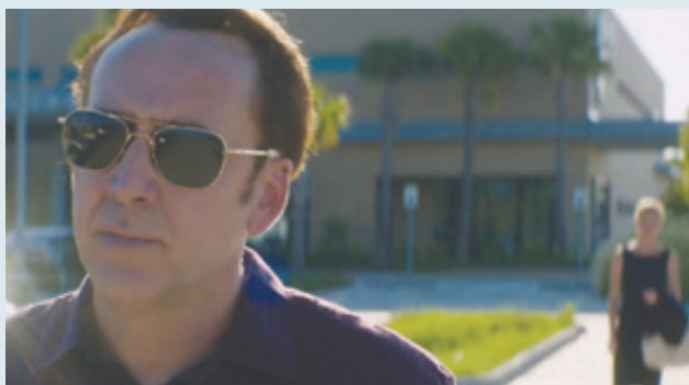
Fotograma de la película El corredor .

Antes del escándalo, Colin había rechazado prestarse a un enjuague ilegal y a un soborno de la poderosa empresa petrolera British Petroleum –culpable del gigantesco derrame petrolero que en 2010 afectó la fauna y flora marina de Luisiana y dejó a decenas de miles de pescadores sin trabajo– pero después de darse a conocer el affaire pierde la posibilidad de contender por la nominación para senador y su esposa Deborah (Connie Nielsen) inicia los trámites de divorcio.