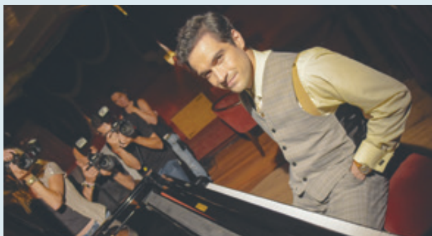
Fotograma de la película El elegido .

Pero, la cinta no asume una posición sobre quién tuvo la razón política en aquel periodo histórico, cuando el comunismo soviético sufría la más terrible de las agresiones militares conocidas hasta entonces en la historia de la humanidad: la invasión de los ejércitos fascistas de la Alemania nazi al territorio de la Unión soviética. Tampoco expone con claridad las críticas de Trotski al régimen estalinista, al cual consideraba “degenerado” porque se había convertido en una “casta burocrática” que no estaba creando una verdadera sociedad comunista y “había traicionado al proletariado mundial”. En fin, este filme tiene correctas actuaciones pero hay mucho desperdicio en su relato de la temática central. b