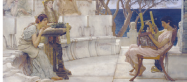
Safo y Alceo.

No entiendo la querrela de los vientos: viene una ola rodando de este lado y de ése, otra, y nosotros en medio somos llevados con la negra nave