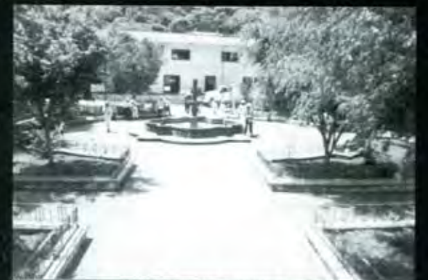
La Plaza de Armas, ejemplo de espacios dignos para la ciudadanía.

Huitzilán de Serdán experimenta un cambio importante, y no obstante la pobreza no se ha ido, se dan ya los pasos para hacer de Huitzilán un municipio progresista, lo que se reflejará en mejores condiciones de vida para su población. ■