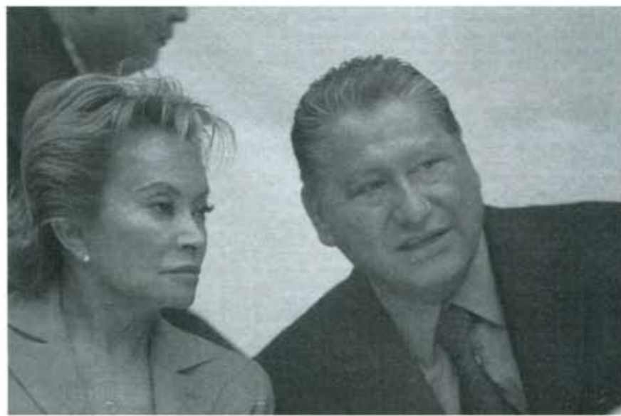
La pasmosa habilidad de Gordillo para salirse con la suya.

Cuánto mal le causan a la educación, los que teniendo la encomienda de atenderla, la ponen al servicio de sus intereses.