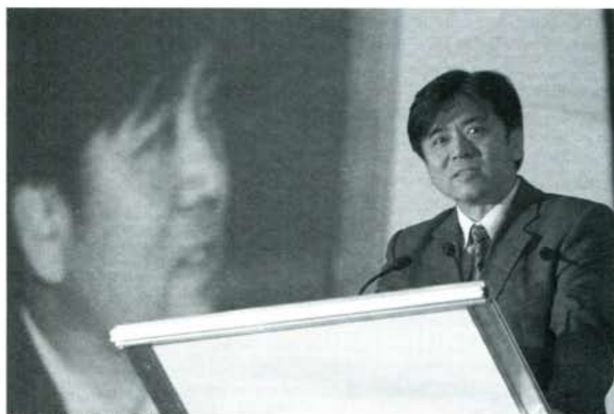
Los verdaderos "tigres" asiáticos.

La guerra del Medio Oriente hizo que pasara desapercibido el que China es, después de Canadá, el segundo proveedor más importante de los Estados Unidos de América, lugar que México ocupó hasta hace unos meses. En cuestiones económicas y de producción, China es muy activa. En el aspecto político, en la coyuntura actual, responde al viejo dicho popular. Está "como el chinito, nomás milando". Mirar y alinearse del lado de Francia, Alemania y Rusia es por ahora su estrategia. Su objetivo es claro: dominar al mundo. Por eso, al margen de lo que pase, China ganará en Iraq.