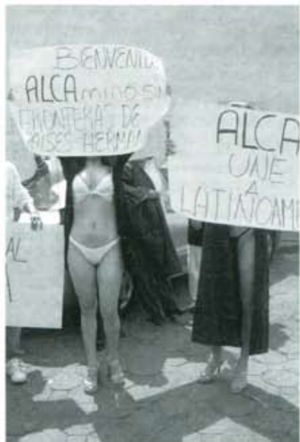
Nuevas maneras para impugnar.

Parece un exceso, pero el candidato Moreno Valle anda desenfrenado promoviendo su candidatura por radiodifusoras... de Huachinango. O los estrategas del ex secretario de Finanzas de plano no conocen la geografía regional, o la explicación a tal disparate -que francamente se antoja fantástica- tiene que ver con la intención del candidato para arraigarse en toda la entidad y ganar adeptos en su carrera por la gubernatura. Por eso, entonces, se explica que Moreno Valle contrate ¡también! spots promocionales en la ciudad de Puebla. Un atenta súplica al prevenido lector: si de casualidad escucha uno de estos comerciales en, digamos, Izúcar de Matamoros, no deje de indicarlo al estupefacto teclador.