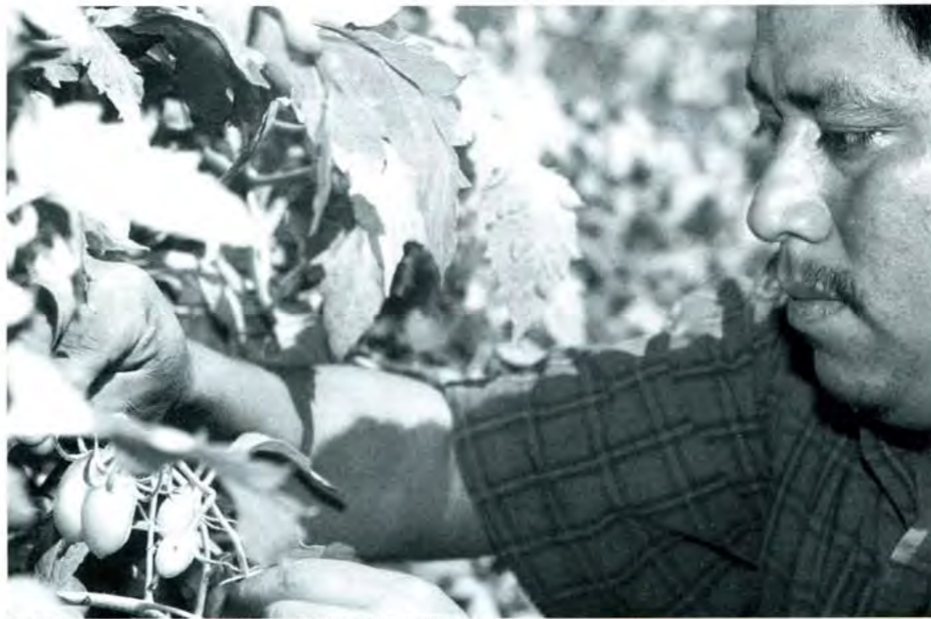
Pese a la demanda, es una profesión marginada por las presiones económicas y políticas.

Este declive se debe a causas estructurales que ya hemos comentado en otras ocasiones, principalmente el predominio de una estructura agraria fragmentada, que limitan productividad y rentabilidad, que empezaron a hacerse evidentes desde los años sesenta, cuando inició también la importación de alimentos, y que han provocado la descapitalización. De acuerdo con el investigador Wayne Cornelius en "La Transformación del México Rural", 1998, el sector agrícola ha recibido menos del 1% de la inversión extranjera directa desde 1993 y como lo advierte Alain De Janvry, para 1992 sólo el 2.5% de la producción ejidal era financiada por Banrural. Y el problema es que si no entra capital, los minifundistas no pueden autofinanciarse, por lo que la producción no crece, salvo en sectores y regiones muy localizados. Las pequeñas parcelas aisladas no producen