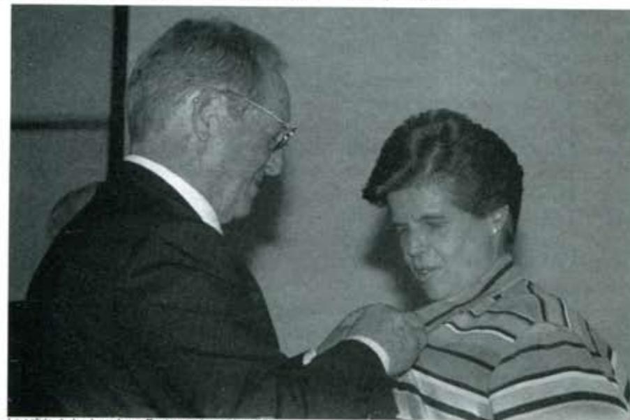
La salida de las herederas Espinosa desató la crisis.

Con esta noticia solo hay que decirnos ¡feliz mes de la mujer! Aunque en el fondo sabemos que con inteligencia y preparación, hacemos nuestra la era de la mujer que hoy suma más de la mitad de la población. ■