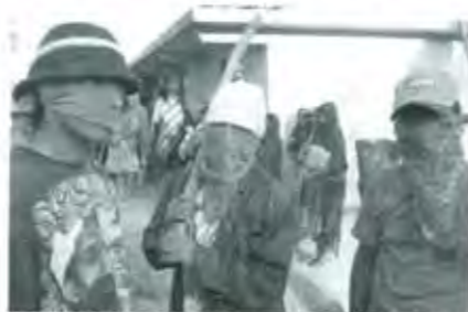
Ciudadanos: cada vez más incrédulos de los partidos.

Recuerden, o hagan memoria, que cuando el pueblo se decide, no existen barreras que le impidan luchar. ■