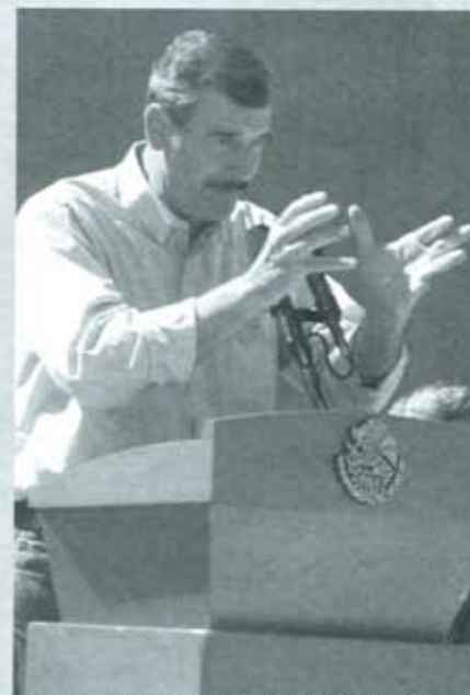
El Poder Ejecutivo no puede sustraerse del problema.

Otra parte dudosa de la actuación del IFE es la decisión de aceptar a ciegas la indagatoria y las conclusiones de la PGR, a sabiendas de que las presunciones sobre aportaciones indebidas al PRI que de ella se desprenden, están sustentadas casi totalmente en el dicho de "testigos protegidos", es decir, presuntos delincuentes que han obtenido inmunidad, a cambio de inculpar con sus testimonios a otras personas. Si en materia penal esa figura es sumamente controvertida porque se trata de un testimonio con credibilidad relativa, por eso la ley sólo los permite en casos de delincuencia organizada, en materia electoral el testigo protegido no es aceptado ni aceptable para probar una falta administrativa o un delito; a pesar de lo cual, en el Pemexgate el IFE decidió tomar esos testimonios como completamente ciertos, y sancionar a partir de ellos. ■