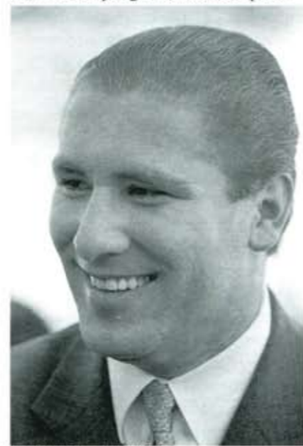
La reingeniería política y Rafael.

Los imagineros políticos, los malévolos y los manipuladores, estarán henchidos de contento: la fiesta democrática que suponen unas elecciones libres se ven enturbiadas por una maraña de sucesos que solo llevan desánimo a los votantes. Y peor, empujan a ese deleznable y único freno al cambio que se llama abstencionismo. Que a nadie sorprenda si este 6 de julio las elecciones registran niveles dramáticos de indiferencia. Es, precisamente, el pago retroactivo con el que la sociedad retribuye a sus representantes. Y luego se preguntan por qué las personas prefieren ver los muslos de Galilea Montijo en Vida TV en vez de escuchar las jaculatorias del triunvirato que gobierna a este país. ■