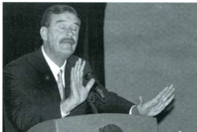
A ver si los poderosos no le cobran el desaire al Presidente Fox

Su actitud es no solo cobarde e indigna, sino antipatriótica. Es la entrega del país a los intereses