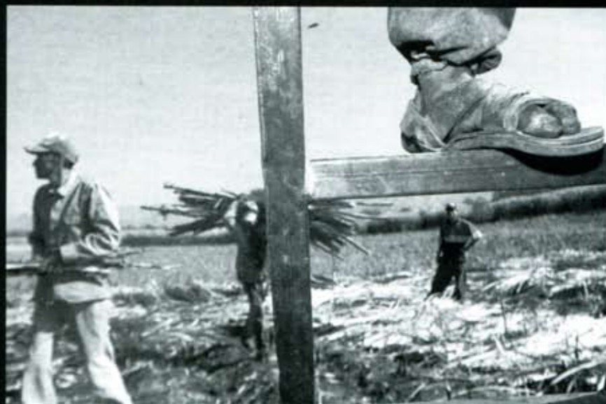
La tierra donde comenzó la historia