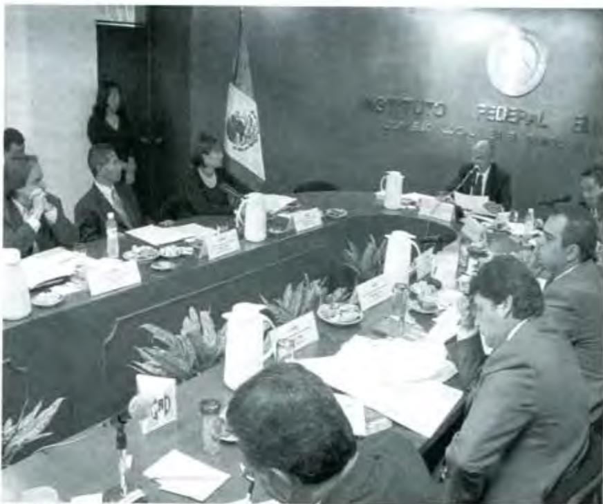
¿Responde el IFE a los propósitos ciudadanos que animaron su creación?