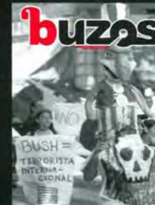
Portada: Matrix Photo