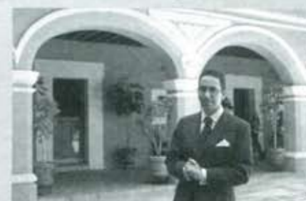
Una suerte de embajador? ¿messenger?