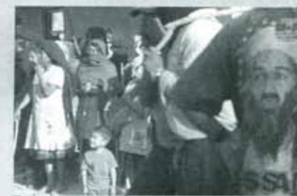
Encapuchados en la Sierra Negra.

¿Y Melquiades Morales? ¿Cuánto gastó el candidato del distrito 01 de Huauchinango en su precampaña? ¿Cómo se llama la discoteque en la que organizó una fiesta proselitista? ¿Y qué distinguida bebida ofreció a los convidados? ¿Quién es el genio creador detrás de la campaña del candidato de Chalchicomula? ¿Qué preguntó Javier Lozano cuando regresó a Casa Aguayo? ¿Quién representó a Puebla en el D.F. mientras Meza andaba de jolgorio en la Sierra? ¿En dónde está el edificio de la representación poblana? ¿Qué pasó con los alcaldes inhabilitados por el Congreso del estado? ¿Qué apoyo ofrece Manuel Méndez Marín a los policías con los que se entrevista en sus giras de trabajo? ¿Quién financia el movimiento rebelde de Huaxcaleca? ¿Quiénes son los verdaderos asesores de los encapuchados poblanos?. Se lo advertí: son sólo preguntas...■