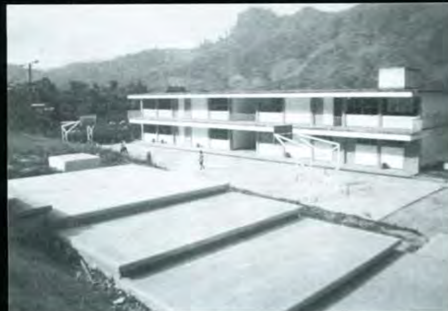
En Huitzilán, una verdadera revolución educativa.