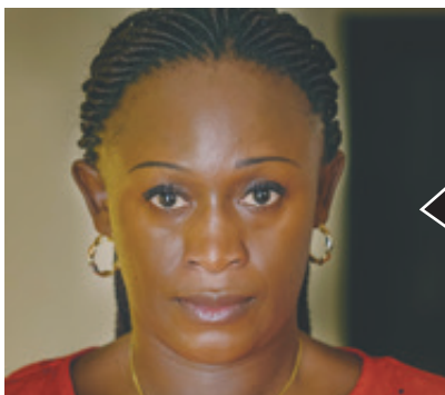
Caddy Adzuba: Escritora, periodista y abogada congoleña, férrea defensora de los derechos humanos y la libertad de expresión.

El Sistema de Transporte Colectivo (STC) Metro reportó filtraciones en algunas de sus estaciones, entre ellas Copilco y San Andrés Tomatlán, donde usuarios las grabaron y las exhibieron en redes sociales. El Tren Ligero a Xochimilco suspendió por tres horas su servicio en las estaciones Tasqueña, Las Torres, Ciudad Jardín y La Virgen.