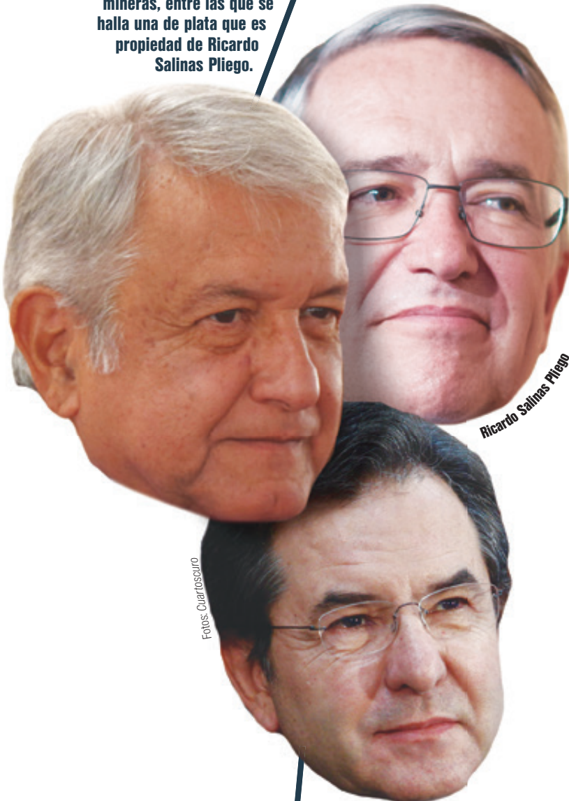
Ricardo Salinas Pliego

Andrés Manuel López Obrador (AMLO), se ha pronunciado en favor de otorgar más beneficios a las empresas mineras, entre las que se halla una de plata que es propiedad de Ricardo Salinas Pliego.