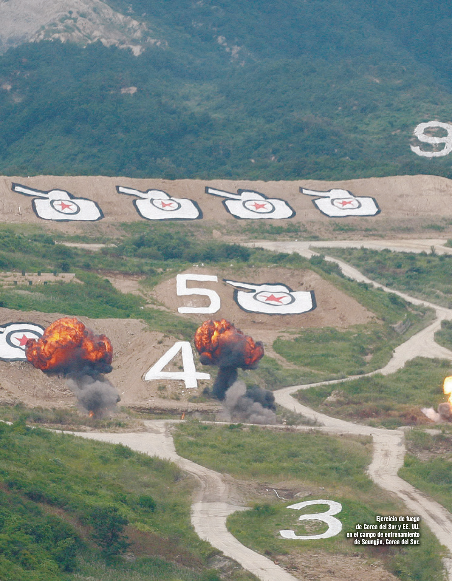
Ejercicio de fuego de Corea del Sur y EE. UU. en el campo de entrenamiento de Seungjin, Corea del Sur.