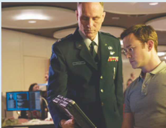
Fotograma de la película Snowden .

Snowden es un filme que vuelve a colocar a Stone como un realizador de primera línea, pero con su sello peculiar. Un cineasta que se ha autocalificado como “cronista” de la sociedad de EE. UU. Sin embargo, no es el simple narrador secuencial o cronológico de los hechos políticos relevantes del país más poderoso de la Tierra, sino que es ese director que se ha propuesto mostrar el lado más infame, oscuro, denigrante y que provoca más irritación en el público politizado de su país. Snowden es una cinta de muy buena factura, con un profundo significado en momentos tan difíciles que la humanidad vive dentro de la era Trump. b