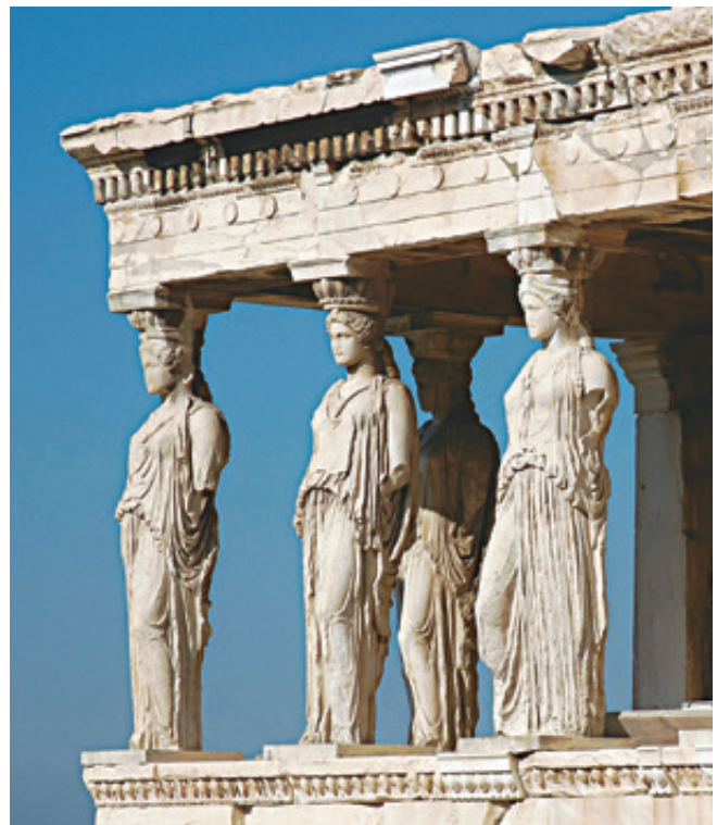
El pórtico de las cariátides, Grecia.

Ahora, ¿qué papel tiene el arte en la construcción de esta nueva sociedad? El arte, desde la antigua Grecia, ha servido para mostrar una parte de nuestras concepciones del mundo, pero, en especial, ha representado cómo vemos al hombre dentro de sí mismo; lo que pensamos que debería ser el hombre, lo que valoramos de él, está en el arte. Los ejemplos se hallan a la mano: en la arquitectura, podemos encontrar elementos que remiten a un cierto humanismo; los templos, en sus dimensiones, están hechos con toda disposición para el hombre, pues en ellos nada escapa al ojo humano. Los arreglos y las figuras son repetidos conforme a un canon de belleza que tomaba como base la representación real y objetiva de lo que le gustaba al hombre griego.