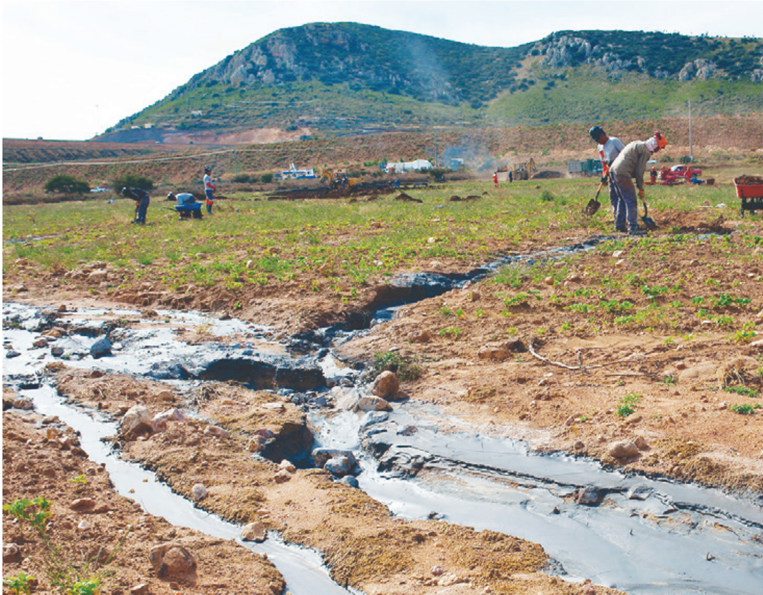
Labores de limpieza y recuperación de más de 600 toneladas de jales (desechos del proceso de molienda de minerales, que contienen metales pesados y sustancias químicas) en Fresnillo, Zacatecas.

➤ contribuciones y lo que están haciendo es exigir que se derogue el pago de estos derechos que de por sí no están afectando en lo absoluto sus intereses”.