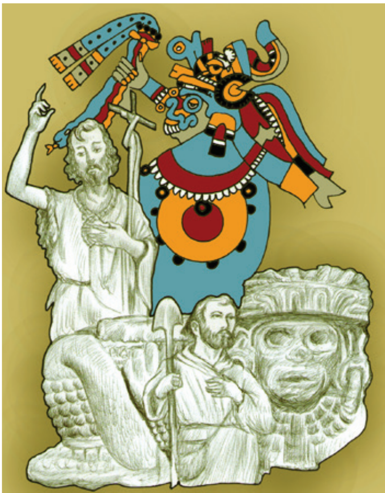
Ilustración: Carlos Mejía

lógicos por vía de la palabra, los sonidos y los materiales plásticos. Es decir, los mitos son creaciones poéticas con las que el hombre intenta desviar y trascender su realidad cotidiana, la cual suele serle ajena, hostil o adversa. Son una