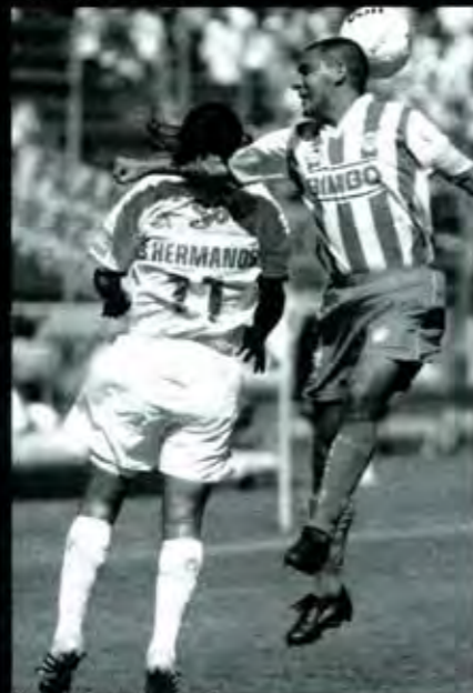
Cada juego, una decepción

No señores. Lo que ocurre en el fútbol profesional tiene un origen y una solución: A los jugadores les faltan arrestos. Y dignidad para enfrentar a su afición y demostrarle que desquitan cada centavo que entra a ese negocio llamado fútbol.