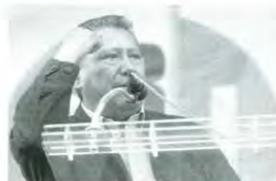
Melquiades Morales no le hizo el juego a nadie.

Tras la llegada del Gobernador del Estado, Melquiades Morales Flores al municipio de Izúcar de Matamoros para escuchar el primer informe del Profesor Melitón Lozano Pérez, los aspirantes priistas a la candidatura por la Diputación Federal del 14 Distrito electoral con sede en este lugar, intentaron acercarse al gobernador, a la más vieja usanza del sistema, para ser ungidos por el primer mandatario, cosa que no resultó como los candidatos esperaban, ya que Melquiades Morales Flores los saludó como a cualquier militante de su partido y se retiró dejando a sus correligionarios con la misma incertidumbre de estos días ¿quién es el bueno?