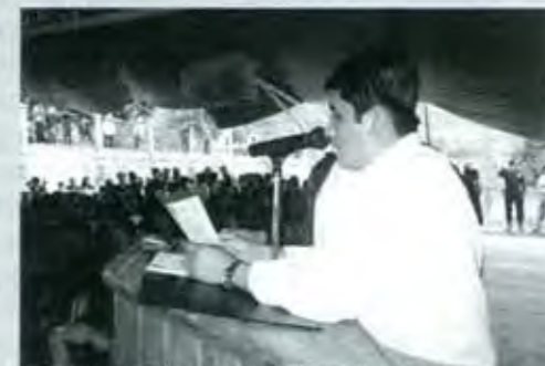
La capacidad de las autoridades de Huitzilán de Serdán.