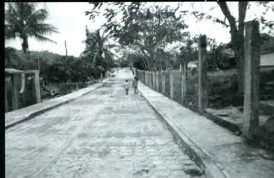
Obra pública de calidad para Jalpan.

El informe de Huitzilán también es singular porque de su techo financiero que en total asciende a 19 millones de pesos, el 73% se destinó a obra pública y solamente el 27% se destinó al gasto corriente, meta que no ha logrado ningún otro Municipio de la Región, menos el de la Cd. Capital, que según el informe del Alcalde panista, Luis Paredes, apenas alcanzó el 16% para obra pública.