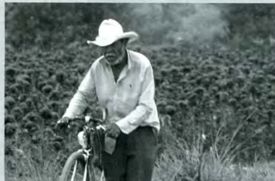
El intermediarismo no deja avanzar al campo.

Con mucha frecuencia oímos decir que el problema agrícola no está en la producción, sino en la comercialización, como si fueran dos mundos totalmente separados; se nos dice que la parte productiva está muy bien, pero que el problema se presenta cuando el productor intenta vender sus productos y encuentra precios muy por debajo de sus costos y falta de canales de comercialización. Pero en la realidad producción y comercialización son dos etapas de un solo proceso y lo que ocurre en el mercado se explica, aunque no totalmente, es cierto, en la fase productiva, pues ésta determina la calidad y precio de los productos y en buena medida su competitividad.