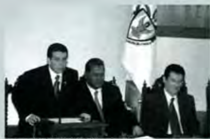
Universidad: entre el cielo y el suelo.

La presencia de la universidad pública en la entidad de Puebla, sin duda alguna, es muy importante, por encima de la universidad privada. Entre otras cosas porque cuenta con una diferencia, desde un particular punto de observación; la universidad privada no hace investigación. Los empresarios educativos, en ese sentido, no deciden invertir en este tipo de proyectos porque ello no le genera fuertes ganancias económicas. En una país en donde el hábito por la lectura dista mucho de ser una prioridad, cualidad o característica de la sociedad, los empresarios educativos se "preocupan" escasamente del asunto.