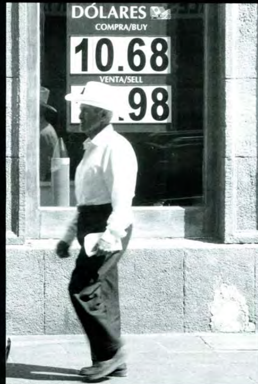
La tiranía del sistema yanqui.

Hoy el pueblo de Cuba resiste un golpe más que viene a sumarse a la lista, ya innumera, de ataques maquinados desde Miami, lugar donde tienen su guarida sus enemigos más feroces.