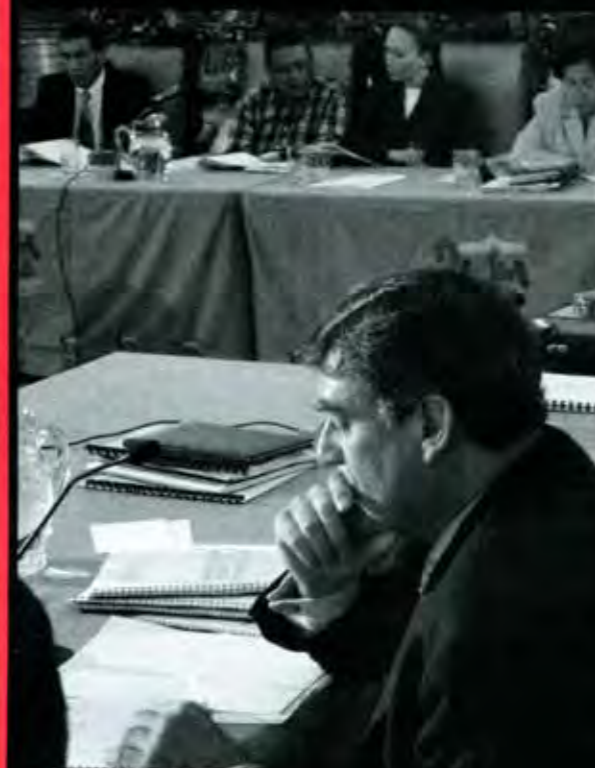
En su punto más bajo...