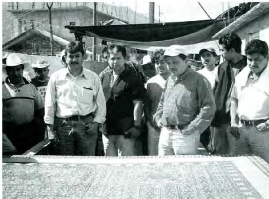
En Pahuatlán logró el respaldo de los jóvenes.

el medio rural, compuesto en su inmensa mayoría por comunidades indígenas en donde el atraso es doloroso y lastima a la dignidad de las personas. Es en ese sentido por donde transita nuestra propuesta: llegar al Congreso con propuestas claras para aterrizar proyectos productivos, para fortalecer los sistemas de salud y educación, para ser gestores eficientes.