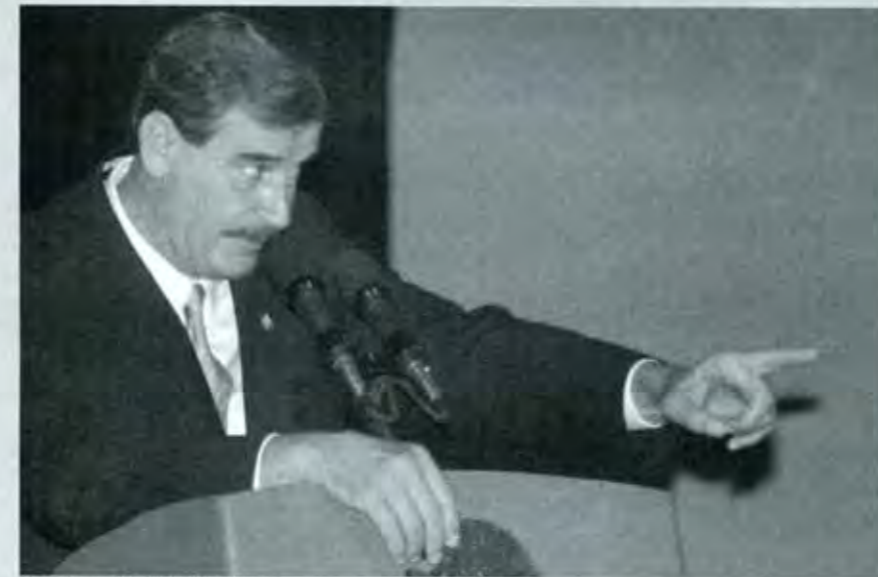
Un discurso con mensajes confusos.

Muchos medios y comentaristas especializados se han pronunciado en contra de la posición que nuestro embajador ante la ONU, seguramente por instrucciones del señor Presidente de la República que es el responsable de conducir la política