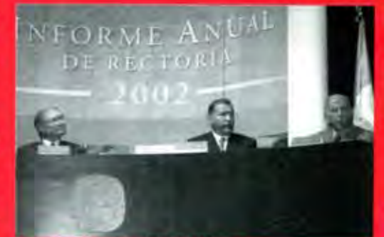
Finalmente, las cosas volvieron a la calma.