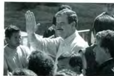
Muy activo en asuntos de campaña.

Con independencia de lo que diga el IFE, parece que el activismo presidencial de las últimas semanas no se detendrá hasta que las elecciones de julio hayan pasado, aunque afecte la equidad en el proceso electoral que antes, como candidato, el propio Vicente Fox le demandó a Ernesto Zedillo y a sus colaboradores cuando les exigió que no trabajaran en favor del PRI durante las elecciones, y categóricamente sentenció que no confiaba en ellos.