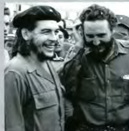
Los Ideales de la Revolución Cubana

El 19 de enero del presente, terminó en Cuba un periodo electoral más para elegir Delegados a las Asambleas Provinciales y Diputados a la Asamblea Nacional que registrarán los destinos de ese país por los próximos 5 años.