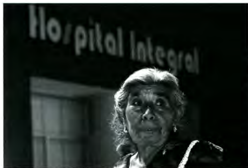
A ver si cumplen promesas de campaña

De nueva cuenta arrancan las candidaturas para la diputación federal por el catorceavo distrito con cabecera en Izúcar de Matamoros, otra vez nos veremos invadidos por una infinidad de propuestas, que convertidas en volantes, trípticos, posters y calcomanías, darán como resultado, unas calles tapizadas de colores verde, blanco, rojo, amarillo, azul y demás colores que se suman al arco iris de los políticos que intentarán a toda costa obtener las preferencias de los ciudadanos y por supuesto el anhelado voto que los lleve al triunfo.