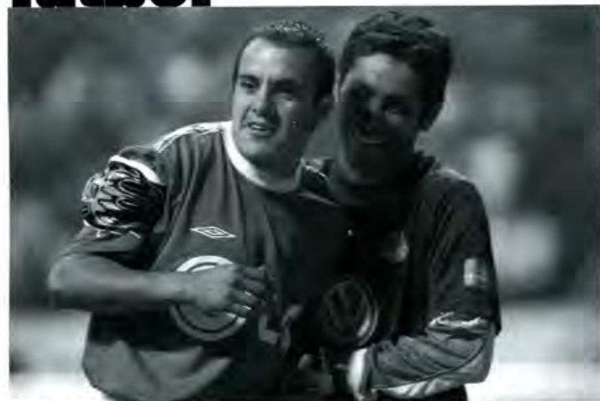
Al final, se trata de un juego

Pasión por mirar un clásico de fut, Pasión en los gritos (nunca mejor reflejados que el ahora celeberrimo comercial del hincha que grita desaforado reclamando la "expulsión"), pasión para convertirse en jugadores de una quimera, de un juego espléndido. Pasión en la cancha.