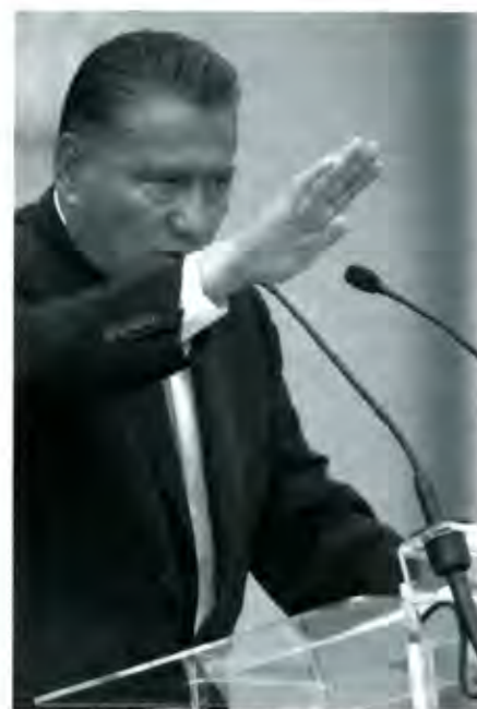
Los mensajes de Melquiades

¿Por qué el empeño de sostener imágenes artificiosas respecto a la realidad local? Es una pregunta que rondó a los medios. Algunos enfrentaron sus propios temores, y se atrevieron a llamar las cosas por su nombre. Otros, cuya línea editorial se ha mantenido en la independencia respecto al poder en turno, dijeron la verdad: los informes de gobierno que organizó Melquiades Morales fueron, en realidad, actos partidistas que refrendaron las premisas bajo las que operará el proyecto político del gobernador y, en consecuencia, la batalla cruenta y selectiva en la que se mueven las líneas del priísmo poblano.