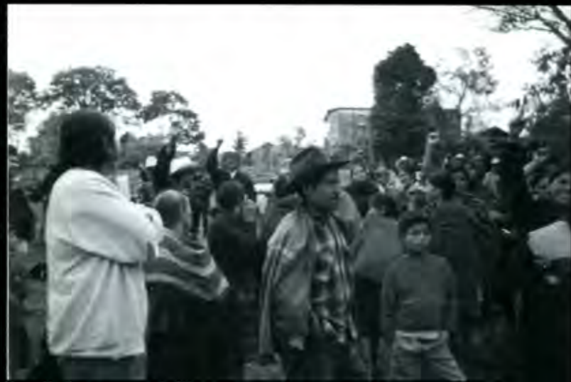
Una población convencida la de Chiconcuautla

Informaron que no obstante, de adquirir una ambulancia para el traslado de enfermos graves a los