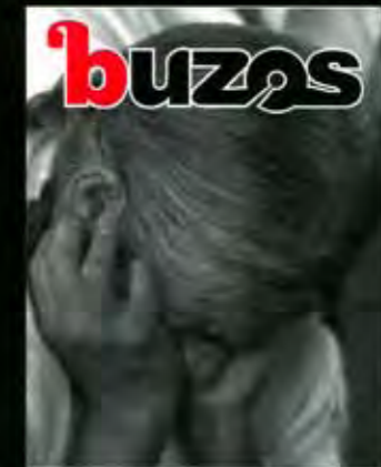
Portada: Matrix Photo