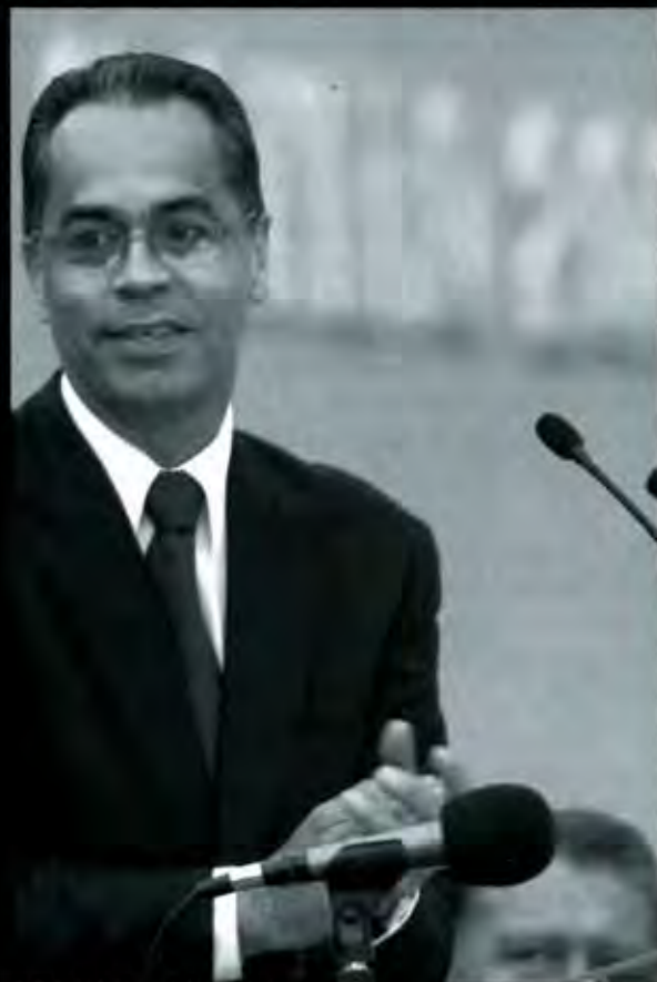
Bullición en la tierra de los Jiménez

C UATRO FUERON LOS GRANDES PROYECTOS que anunció para Huauchinango el gobernador Melquiades Morales Flores durante su segundo informe regional efectuado en esta cabecera municipal.