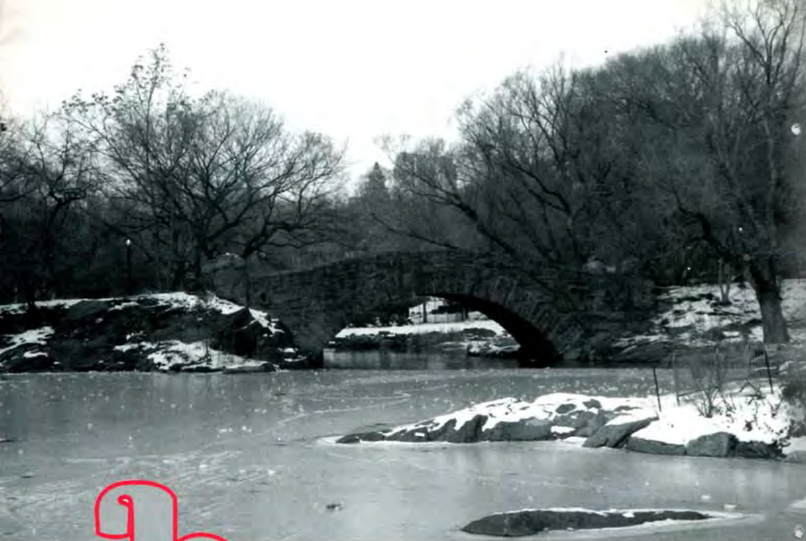
Poblanos visitarán tierras europeas para hacer negocios