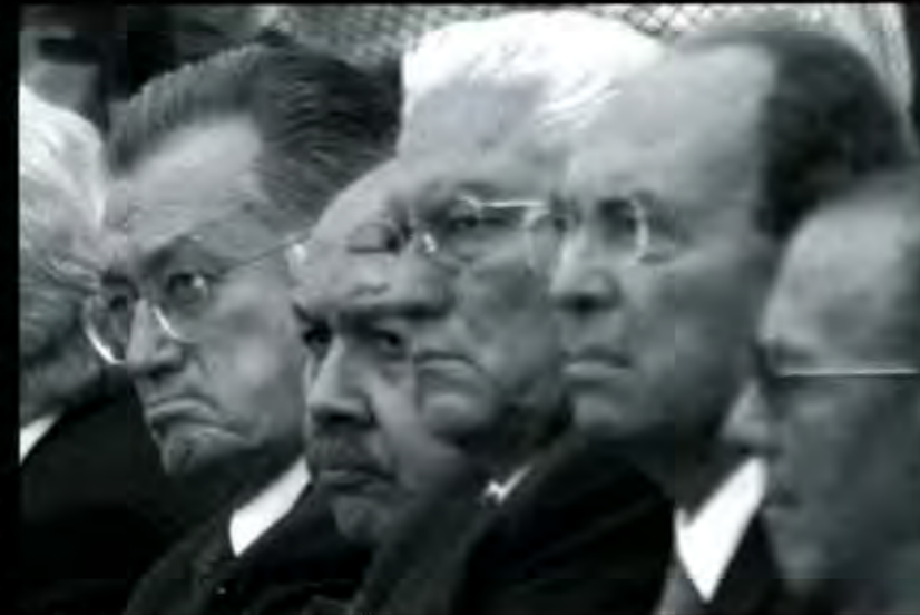
La vieja guardia y su resistencia a la consulta

Si hay o no elección interna, si finalmente se producen candidaturas de unidad, si la disciplina y la institucionalidad prevalecen sobre los ánimos de apertura, no hay duda que en lo general, el PRI saldría fortalecido, pese a los descabros y las bajas inevitables que sufra entre sus filas. Sin embargo, el PRI padece una ceguera escalofriante