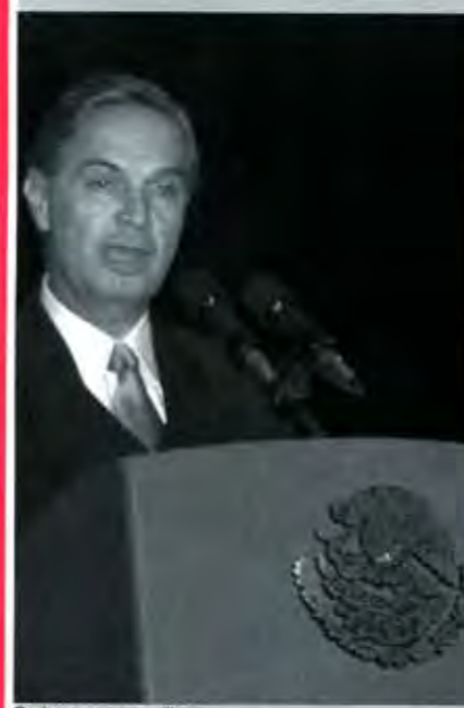
Derbez como canciller

Desde que arrancó el último tercio del año 2002, apoyados en la reflexión de unos cuantos analistas económicos enterados de los detalles del Tratado de Libre Comercio, en cuanto a plazos de desgravación, un grupo de organizaciones campesinas empezó a hablar de que la apertura total del sector agropecuario que operaría a partir del 1 de enero de 2003 sería la ruina del campo mexicano que, ahora sí, quedaría completamente indefenso ante la competencia desleal que le representan los modernizados, altamente tecnificados, pero además abundantemente