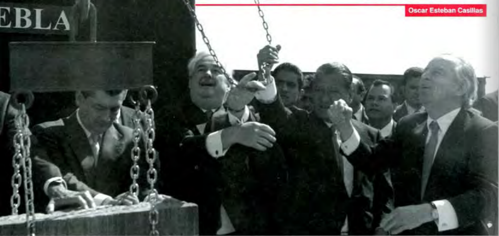
concesiones con futuro

Es el sueño del primer mundo. Los obreros que viven en el Pilar saben, por ejemplo, que sus viviendas -casas duplex de dos recámaras- tienen un valor adicional a, digamos, los departamentos de Loma Bella o La Margarita; “esto es Angelópolis. No importa que sean casas de interés social, vivimos en donde está el desarrollo”, dice un trabajador que en el Oxxo de la esquina compra la merienda.