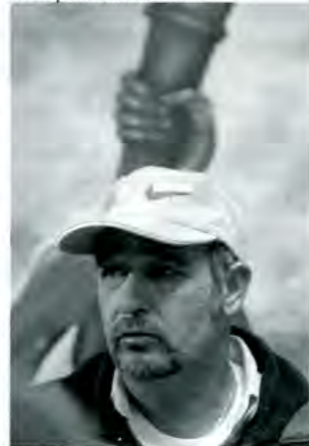
Célis: Un logro para Antorcha

Ahí mismo se refrendaron compromisos, se puntualizaron posiciones y se construyeron nuevos consensos. La simbólica reunión demostró también, para desdicha de sus detractores, que el Movimiento Antorchista es la agrupación popular más destacada que coexiste en Puebla. Y una lección de unión y humildad bastó para corroborarlo. ■