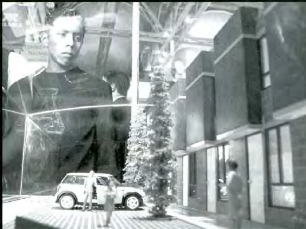
El sueño de la modernidad

lograron la protección de la justicia federal, la misma fue sólo temporal porque el siguiente gobierno, el de Piña Olaya, fue definitivo para concretar el despojo.