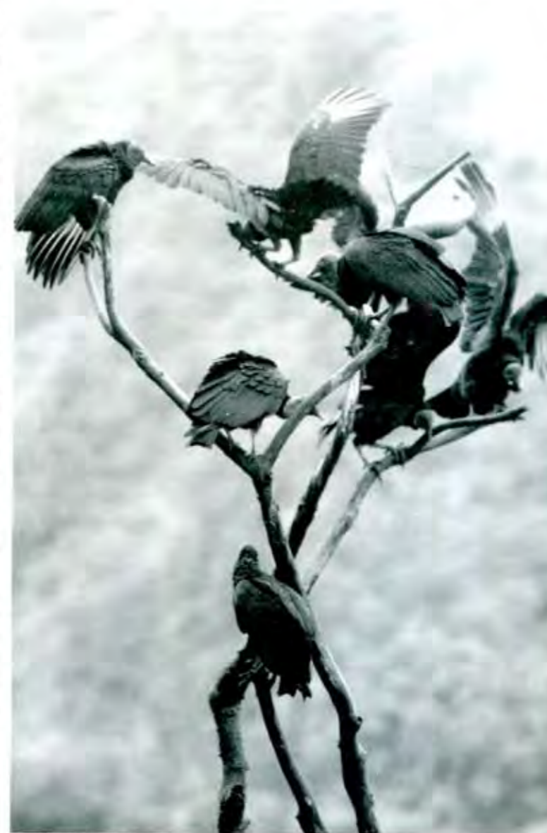
Como buitres al acecho

La respuesta a la clausura fue una manifestación y un plantón de profesores y estudiantes. Antes del 20 de noviembre, el gobierno del estado pidió a los maestros a través del subsecretario de gobierno Pedro Flota Alcocer levantar provisionalmente el plantón mientras se desarrollaban los festejos del aniversario de la