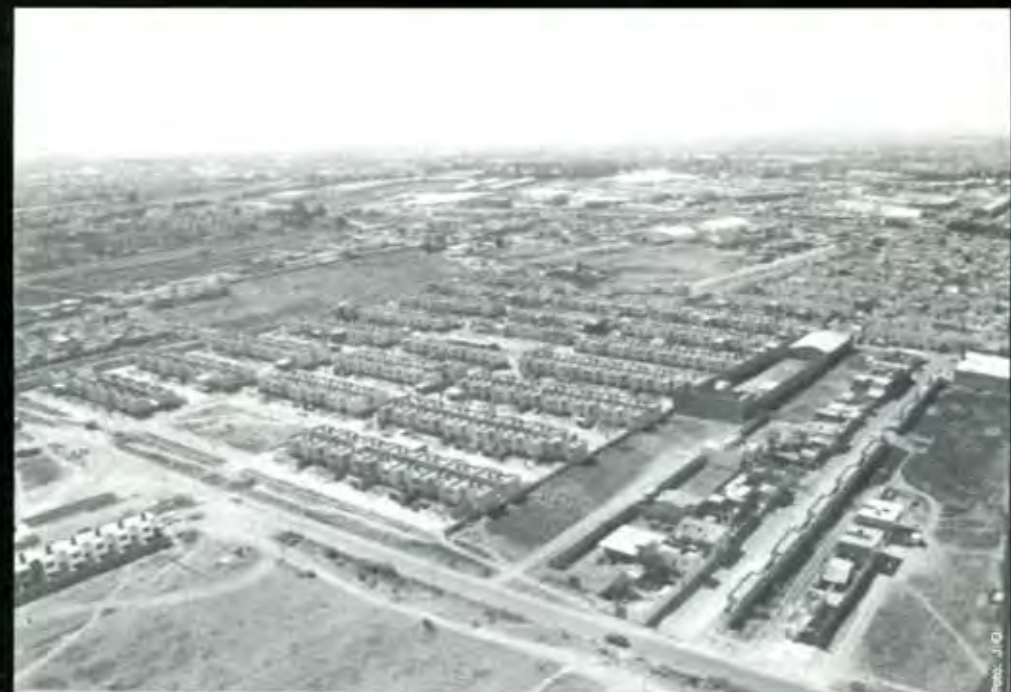
Los terrenos de Atlixcayotl

De este lado los viejos ejidatarios ven pasar sus últimos años, abandonados a su suerte, del otro, en las tierras ejidales expropiadas todo se ha transformado, los ricos, el gran capital ahí multiplica su dinero. ■