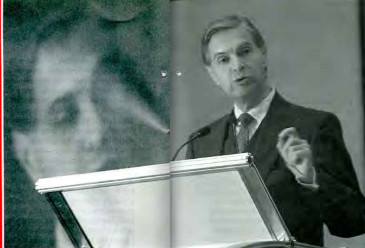
Los ajustes, decisión de Fox... y Derbez