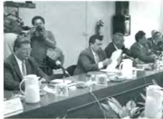
Los partidos se van de vacaciones

Y este ejemplo sirve para ilustrar la perspectiva del tecleador. El PRI tiene posibilidades reales -pese a la magnificación de su propio