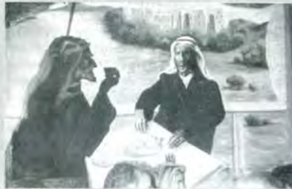
Murales de Bait Lajam

Para el día 17 de diciembre de este 2002, estaremos celebrando la inauguración de la sucursal número "NUEVE" de Bait Lajam ¡Jam Jam!-Corazón Contento.