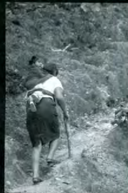
El voto en la sierra

UNA BUENA NOTICIA sin duda representa el anuncio que dio a conocer en su más reciente visita a nuestro estado el secretario de Comunicaciones y Transportes federal, Pedro Cerisola Weber, acerca de la aprobación de seis permisos para emisoras de radio y una de televisión para la entidad, de las cuales, dos radiodifusoras se establecerán en Huauchinango y Zacatlán, respectivamente. Las