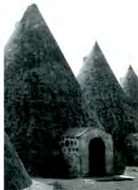
Silos vacíos: producto de la globalización

México D. F. a 10 de Diciembre de 2002 ■