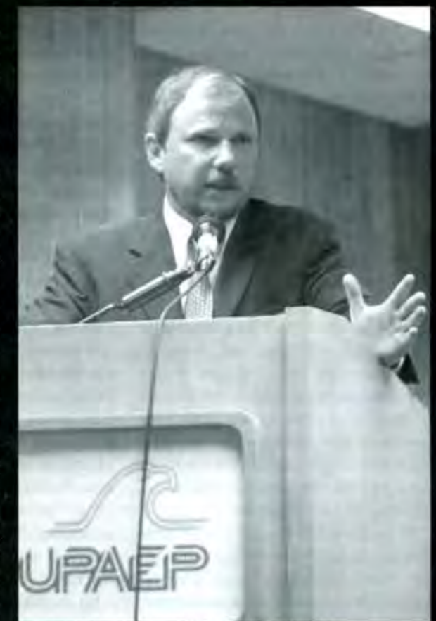
Las universidades privadas también requieren inversión pública

estipuladas. A partir de esta serie de cuestionamientos se buscará el mecanismo ideal para hacerse de recursos que satisfagan la realización de los proyectos e infraestructura que la misma institución necesita. Es a partir de esta serie de cuestionamientos en la que la relación entre Universidad y Estado alcanza su máxima armonía en aras de una mejor sociedad. Las universidades deben buscar nuevos mecanismos que le permitan allegarse de recursos, más allá de los que el Estado le proporcione, es una realidad. La descentralización o la plena realización de la Autonomía Universitaria, es el principal reto del sistema educativo en México y en Puebla en el tiempo de la mal llamada globalización. ¿O existe algo más de fondo en el entramado del juego político? Mientras tanto, viva la vida, muera la muerte, juegue la suerte, yo ya me voy...■