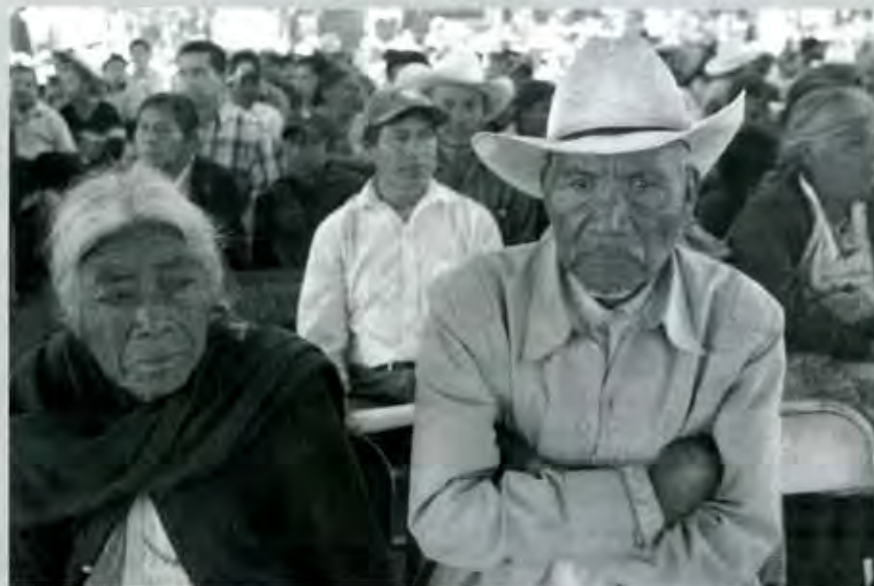
Las bases escepticas

En el lenguaje político se llama pluralismo a la concepción que propone como modelo una sociedad compuesta por muchos grupos o centros de poder, aun en conflictos entre ellos, a los cuales se les ha asignado la función de limitar, controlar, contrastar, e incluso de eliminar el centro de poder dominante históricamente identificado con el Estado. 1