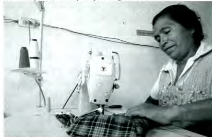
Escasas alternativas de empleo

El pueblo pide que se vayan todos esos políticos de Argentina y, la pregunta es ¿quiénes vendrán? ¿Vendrá el Prometeo de Treveris? Mucho le ha costado al pueblo su tardanza. Y, a los partidos, ¿cuánto les costará su ingratitud? ■