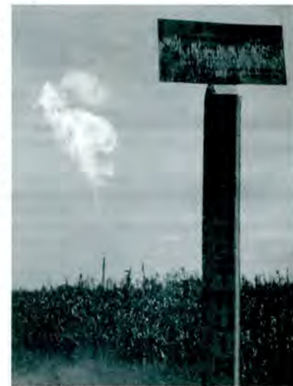
¿Cumple PEMEX las normas de protección ambiental?

Por si a usted, estimado lector, este caso pudiera parecerle muy ajeno a nuestra vida cotidiana, piense sólo en nuestra realidad diaria, donde con mucha frecuencia vemos cómo frecuentemente se accidentan autobuses de pasajeros o microbuses viejos y en muy mal estado, sobre todo los de segunda y tercera clase donde viajan los más pobres, esto debido a que muchas empresas transportistas buscan evitar los costos que implica la renovación y el apropiado mantenimiento de las unidades y debido también a que con frecuencia muchos funcionarios no muestran mayor interés en corregir el problema. ■