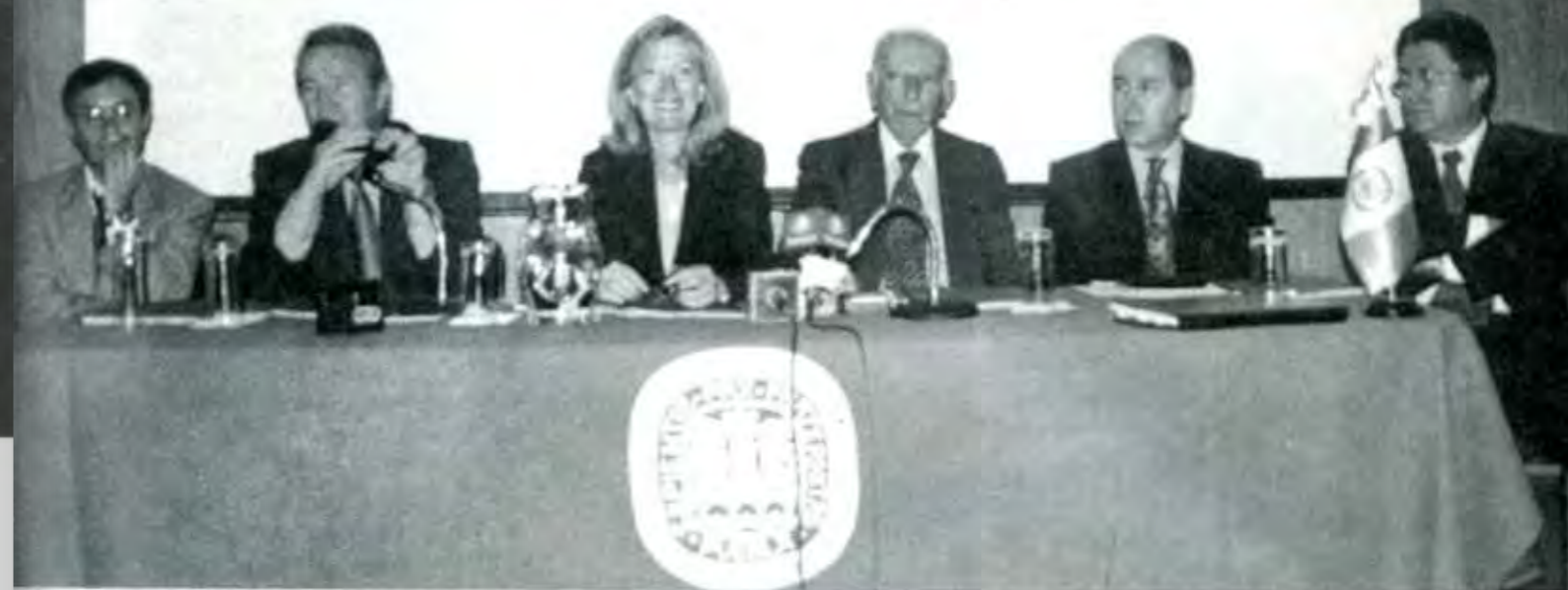
Los convidados a la mesa del patronato