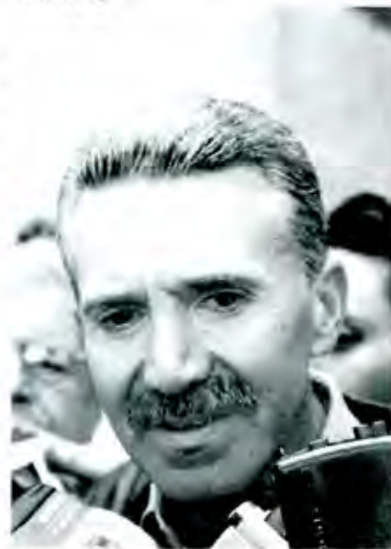
Los puso en su lugar

La democracia tiene sus riesgos y tanto el dirigente nacional priista, como el gobernador del Estado, lo saben y según expresaron, están dispuestos a asumírselos, pero los militantes también deben entender que en esta nueva poca de su partido, ser el trabajo, el esfuerzo de cada cual, el que les de la fuerza necesaria para asumir responsabilidades. Los tiempos felices en los que bastaba la voluntad omnimoda de un poderoso para hacer de un don nadie un personaje de la política, se acabaron. El trabajo partidista, el prestigio entre la ciudadanía, la sensibilidad política y social, serán los que se tomen en cuenta en el futuro, para que alguien pueda llegar a una candidatura o a una dirigencia y la decisión ser de las bases y no de "arriba".