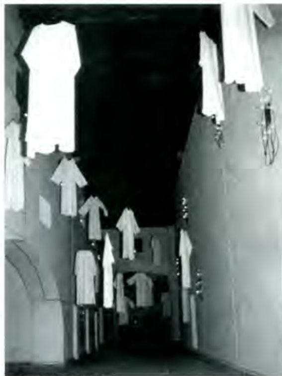
Lo más destacado del FIP

Cristian Boltanski nació en Francia hacia 1944 y es considerado uno de los artistas minimalistas más destacados del mundo. ■