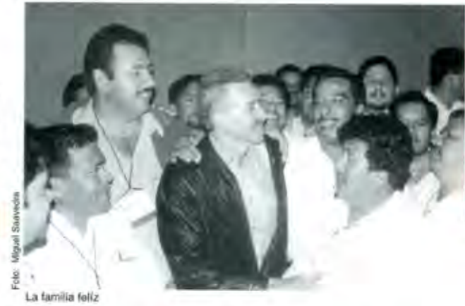
La familia feliz