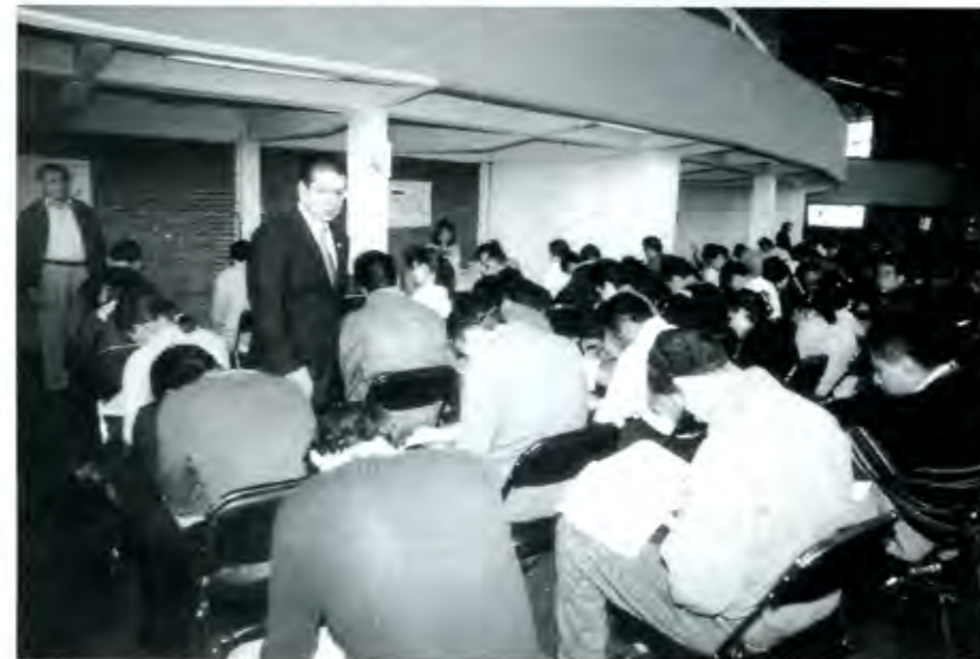
Doger tendrá que regresar a la política universitaria

¿Afectará en algo que una macrouniversidad llegue a territorio poblanos?, ¿cuántos empleos generará el Tec para los poblanos, aparte del que seguramente tendrán los hábiles alarifes locales? (no creo que en términos de calidad total los regios importen a los maestros de otro lado) Pues eso no parece quitarles el sueño a los dueños de la UDLA, que se prepara, insiste la rectora Nora Lustig, para ser una de las mejores universidades del mundo civilizado. Seguiremos buceando... ■