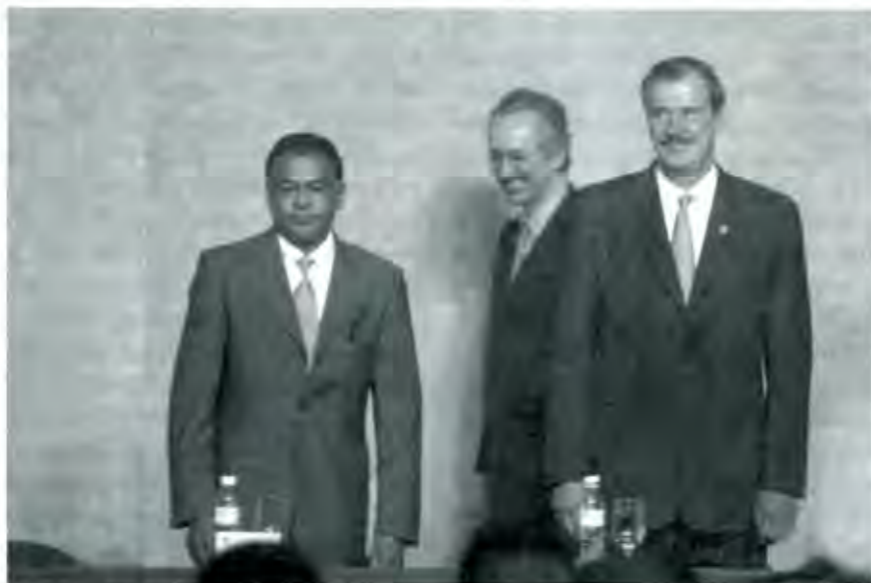
Gil Díaz y Fox: más recortes

Existe una serie de contradicciones en el Estado mexicano que tiene que ver con las decisiones que se están tomando con respecto a la educación superior pública; el Estado es el que invierte en educación y es el que menos se interesa por las siguientes situaciones: a) No da empleo calificado a los egresados de la educación superior, b) no aprovecha los resultados de investigación tanto en ciencias sociales, naturales y aplicadas en los diferentes programas de gobierno como por ejemplo la obra pública y no aprovecha la infinidad de proyectos en