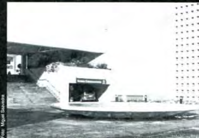
El estilo de Brito fue fundamental para el Centro de Convenciones

Por lo pronto solo hay que recomendar al diversificado mercado ¡compre en Puebla! Porque al menos se fortalecerán las fuentes de empleo de los poblanos, que en algo influirán con sus salarios para mejorar las posibilidades de la microeconomía. ■