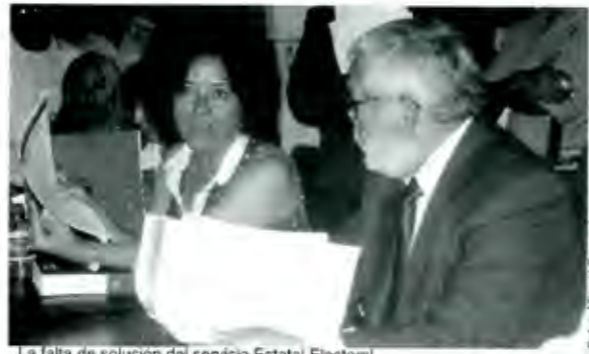
La falta de solución del servicio Estatal Electoral

Lo curioso es que el Servicio Electoral contó todos los votos de la planilla dos, excepto las catorce de