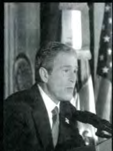
Bush, la política exterior con una nueva filosofía en mercado

Lo anterior pasa obligatoriamente por la experiencia que México ha tenido en los diversos capítulos del TLCAN, donde no ha salido librado y en mucho se ha enfrentado a conflictos que le ha sido desfavorables, como la negociación del sector agrícola que se avecina para el año 2003. ■