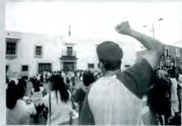
Los maestros protestan

En particular los maestros, dicen y afirman a quien quiera oírlos que, en el cien por ciento de este tipo de casos, la determinación está tomada de ante-