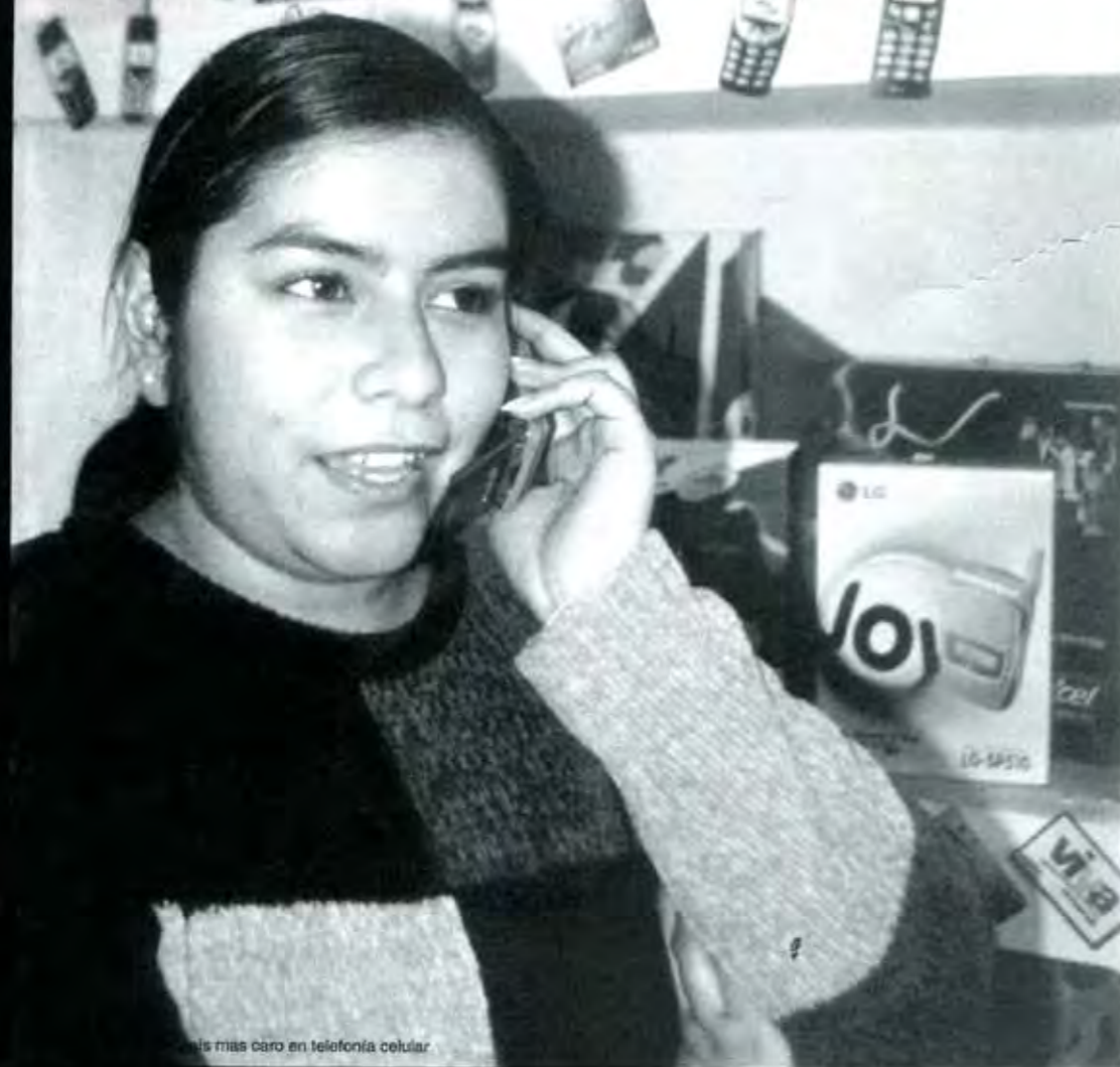
El más caro en telefonía celular