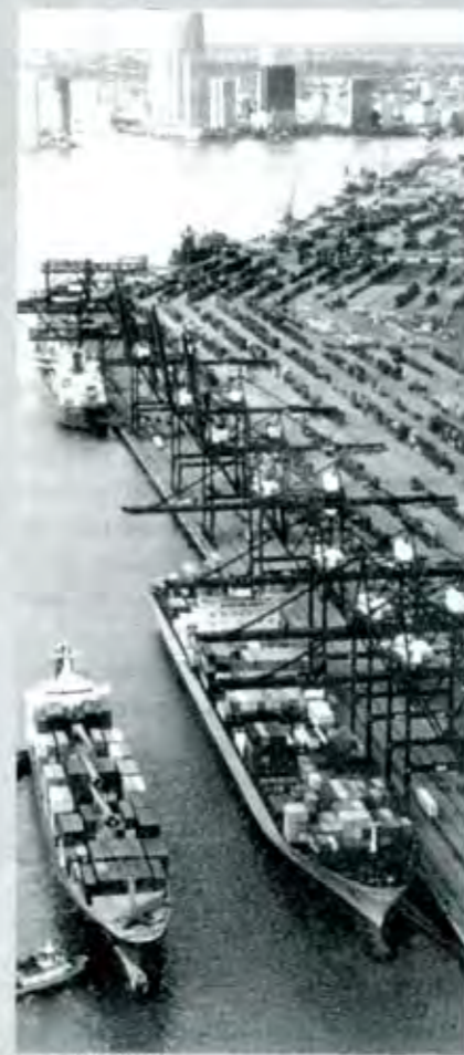
La ruta del comercio

Los temas por demás relevantes que se negocian y negociarán en el ALCA