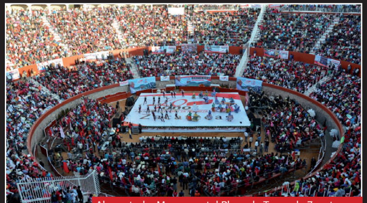
Abarrotada. Monumental Plaza de Toros de Zacatecas.