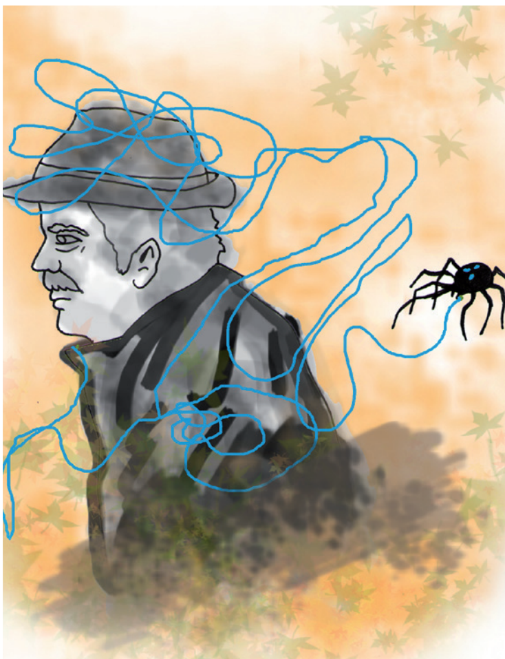
Ilustración: Carlos Mejía

gas Llosa es un personaje social y político absolutamente diferente al que en el pasado escribió La ciudad y los perros (1962), La casa verde (1965), Conversión en La Catedral , Pantaleón y las visitadoras , La tía Julia y el escribidor y La