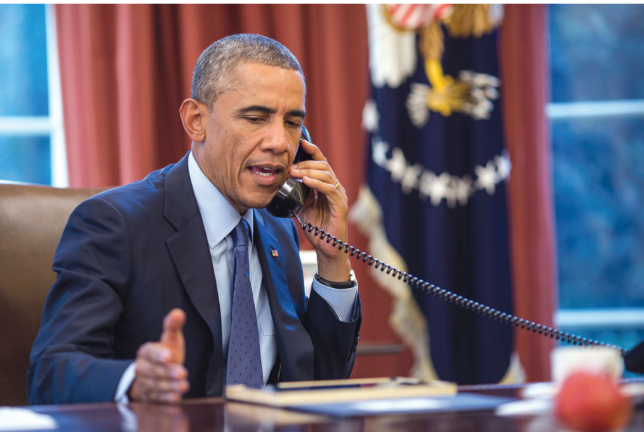
Contrasentido. Imperialismo norteamericano contra la opinión de más de 50 por ciento de estadounidenses que piden que se levante el bloqueo.