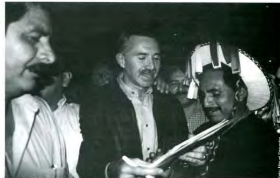
Para el PRI, los votos de donde vengan

Hace apenas unos días, los presidentes municipales que le deben al PRI su lealtad institucional, acudieron a Puebla y escucharon a su dirigente, Roberto Madrazo. No hubo reclamos para su perversa secretaria general, Elba Esther Gordillo, ni se desgarraron las vestiduras para expresar su frustración por el retraso y los recortes en materia presupuestal. Por el contrario, la reunión de San Francisco tuvo más bien un tinte federalista, si compartimos la visión del político tabasqueño: "Hay que lograr una nueva mayoría en el Congreso, pero no