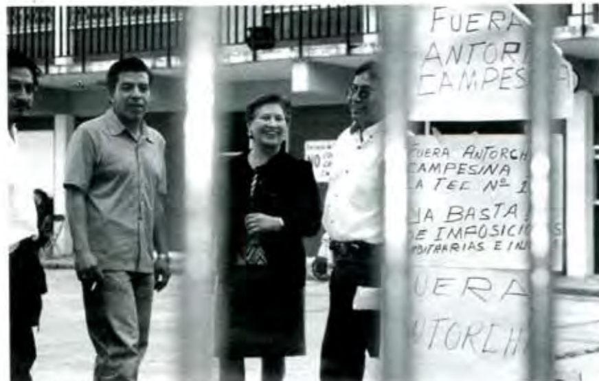
El injusto motivo del conflicto

de enseñanza, ya que las actividades que ahí se realizan son independientes a la de la escuela, por lo que resulta innecesaria su presencia.