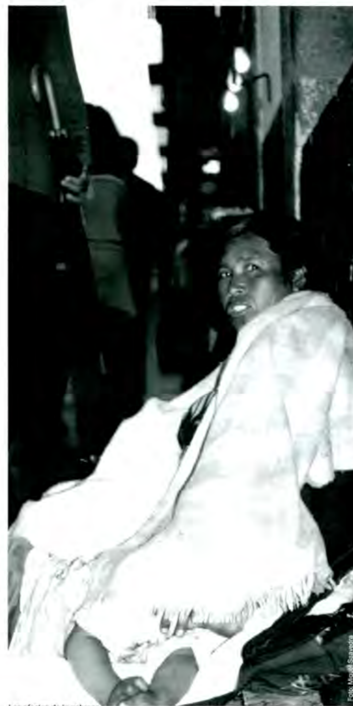
Los efectos de la pobreza

Aunado al problema formal de regularización de los derechos de propiedad, digamos de diseño institucional, tenemos también la mala calidad en el funcionamiento de las instituciones, misma que está sobrepolitizada, lo que hace que los conflictos frecuentemente no se resuelven en estricto apego a derecho, sino en función de la influencia política de las partes involucradas, donde regularmente minifundistas y ejidatarios van en desventaja. Así, para proteger su cargo, los gobernantes frecuentemente evitan o posponen la decisión que corresponde a derecho, pro-