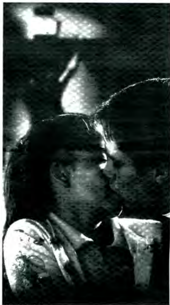
terribles en 24/s

EL CRIMEN DEL PADRE AMARO puede ser solo una muestra de la revolución que se avecina. ■