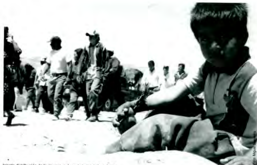
Injusta distribución de la riqueza y el crecimiento de la pobreza

1 (Milenio Diario, página 4, 17 de agosto de 2002)