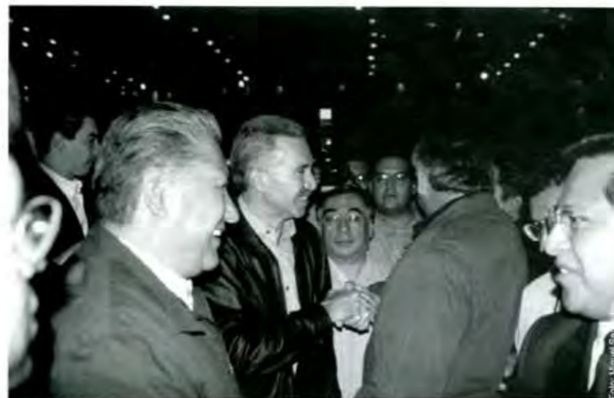
La necesidad de buscar alianzas

Con diferencias numéricas apenas perceptibles, PRI y PAN representan casi el 80% del cuerpo legislativo en la LVIII legislatura. En el Senado, el PRI