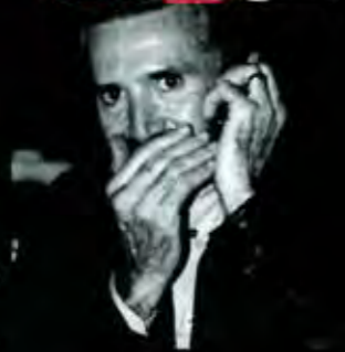
En portada: Roberto Madrazo