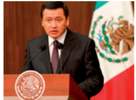
Miguel Ángel Osorio Chong, titular de la Secretaría de Gobernación.

No suplantamos a Fausto Vallejo: Osorio Chong “No estamos, por supuesto, suplantando facultades, es colaboración. Nos pide el apoyo el Gobierno del estado y se lo damos pleno”.