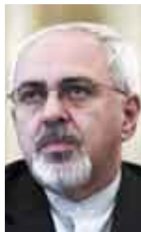
Javad Zarif, ministro de Asuntos Exteriores de Irán

La negociación "va en la dirección correcta para restaurar la confianza con quienes sospechaban de que nuestras actividades nucleares pudiesen tener fines militares. Es un primer paso, debemos seguir trabajando sobre una base de igualdad y respeto mutuo".