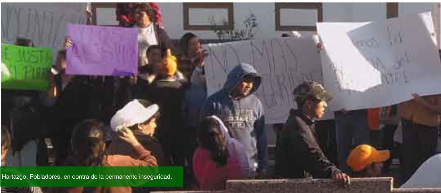
Hartazgo. Pobladores, en contra de la permanente inseguridad.

Sin una respuesta de la policía local, con la rabia añeja a cuestras incubada por la “corrupción” del alcalde emanado del Partido Verde Ecologista de México (PVEM), la ausencia de obras y gobernabilidad, así como el dolor aún en la población por el asesinato de Angélica Mendoza, una marabunta de más de 500 personas se lanzó en avalancha contra el Palacio Municipal, la casa y