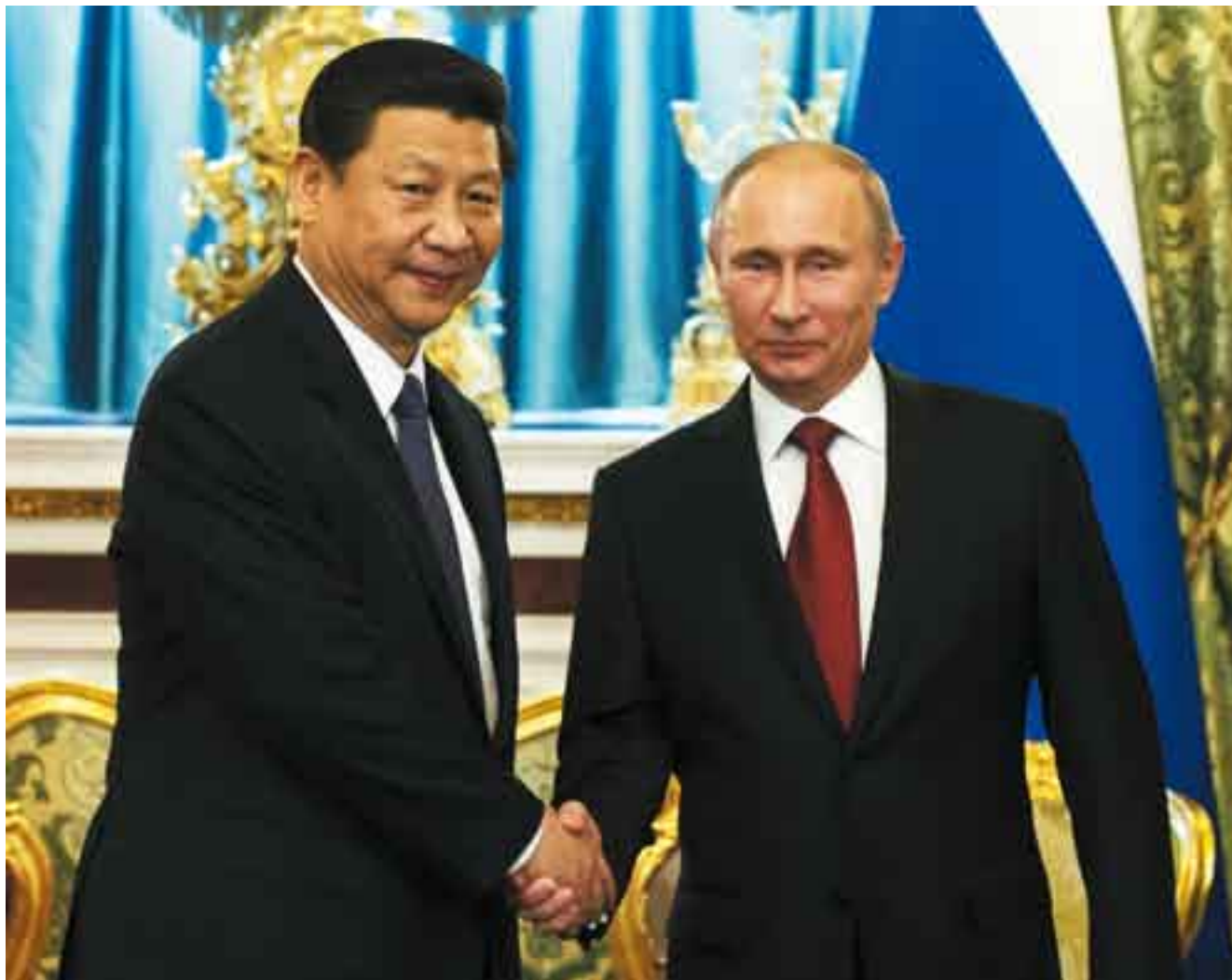
Dos liderazgos indiscutibles a la cabeza de Asia. Xi Jinping, presidente chino, y Vladimir Putin, presidente ruso.

➤ Otro foco de tensi3n se mantiene en los dos estados de la Pennsula Coreana, y aumenta cada vez que Estados Unidos y Surcorea realizan maniobras, ya que Norcorea las califica de “ensayos de agresi3n”. En la primavera la crisis se agudiz3 por el despliegue estadounidense de buques de guerra, aviones de combate, dos destructores con sistemas antibalsticos, as como la poderosa plataforma martima autopropulsada SBX-1 , con radares antimisiles, y miles de tropas en esos simulacros.