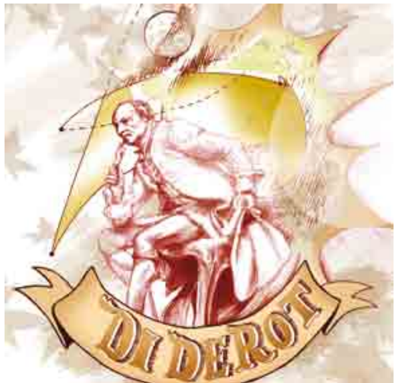
Ilustración: Carlos Mejía

Ahí completó su formación universalista que habría de llevarlo al materialismo, a la visualización de un humanismo fincado en el igualitarismo social y político, a la denuncia de la propiedad privada individualista como fórmula de negación de la equidad, del atrabiliario colonialismo europeo y del esclavismo. En 1772 Diderot escribió: "La verdadera noción de propiedad implica el derecho de uso y abuso. Jamás un hombre puede ser la propiedad de un soberano, un hijo propiedad de un padre, una mujer propiedad del marido, un criado propiedad de un