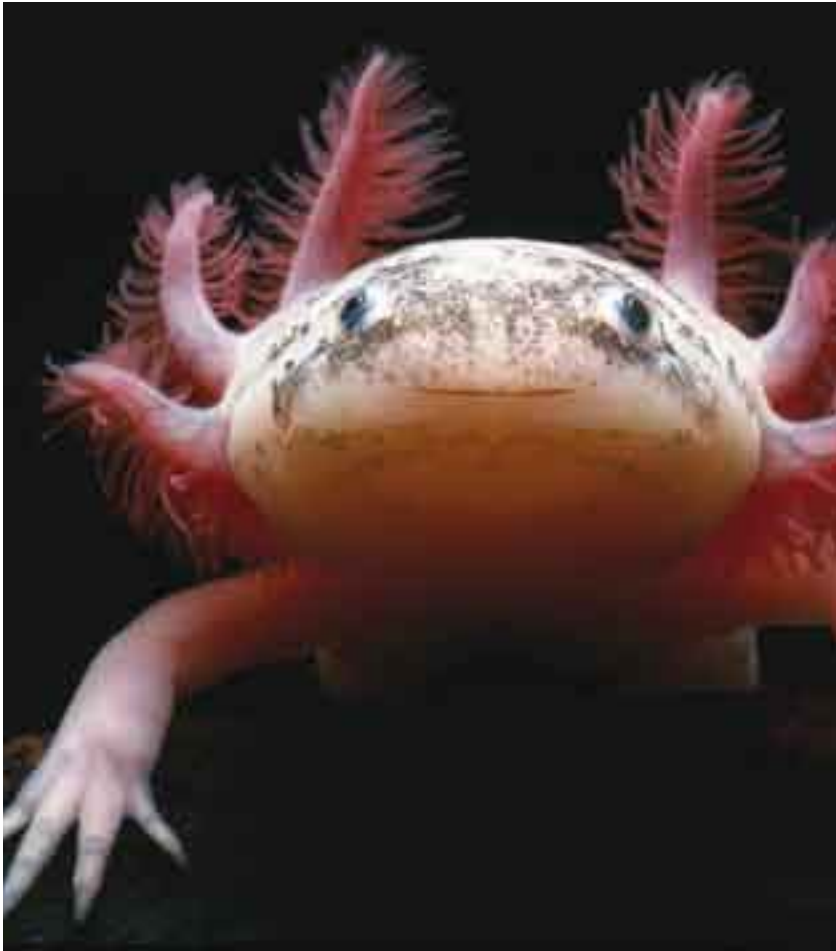
Valle de México