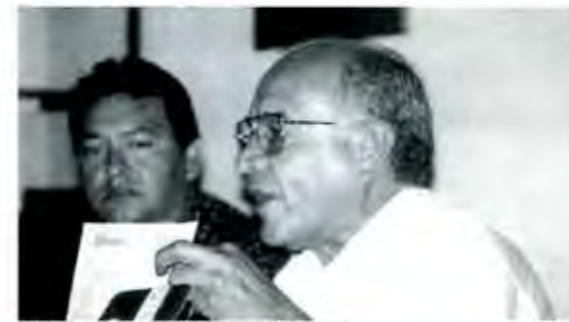
Acudiremos a las instancias que sean necesarias

A todas las instancias que las leyes de este país no nos prohíban pues consideramos nuestro deber ciudadano denunciar este tipo de imposiciones tan burdas de parte de nuestras autoridades y defender nuestros derechos en materia electoral y política, se oponga quien se oponga. ■