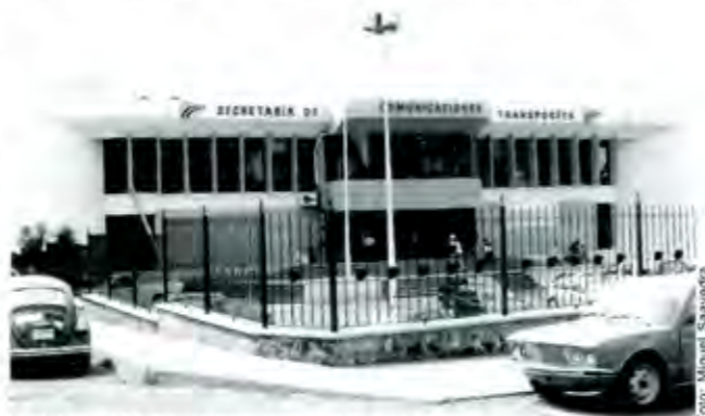
La SCT otorgó 5 de las seis concesiones solicitadas en Chiautla

Agregó que mediante el fideicomiso será posible por una parte eliminar las combis y meter microbuses y camiones, así como actualizar éstos últimos. ■