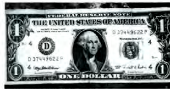
El dólar rebasa la barrera de los diez pesos

El empleo y las exportaciones no se recuperan y el crecimiento esperado para este año según los pronósticos serios más optimistas no llega al dos por ciento, bastante lejos de aquel fantástico 7% prometido. Además, aunque el déficit fiscal autorizado es de 0.65%, hay analistas que insisten en que debido a los "pasivos ocultos", éste puede