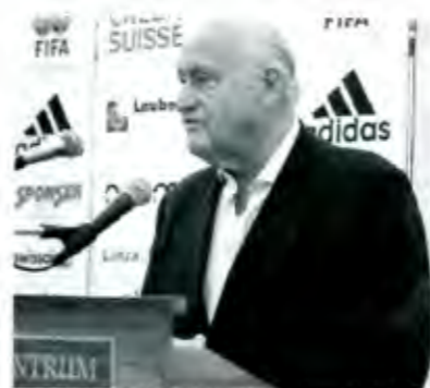
Joao Havelange, da término a una gran época del fútbol en el mundial de Francia 98