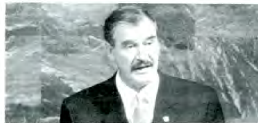
El Presidente niega la obvia devaluación del peso en un intento por detenerla...

El miércoles 19 del presente, el Secretario de Hacienda, Lic. Francisco Gil Díaz, declaró en su comparecencia ante legisladores que no era conveniente que México siguiera por el camino de balancear el presupuesto federal con la venta de activos, como sucede este año; porque eso fue lo que hizo Argentina y cuando su gobierno se quedó sin qué vender, el abultado déficit público, que nunca se corrigió, condujo a ese país a un creciente endeudamiento que acabó en el desastre. Enseguida de estas declaraciones, vinieron las del señor presidente de la República, Lic. Vicente Fox, que enterado, al parecer a bulto, de lo dicho por Gil Díaz, dijo que la situación de México no se parecía en nada a la de Argentina y citó los signos que indican la buena marcha de la economía, como los bajos niveles de inflación y de las tasas de interés, por lo que, aseguró, la recuperación del crecimiento económico estaba a la vista.