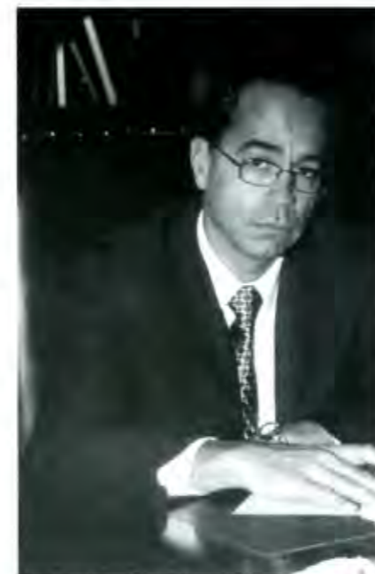
El Diputado Víctor Manuel Giorgana

¿Qué opina de la consulta ciudadana que se realizará en el próximo domingo en la zona del conflicto?