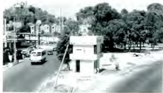
¿La Corte o el Plebiscito?