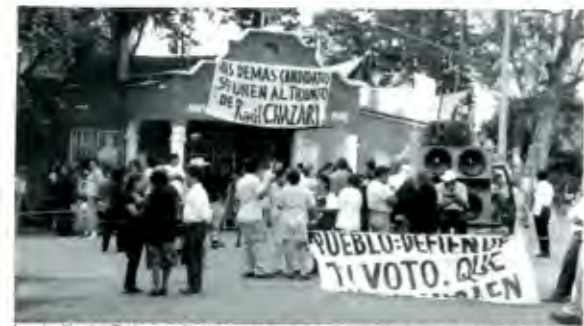
La planilla del "Triángulo Café" no se quitará hasta no tener una respuesta favorable