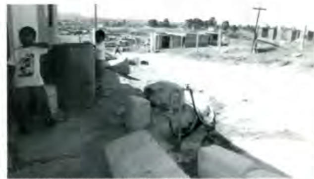
Al sur de la ciudad no existe un ambiente de agitación