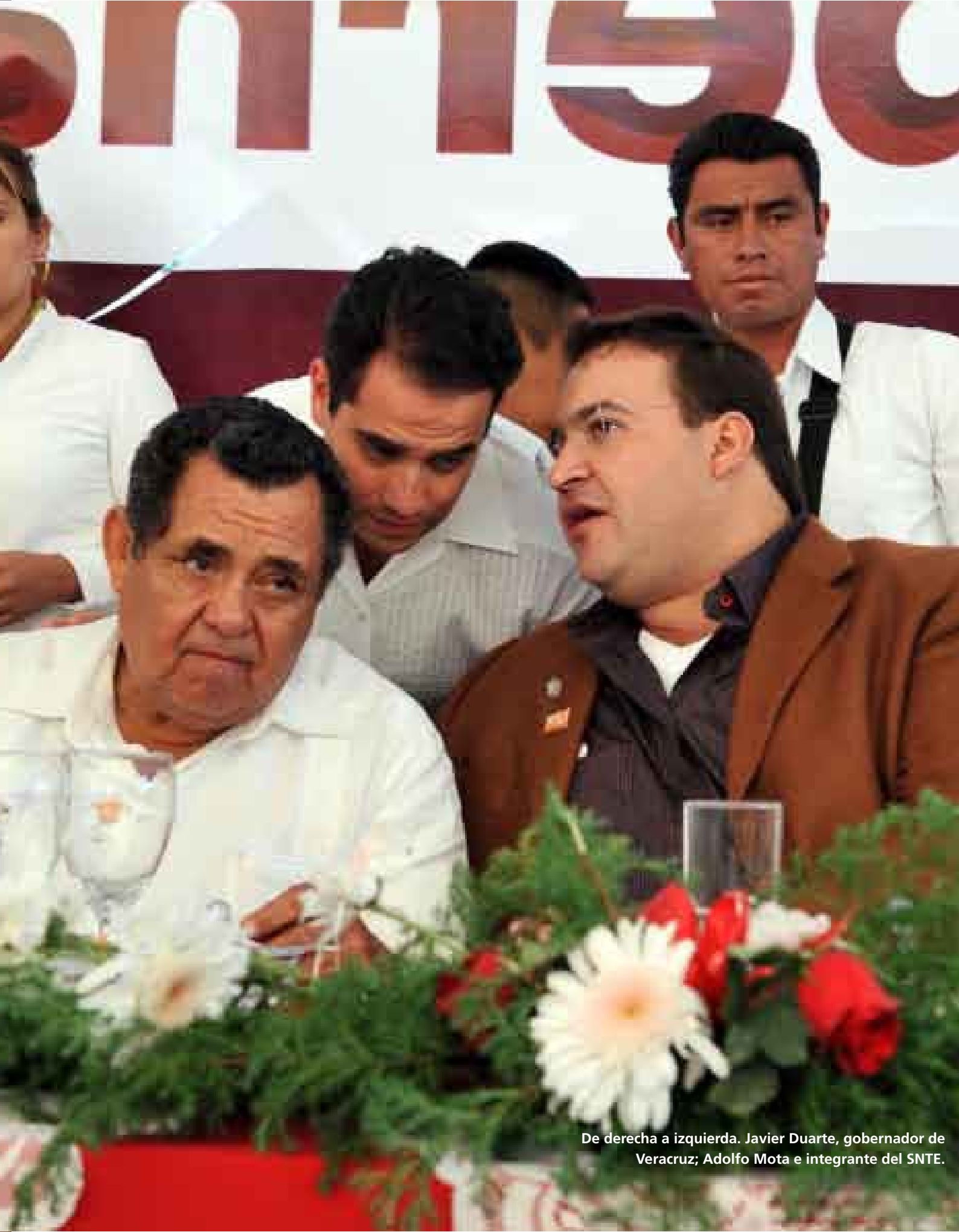
De derecha a izquierda. Javier Duarte, gobernador de Veracruz; Adolfo Mota e integrante del SNTE.