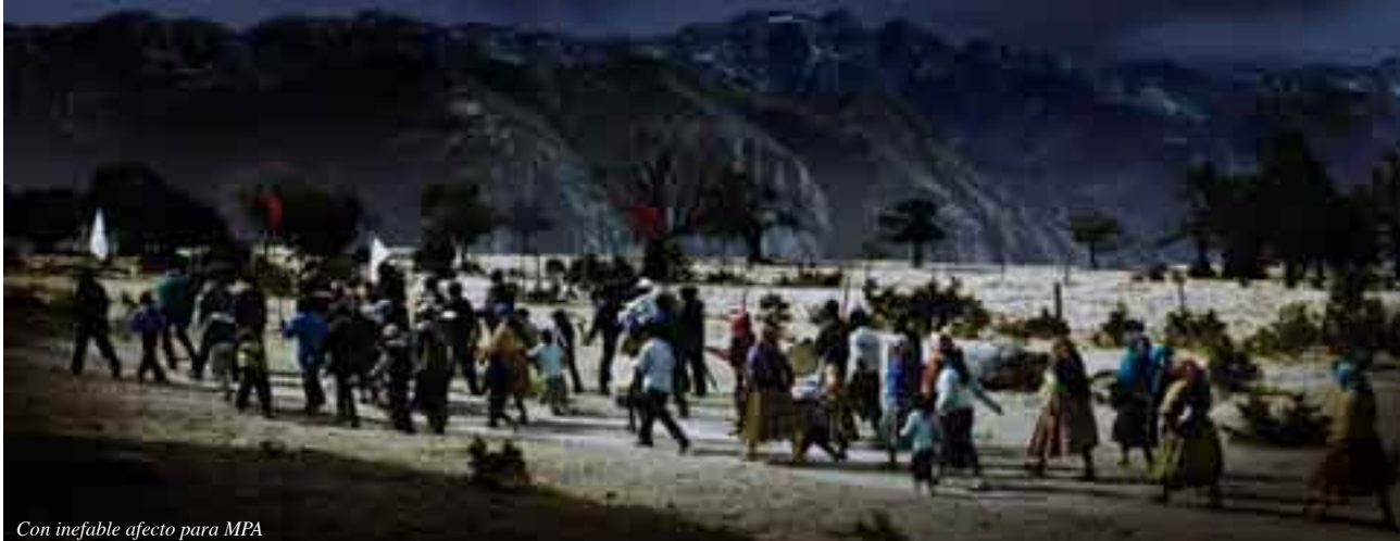
Con inefable afecto para MPA