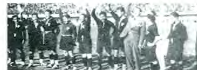
Selección mexicana que participó en el mundial de Uruguay 1930