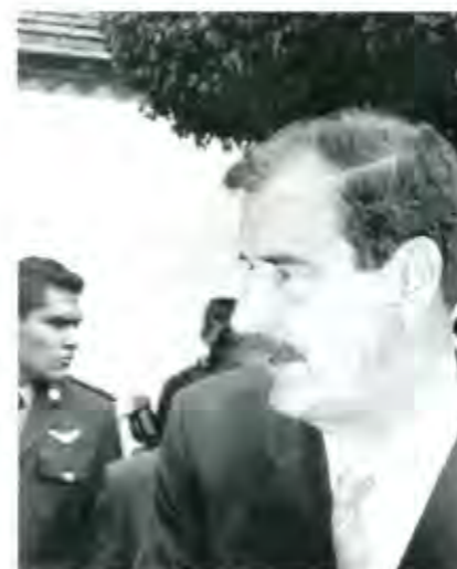
De nada sirvió el exhorto de los legisladores, ni el cabildeo con los gobernadores