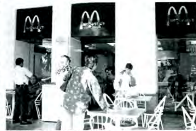
Se anunció la apertura de más establecimientos

Y todavía más, se espera que simbolicen el parteaguas para una mejor etapa para los poblanos. ■