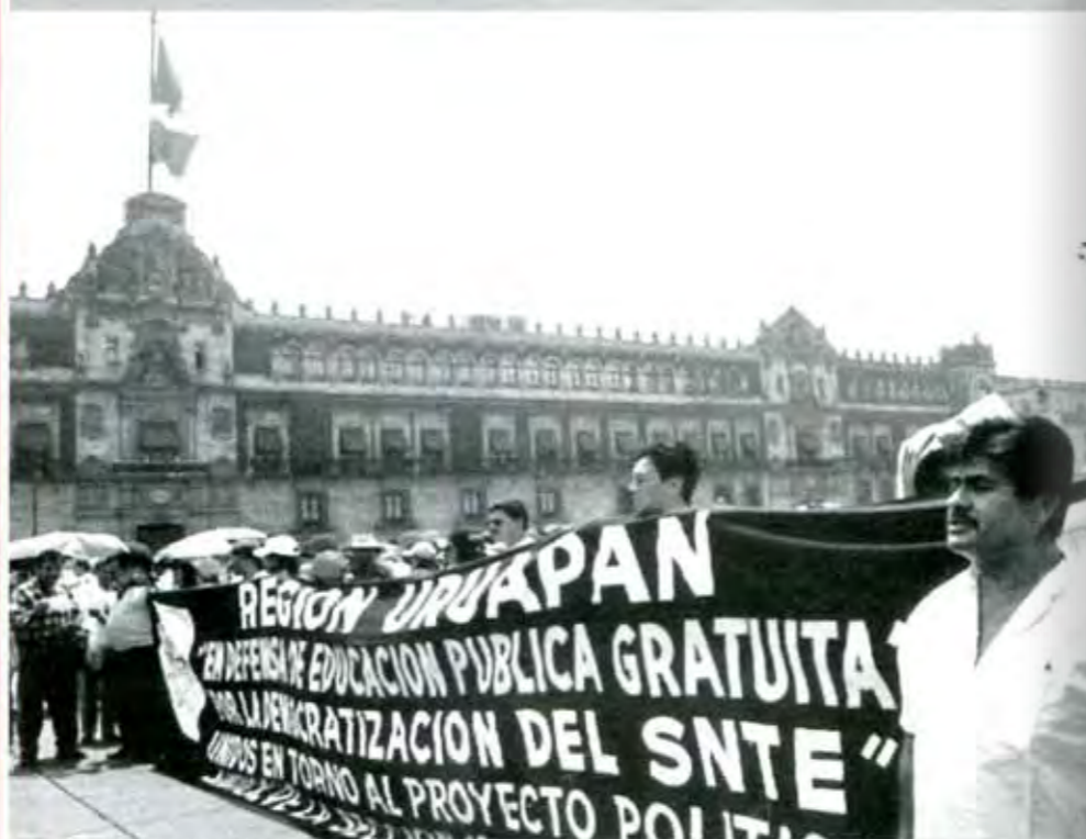
Fox nos mitió al prometer el 8% para educación

En nuestra anterior colaboración hablamos de los resultados que se obtuvieron en la realización del pleno sindical de evaluación, hoy quisiéramos hablar de cómo se desarrolla la política educativa en el Estado con la participación y consentimiento de los dos actores principales, la SEP y el SNTE... Ambos organismos a pesar de los declaraciones que comúnmente realizan, lo que menos hacen es trabajar por solucionar los problemas del ámbito educativo.