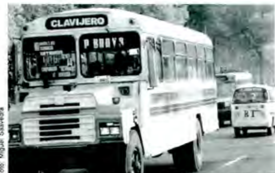
Para lograr la modernización del transporte se requiere la organización de los transportistas

Comentó que necesariamente la situación económica por la que pasa el país