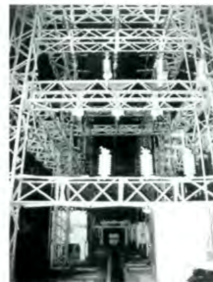
El riesgo sobre la privatización eléctrica