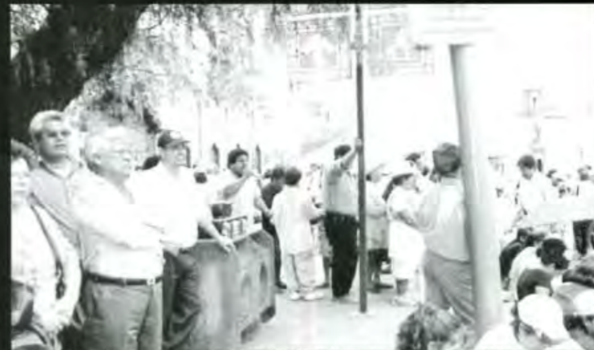
Por medio del micrófono la protesta tiene como propósito exigir al gobierno respuesta a todas las peticiones

-Varios de los oradores en el plantón exigieron que en la Secretaría de Comunicaciones y Transportes se den respuestas de manera inmediata a peticiones como la instalación de teléfonos en comunidades rurales con más de 1500 habitantes que ya han sido solicitados con mucha anticipación,