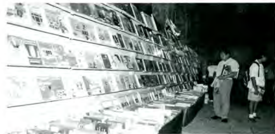
La feria anual del libro