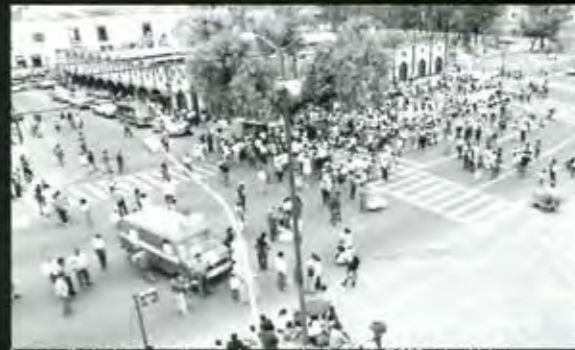
Los manifestantes prometieron volver con al rededor de 7,000 antorchistas...