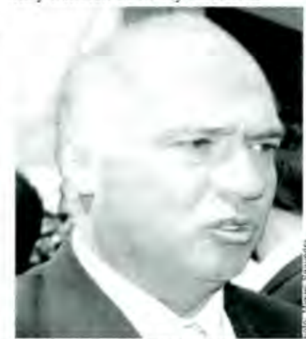
El partido está realizando una transformación

La entrevista se dio, posterior a una reunión en Izúcar de Matamoros, donde el legislador de la Cámara alta, rindió un informe a los ahí presentes del trabajo legislativo que viene realizando en el Senado de la República, donde habló de los temas que a la mixteca le afectan como son: el problema de la alta fructuosa para los cañeros, el tema sobre migración, acerca de los envíos de divisas, del problema de comercialización del cacahuate que se produce en la mixteca por la entrada de este producto de China y también de la ley forestal. ■