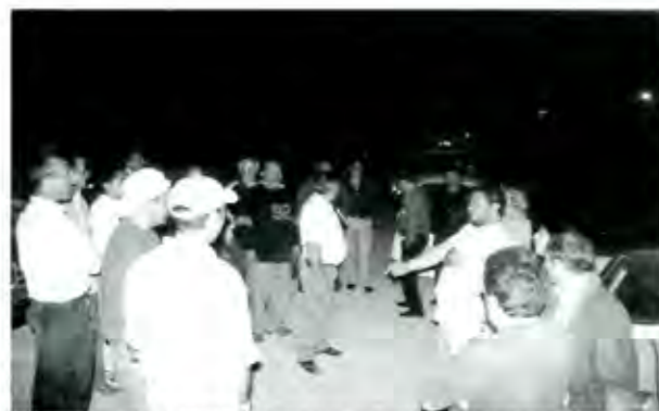
La batería pesada del Ayuntamiento en contra de la planilla Estrella Azul