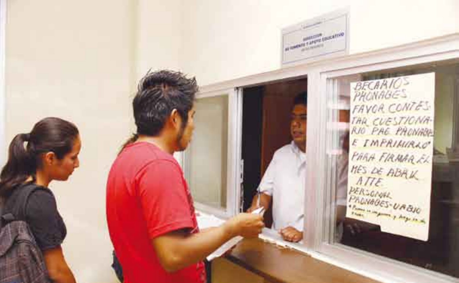
Muchos programas de apoyo a estudiantes, poco difundidos.

se refiere a la manera de asignar sus limitados recursos”.