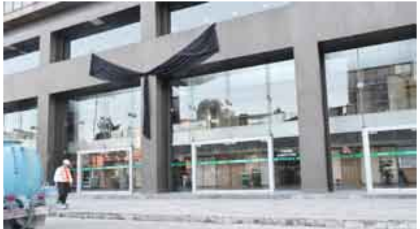
Pemex. Luto nacional.

Los casi 10 mil trabajadores que laboran en el complejo de Pemex fueron convocados el miércoles de la semana anterior para que re-