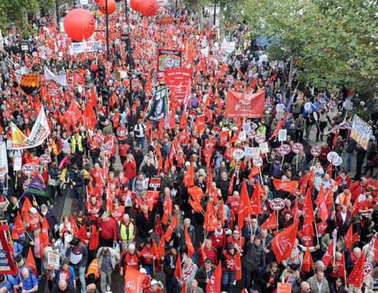
El pueblo europeo contra las políticas de los recién nombrados Nobel de la Paz 2012.

bién los polacos valoran su futura pertenencia a la Eurozona: una encuesta (en agosto de 2012) mostró que el 60 por ciento no quieren al euro y sólo 12 por ciento están por pertenecer al bloque; algo parecido ocurre en Eslovaquia, con una economía más frágil que la griega, adonde el optimismo hacia la UE y sus instituciones era muy alto antes de la crisis y disminuyó en 22 por ciento, según el Eurobarómetro de marzo de 2012.