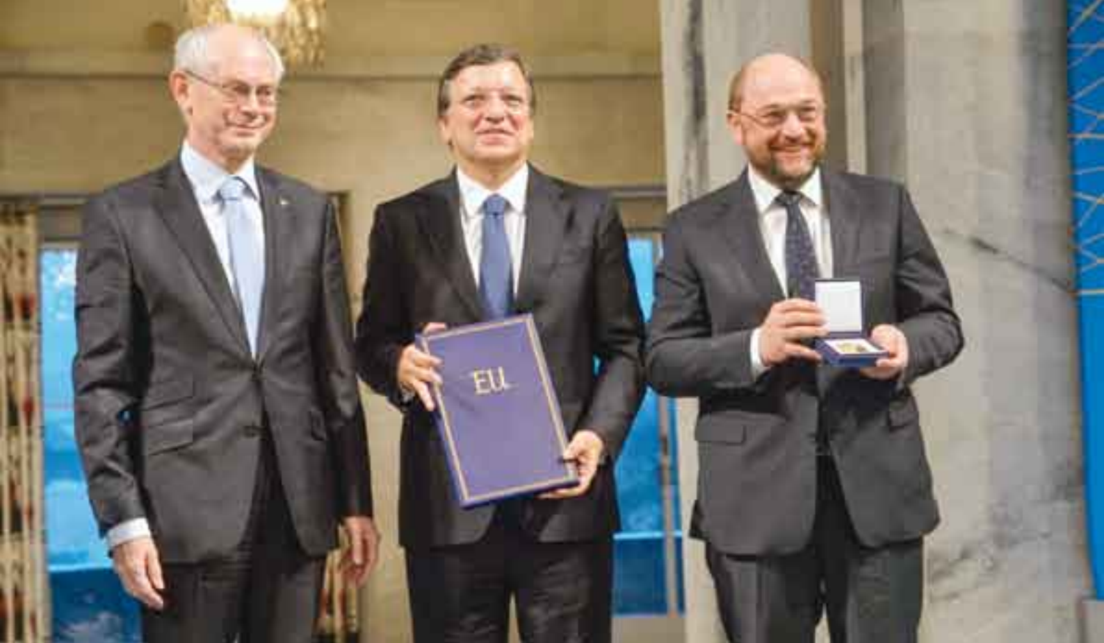
Premio Nobel de la Paz 2012. Campeón de un bloque dividido y en crisis.

ni hay asomo de crecimiento y su sistema de protección social –como el de otros países de mayor desarrollo– se derrumba. Desde 2008 los grandes perdedores por la crisis económica y financiera europea son los que pertenecen a las zonas mediterránea (España, Italia, Portugal) y norte (Reino Unido, Islandia e Irlanda); estos últimos fueron los pioneros en la aplicación de las recetas “anticrisis” del Fondo Monetario Internacional (FMI), el Banco Central Europeo (BCE) y el Consejo Europeo (CE).