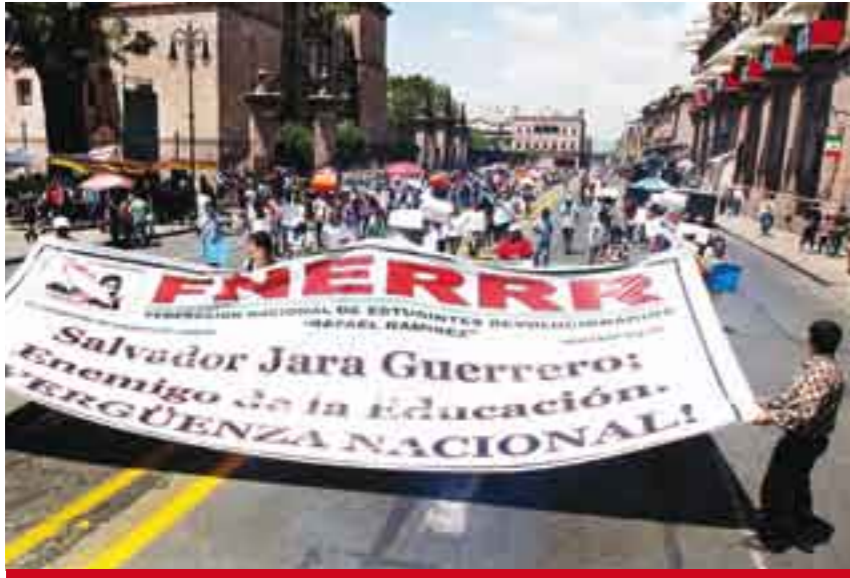
Moradores michoacanos, contra la suspensión del subsidio que propone Jara.

promoverla, nosotros vemos que no quieren atendernos.