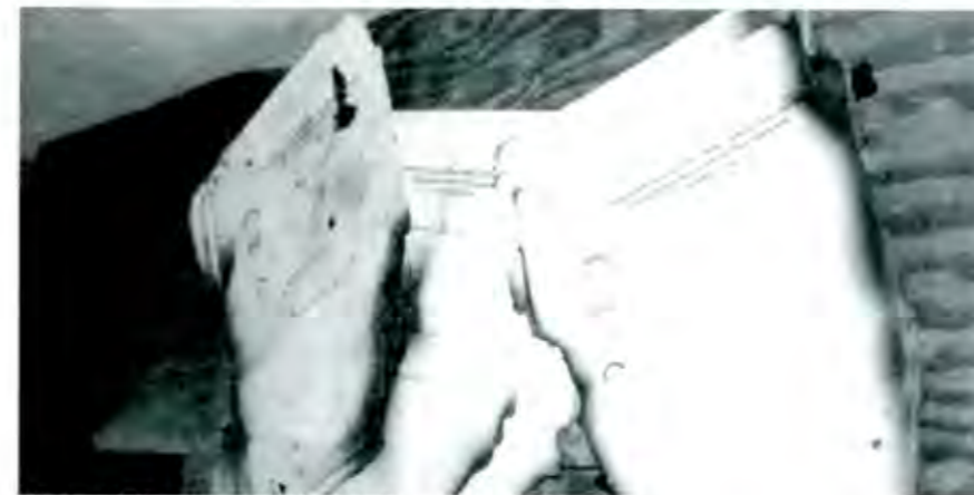
Militantes del PRD volvieron a hacer de las suyas...

fueron 53 mil personas y con base en los sondeos y resultados de la jornada, el número de electores superó los 75 mil en esta ocasión.