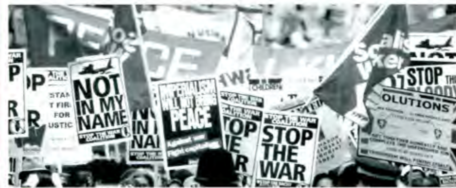
La manifestación más grande en contra de la guerra...

Y se dan ejemplos concretos. Los ciudadanos de un país libre tienen garantizado el derecho "irrestricto" a la asociación y manifestación pública de sus ideas, si, pero siempre y cuando no perjudiquen derechos de terceros y no pongan en peligro la paz pública, es decir, siempre y cuando, al ejercerlo, no provoquen ningún efecto negativo y sea, por tanto, absolutamente inocuo, lo cual es exactamente lo mismo que si tal