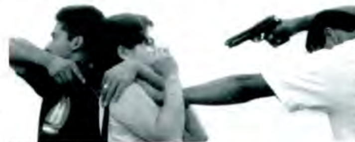
Víctimas del hampa