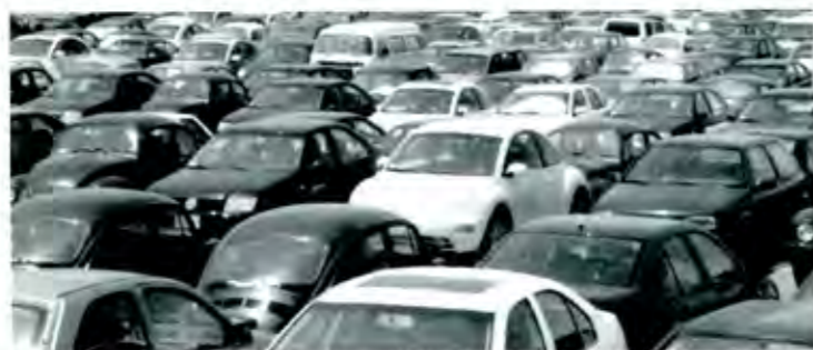
Se harán los modelos de operación en algunos centros comerciales