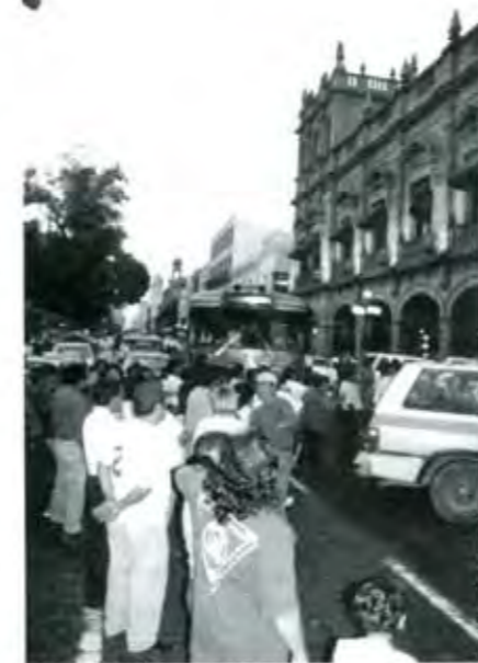
El reclamo por la alteración en boletas...

Al respecto, la Secretaría de Gobernación municipal reportó la participación extraordinaria, pues sus referencias del proceso de hace tres años les informaron de que los votantes sólo