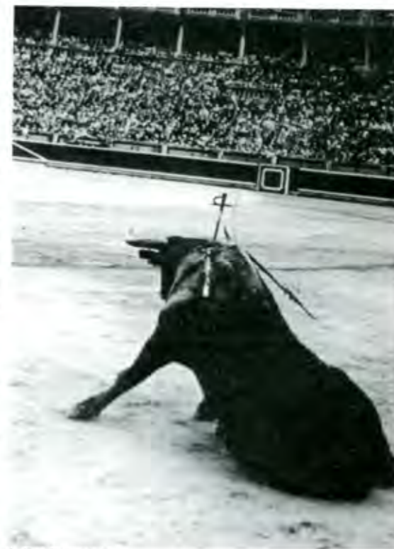
La España sangrienta

No deje de ver esta exposición que la embajada de España nos esta presentando y que podemos admirar en "La casa de las bóvedas antes pinacoteca universitaria y que sé allá en la Avenida Palafox y Mendoza, sin costo alguno, hacia el 412.■