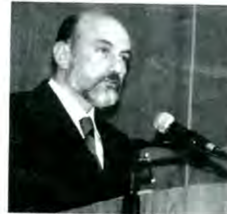
Felipe Bravo Mena, dirigente nacional del PAN

El Partido Acción Nacional y los grupos empresariales, han iniciado una andanada de ataques contra el Congreso de la Unión y en especial contra algunos destacados diputados y senadores, porque no se someten a la voluntad del Presidente de la República.