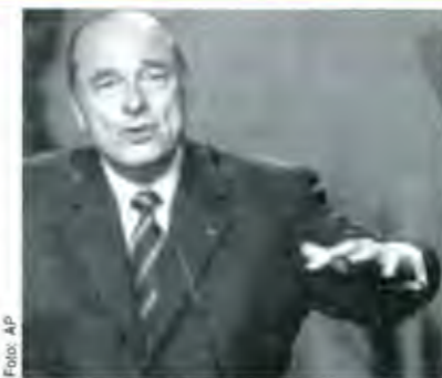
Jacques Chirac / Jean-Marie Le Pen

Pero lo ocurrido el 21 de abril no se debe sólo a circunstancias nacionales, sino que parece ser parte de una situación más general. Con notables diferencias, es cierto, pero el desempleo sigue siendo elevado en la región: en Italia alcanza el 9.5%, en Alemania el 8% y en España, aunque ha venido decreciendo, en el 2000 llegaba al 14%. Y no es mera coincidencia que las reacciones políticas sean en cierta medida semejantes a la de Francia. En Austria, por ejemplo, la ultraderecha se convirtió en la fuerza mayoritaria en el gobier-