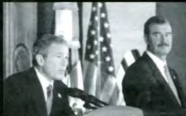
Estados Unidos ha emprendido una lucha "en defensa de los derechos humanos"...

A pesar de que el Senado, corresponsable de la política exterior