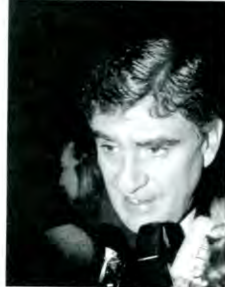
¿Será cierto que se harán los 4 estacionamientos?

Entre tanto en Puebla se recuerda a los poblanos que o van a su feria o la recordarán de a platicadas porque es la última que se celebra con las características definidas desde hace 32 años.