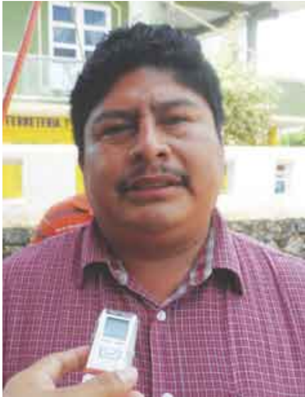
Alcalde denuncia la falta de apoyo federal.

gramas sociales implementados por los Gobiernos estatal y federal, como es el caso de Oportunidades , sólo son “paliativos” y no atacan a fondo de problema de miseria extrema en que viven los habitantes de Sotepan.