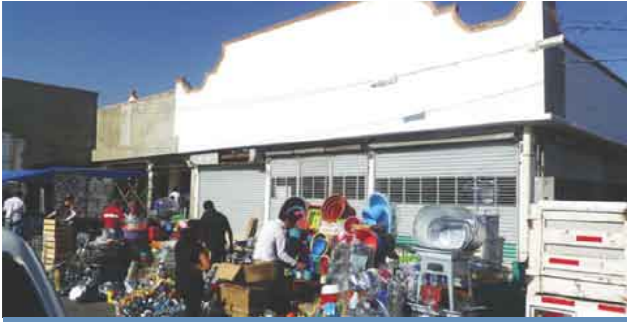
Ambulantes favorecidos por el panismo.

y que la instalación de vendedores ambulantes inhibe el acceso de la clientela al mercado.