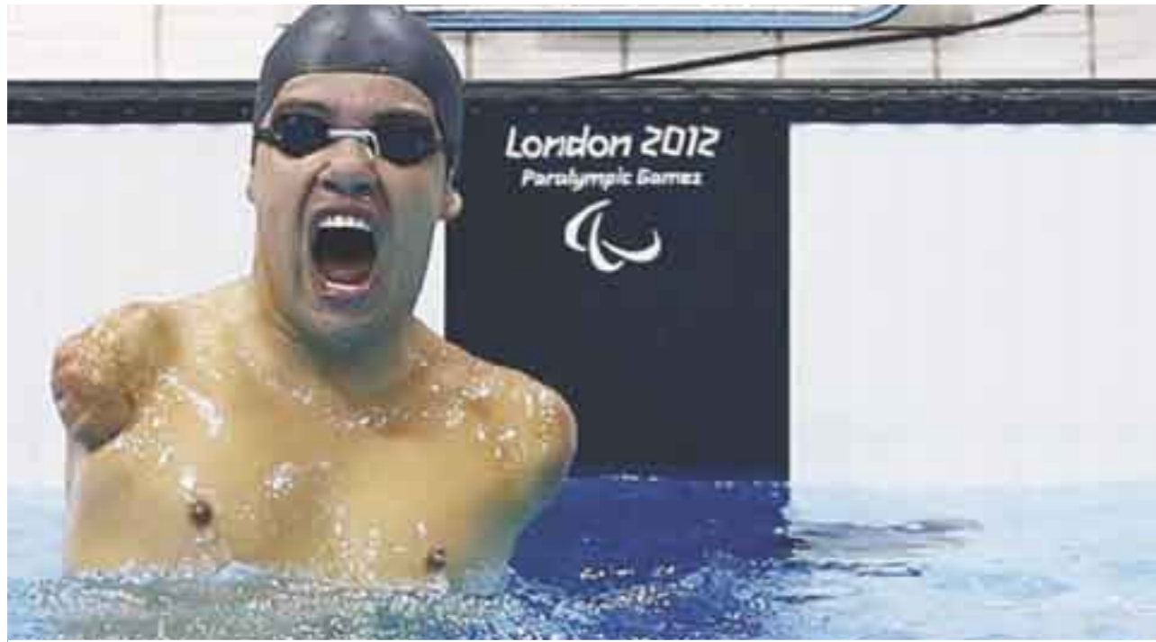
Orgullo mexicano sin apoyo gubernamental.

a Personas con Discapacidad. Estas limitaciones se observan lo mismo en las leyes que en las instituciones y en los programas gubernamentales.