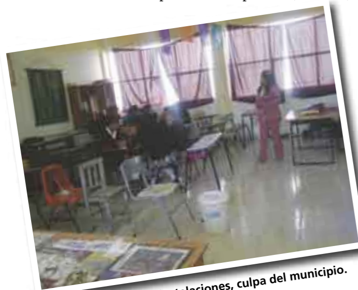
Rezago en instalaciones, culpa del municipio.