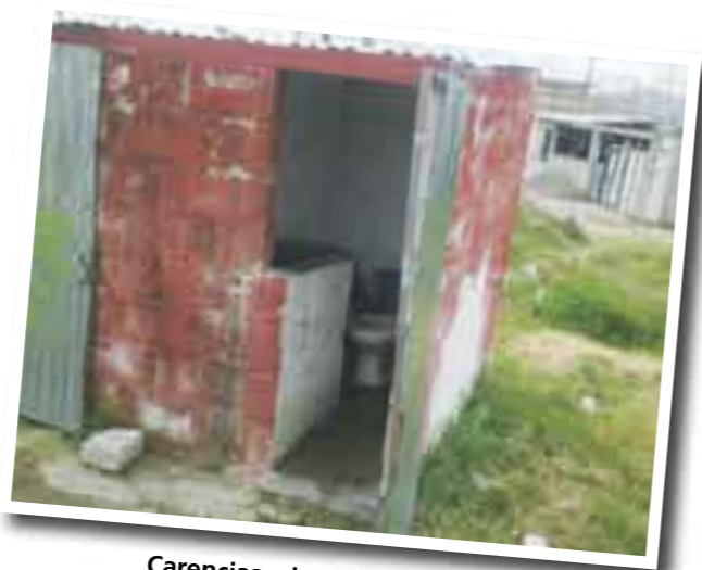
Carencias a la vista que no se quieren ver.

Este bachillerato se creó en 2005 y obtuvo la clave cinco años después, por lo que las generaciones que egresaron fueron cobijadas por otras escuelas para obtener sus documentos.