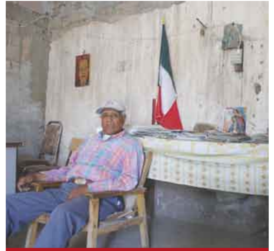
Ejidatarios pilenses, víctimas del saqueo de Logistik Park.