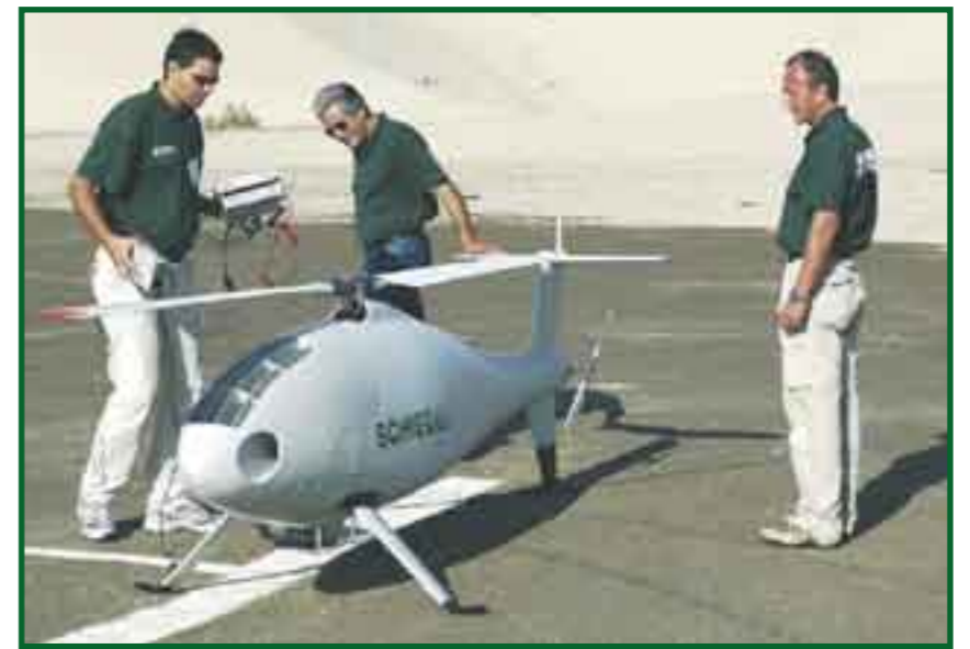
Drones. Las "armas del futuro", toda una realidad.

En los últimos años Argentina, Brasil, Bolivia, Cuba, Ecuador y Nicaragua, entre otros, se han