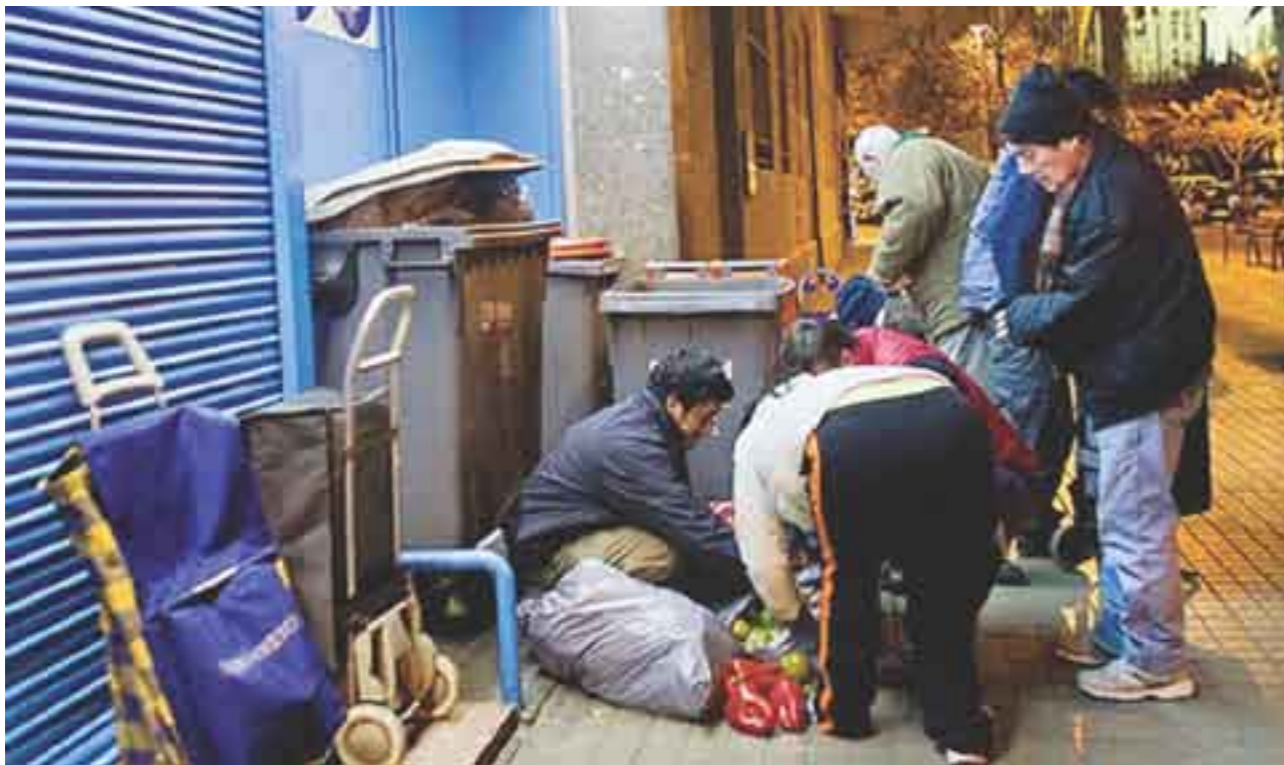
Europa. El continente vanguardista, paralizado por la crisis.

también se sumaron a la convocatoria, por lo que no hubo noticias por televisión ni periódicos, y los servicios que se ofrecieron en los hospitales fueron mínimos. Pese a ello, programaron manifestaciones en Atenas, la capital.