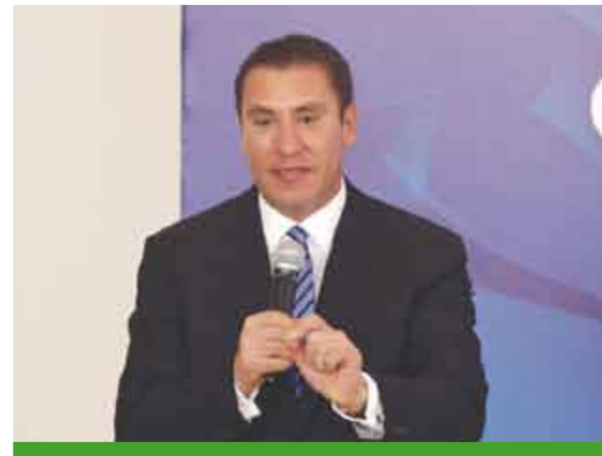
Rafel Moreno Valle.

Empresas como Jumex han firmado el equivalente a una carta compromiso de compra, por ejemplo, con productores de naranja, para adquirir hasta dos mil 500 toneladas del cítrico, pero no ha otorgado apoyos económicos por