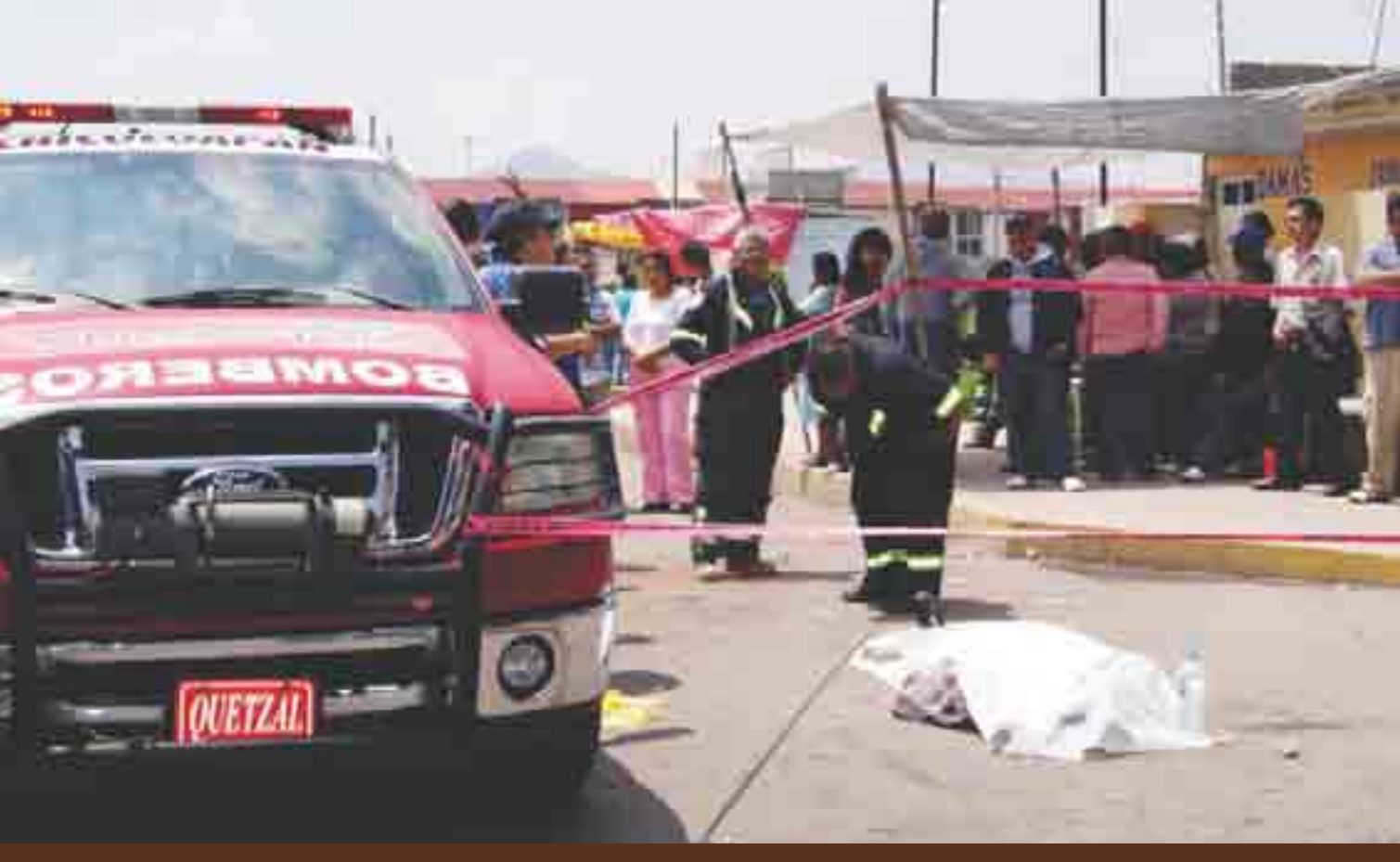
Las bajas y los heridos, siempre del lado antorchista.

po de antorchistas resguardando su fuente de trabajo. En el lugar también se encontraban seis elementos de la Policía Estatal y dos patrullas.