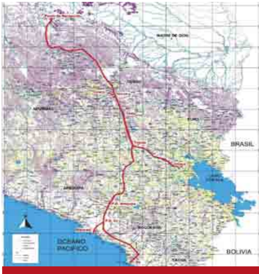
El proyecto internacionalista de Chávez. Gran Gasoducto del Sur.

que circunda al Lago Maracaibo, cuya importancia estratégica es significativa por partida doble: al mismo tiempo que es la cuenca de agua dulce más grande de América Latina, alberga las mayores reservas de crudo y gas de América.