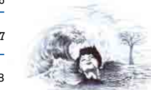
Adiós Frente al mar Letanías de la tierra muerta