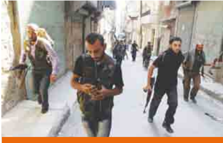
Intervencionismo estadounidense a través del Ejército Libre.

entonces se registran fuertes enfrentamientos entre ambos grupos. Hoy en día el Ejército Libre de Siria tiene el control de Alepo, considerada la capital económica de Siria.