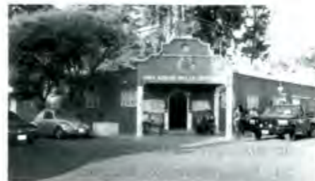
Los candidatos han denunciado la intervención de la autoridad municipal en favor de planillas del PAN...