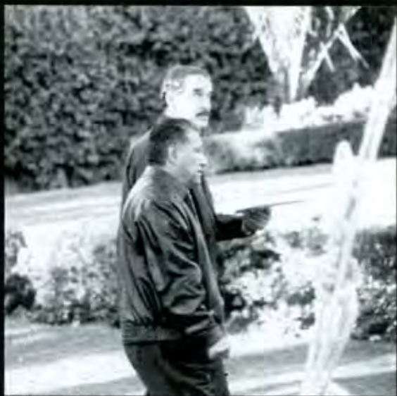
Lo poco que se sabe del Plan Puebla-Panamá es preocupante

Un inconveniente más del Puebla-Panamá es la manera vertical, autoritaria e impositiva con que se está poniendo a los gobiernos centroamericanos y estos mexicanos incluidos, sin que haya una consulta previa, sin que se informe a la gente, universidades y distintos sectores sociales. En este contexto, los Ejecutivos estatales también se han mostrado indiferentes ante el PPP, como lo demuestra el hecho de que en Puebla no haya nadie encargado de su aplicación. ■