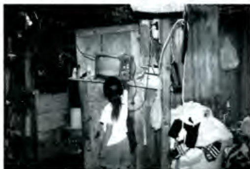
En vez de apoyar a planillas el Ayuntamiento debería resolver la pobreza y apoyar la vivienda...

Madrazo y sus huestes que tratan de inyectarle fuerza al tricolor, y que mejor inyección que la que proviene del Senado. Necesitaban emitir una imagen de unidad al interior de este partido y lo lograron. Por esta razón notamos a un Roberto Madrazo muy reservado a la hora de emitir comentario alguno sobre el tema, y de cierto respeto ante la actitud del Senado. Ello obedece a que los tiempos electorales se avecinan, y sabe que lo que menos necesita el partido, si quiere retornar a la presidencia, es mostrar una imagen de confrontación interna. Si recibió el mensaje, quedará demostrado en la futura conformación del Congreso en el 2003, para de ahí cerrarle cualquier posibilidad de cambio al presidente Fox. Hacia el exterior, las cosas son más claras. El gobierno de Fidel Castro asiste a sus últimos días, motivo por el cual no está dispuesto a ceder liderazgo alguno al interior de su patria para que puedan existir libertades políticas básicas. Por eso apela al PRI y al PRD. Los tres tienen algo en común; son antidemocráticos. Paradójicamente, los tres emprenden la lucha en aras de un tema vital para la democracia; la cuestión de los derechos humanos. Sin embargo, y ya que estamos sobre el tema, ¿qué ha pasado con el caso de Digna Ochoa? Porque las hipótesis que nos han mostrado para cerrar el caso no dejan conforme a la sana razón y al juicio crítico. ■