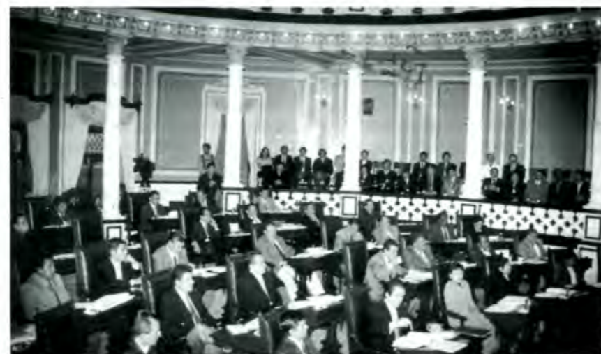
Queda demostrado que los poblanos emitieron un voto poco razonado

Todos, sin excepción, han manifestado que sus proyectos carecen de rentabilidad, además que dañan severamente el patrimonio cultural poblano y de la humanidad. ■