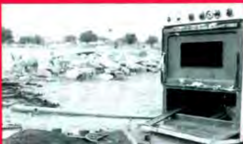
El derecho a la vivienda es el reclamo de un derecho humano elemental...

superficie habitable, es decir, auténticas celdas carcelarias en donde el adquirente, si tenemos en cuenta a la familia mexicana media, tendrá que meter a la esposa, a 5 hijos, a él mismo y, en no pocas ocasiones, al abuelo, a la abuela y algún otro pariente en desgracia. Las cosas están llegando a tal extremo que los fabricantes de muebles están reduciendo, a su vez, el tamaño de las camas para que puedan caber en la cáscara de nuez de las "modernas" habitaciones. Las conocidas como camas "matrimoniales" están desapareciendo del mercado.