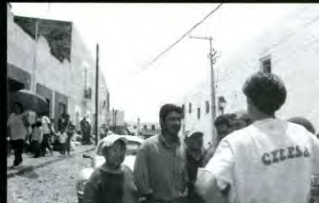
Desalojados en Casa Aguayo

En estos momentos estamos persiguiendo cuatro objetivos principales. El primero, que se nos regresen las pérdidas que tuvimos el día Sábado por el desalojo, en el cual los granaderos y