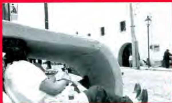
Que se atiende el reclamo de vivienda popular...

Morelia, Michoacán a 15 de abril de 2002.