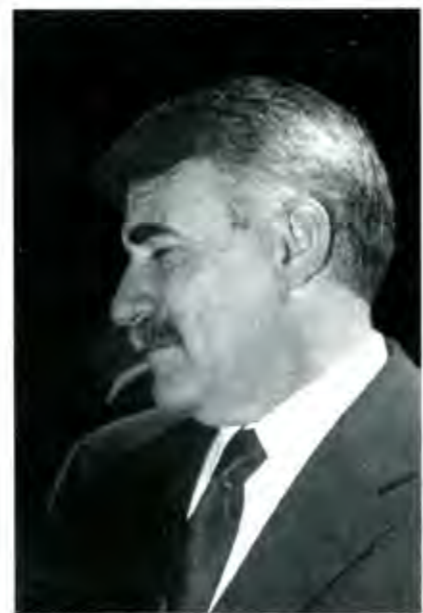
Panista poblano nacido en Oaxaca...

Los panistas siguen siendo un partido sin estructura, salvo en algunos municipios. Sus triunfos electorales han sido coyunturales, por los errores del PRI a la hora de elegir candidatos. Difícilmente podrán ganar la gubernatura como algunos piensan, en las elecciones locales próximas, máxime que sus autoridades municipales, las que triunfaron en noviembre y que gobiernan 50 municipios, no dan una y aprenden muy lentamente el arte de gobernar. ■