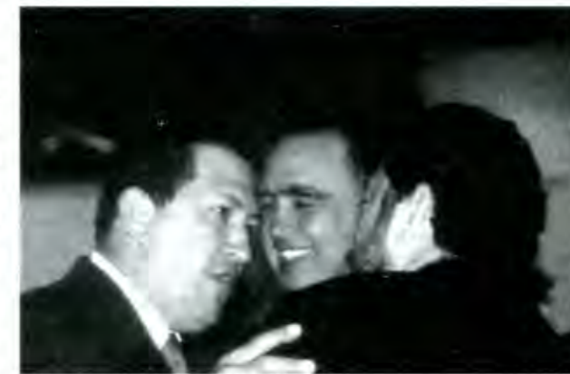
Restituido en su cargo por una manifestación popular...

México, Distrito Federal, a 15 de Abril de 2002.