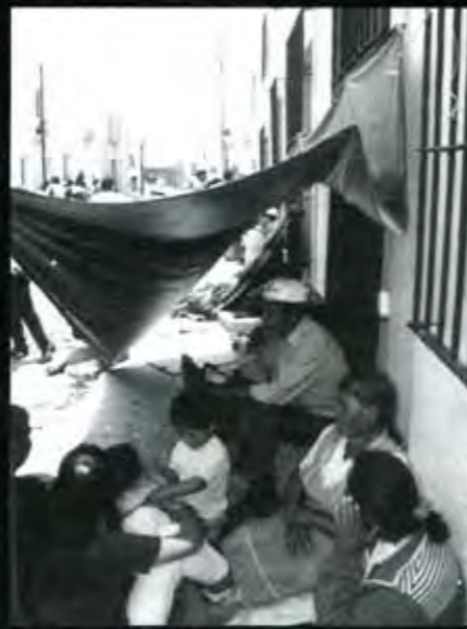
Desalojados piden vivienda

Si esta más necesitado que yo y todavía tengo fuerzas para luchar si no se lo dejo lo compartiría, porque yo creo que alguna gente esta enferma de egoísmo ciego y ello no está bien, pues no le permite sentir las necesidades de los demás seres humanos. ■