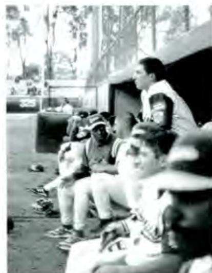
Pericos de Puebla

El guión parecía lo había escrito Albert Hitchcock. En el primero de la serie los tigres lograron empatar en la novena entrada y todo se tenía que resolver en extra-innings; fue en la parte