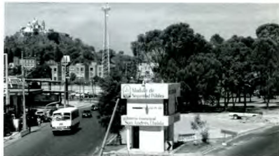
Límites: ¿La corte o el plebiscito?

Todo empezó cuando la zona de Angelópolis se comenzó a cotizar por la llegada de fuertes inversionistas, re-