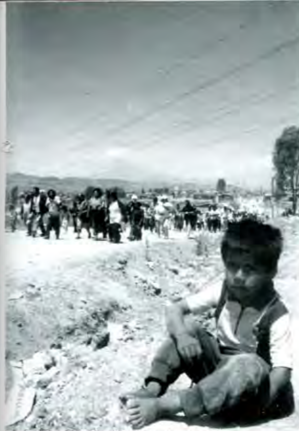
El problema de la vivienda, uno de los más grandes y lacerantes