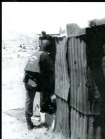
Buscando a quien desalojar...

mos en la mejor disposición de pagar si hubiera un dueño, nosotros nunca nos hemos opuesto a pagarle a este.